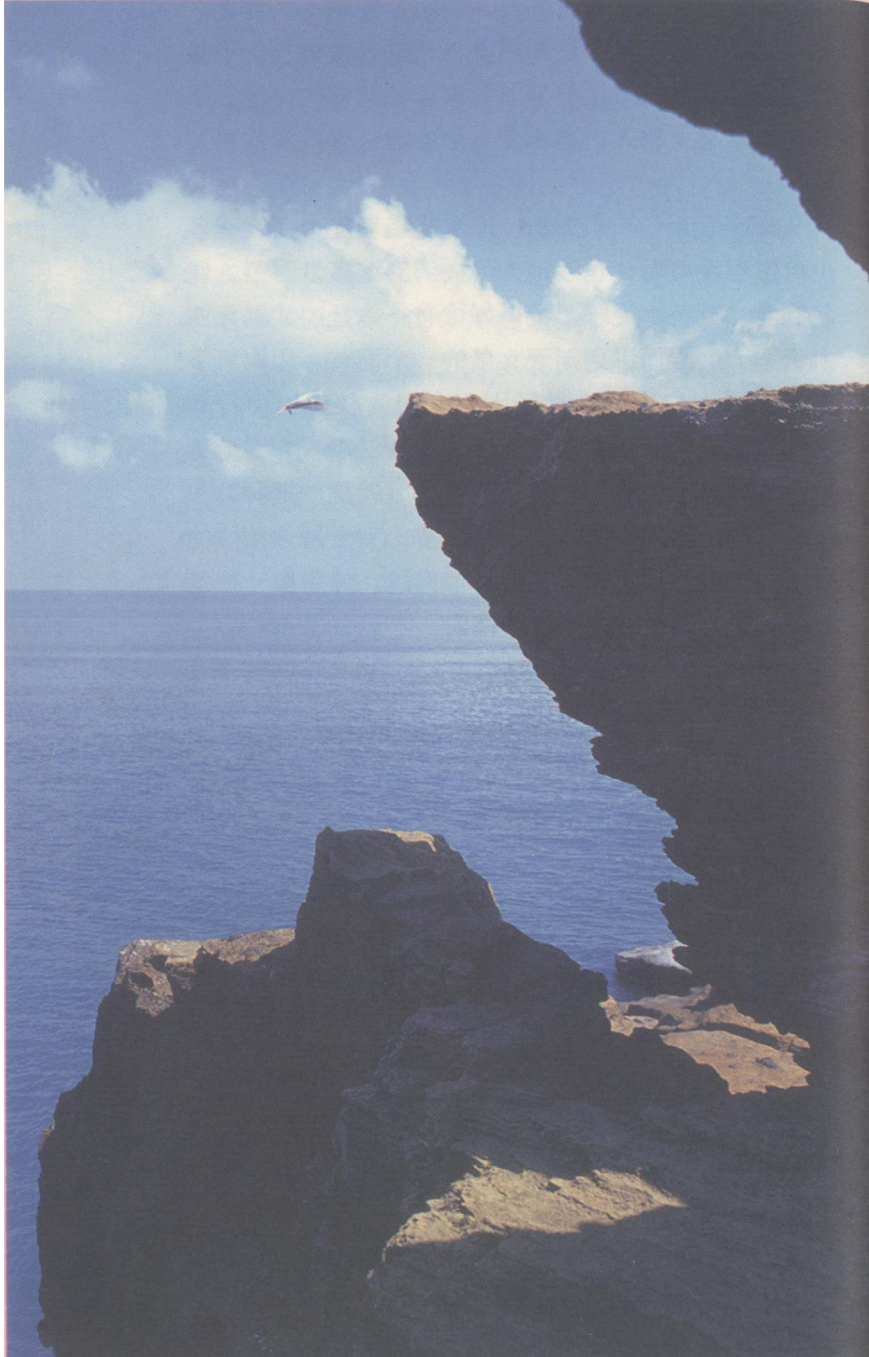
珍珠池之一

节，偶尔偷看“黄色小说”，记得好像有一本是《武则天四大奇案》。里面讲到则天女皇的一个面首，因本事了得，深得女皇宠爱，仗了则天女皇的权势，横行霸道，无恶不作，被代表正义一方的狄仁杰一方逮个正着，便强行“阉割”。所用的道具，就是一把利刀和半筐石灰，根本没有什么消毒麻醉，完全是杀猪似的硬来，夜读至此，很是有些心惊肉跳，伸手摸一把自己的，还好端端地蜷缩在裤裆里，才安心睡去。