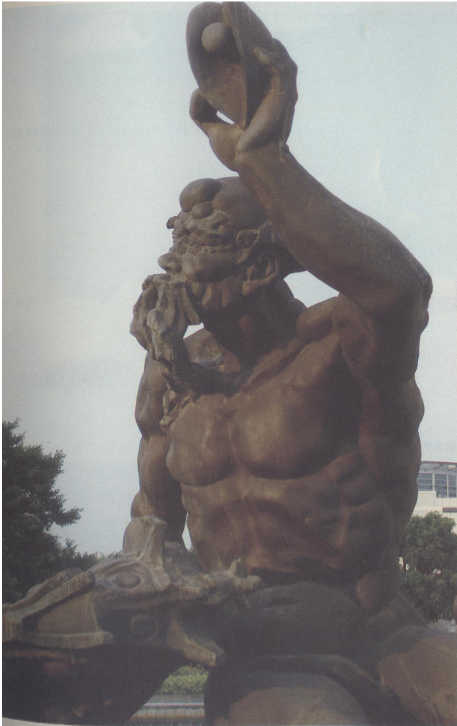
采珠城雕