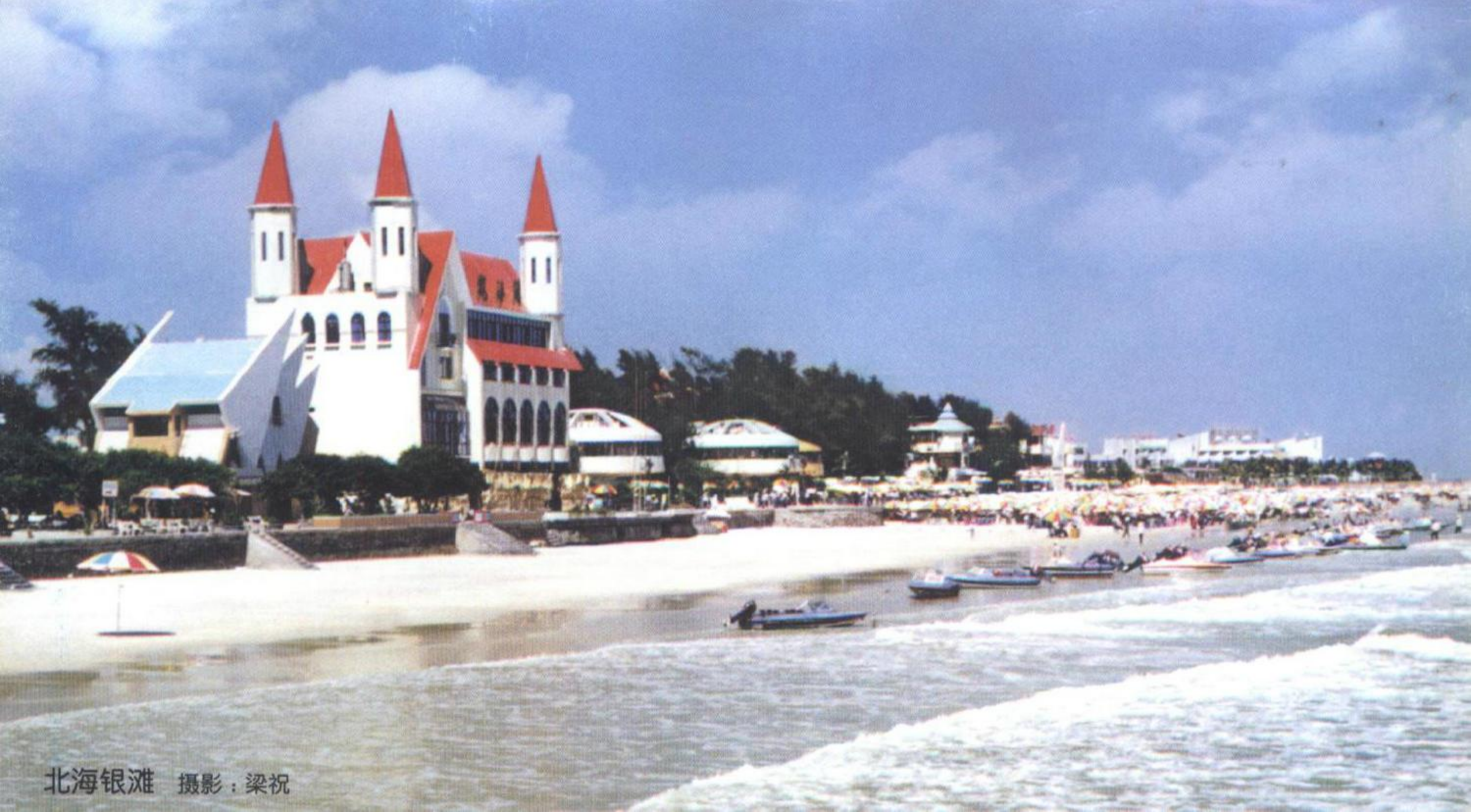
北海银滩