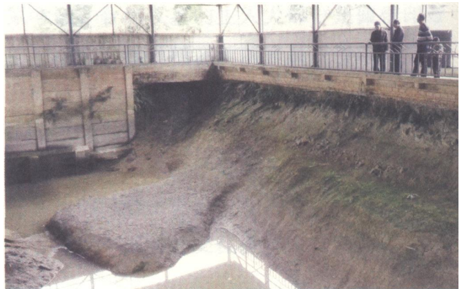
大浪古城遗址

文物工作队在大浪古城遗址范围内发现了数量众多的刻划纹和几何印纹陶片。有泥质陶和夹质陶两种，颜色以灰黑色为主，少量红色和灰色，纹饰有方格纹、米字纹、水波纹、回字方格纹、席纹等十多种，纹饰纤巧繁缛、拍印清晰，与当地发现的东汉墓甚至西汉晚期的出土遗物迥然不同，年代当属西汉早中期。