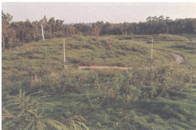
合浦汉墓群金鸡岭重点保护区

合浦汉代文化博物馆馆藏合浦汉墓群出土文物有 5000 多件藏，其中一级品达 21 件。一件出土于 1986 年的东汉铜提梁壶，密封的壶里甚至还有酒。