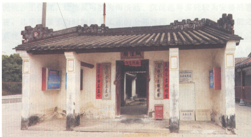
永安城隍庙

明初，倭寇猖獗，不断侵扰我国沿海地区，百姓深受其害。洪武二十七年（1394年），中央朝廷诏命沿海备倭，在全国沿海海防要塞设置卫所，筑城镇守，防倭寇侵袭，保境安民。《廉州府志备倭》载：“皇明洪武二十七年七月，始命安陆侯吴杰、永定张金宝等率致仕武官往广东训练沿海卫所以备倭，是时方有备倭之名，天下镇守凡二十一处”。其中的永安守御千户所是我国最南端的明代海防要塞。《廉州府志·军备》载：“永安城守御千户所旧在石康安仁里，洪武二十七年（1394年）为海寇出没奏迁于合浦海岸乡，千户牛铭始建城”，是时建有“城濠、窝铺、门楼。城周围四百六十一丈、高一丈八尺，阔一丈五尺，窝铺一十八间，城楼四座，濠周环五百丈。”北部湾海边，扼“高、雷、琼海道咽喉”，海防军事战略地位重要