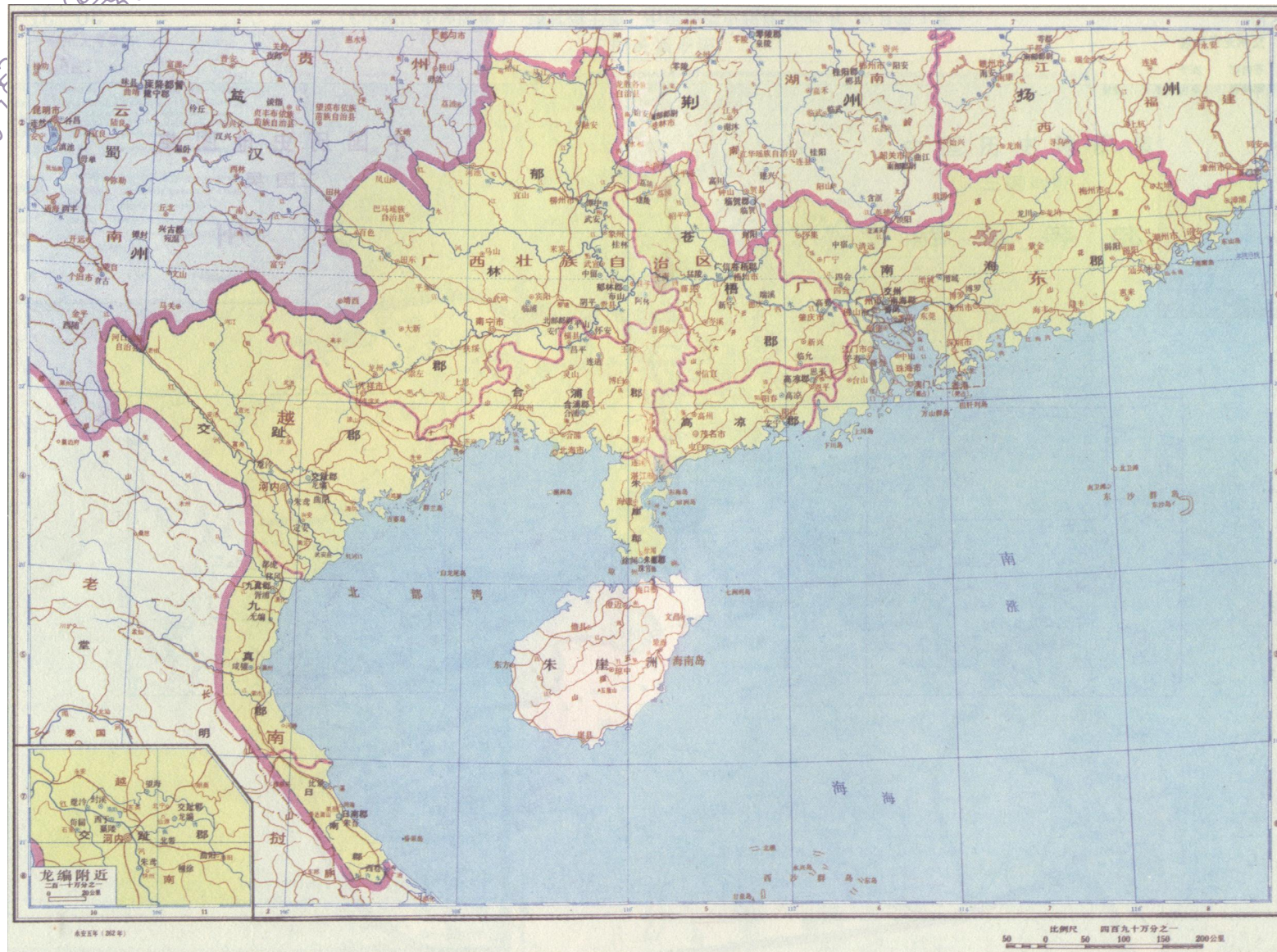
三国：吴·交州 （《中国历史地图集》，谭其骧主编，中国地图出版社1982年10月第1版）