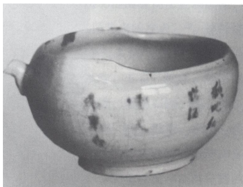
图三 中华民国粉彩锦地开光仕女纹罐

六方诗句纹茶壶、吉祥文字纹酒罇（舀酒具，图二）等。青花瓷品种和器形丰富多样。罐、壶形制匀称，漏肩，广腹，收足，造型略显粗笨；器胎厚重，瓷质灰白或浅灰色，多有杂质；釉色早期偏蛋壳青，后期呈灰白，器足常见缩釉痕；青花发色多显灰黑深蓝色，着色浓重，多有铁锈斑；纹饰有龙纹、花鸟纹、山水纹、诗文纹等，风格上直接传承景德镇传统青花瓷纹饰样式，只是画工较粗；罐、壶内壁多遗留有拉坯粗弦纹，花瓶多见上、下接胎不修内壁，圈足早期两面修胎截面呈倒三角形，圈足内砂底，具有明代景德镇制瓷业的典型遗风，后期圈足多呈泥鳅背，内施满釉。凤尾尊下部矮短，颈部呈较长的喇叭形，撇口；葫芦瓶造型规整，比例匀称，接近仿生型，颈口长短适中。酒罇器器身扁壮，敛口，深腹，圈足，常见雕饰兽面纹流；瓷胎仍以灰白为主，胎质欠细密；釉色多呈蛋壳青偏浅灰白色；前期青花发色灰黑泛蓝，多见铁锈斑点，后期青花蓝灰泛青，发色粉淡，呈色不稳定有晕散。晚清至中华民国时期，小江窑瓷器烧造进入空前繁荣的阶段。此阶段小江窑不仅烧制青花瓷，还烧制青花釉里红、五彩、粉彩、釉下红绿彩和单色釉瓷等，代表性器物有青花花鸟纹花觚、青花釉里红吉祥纹瓶、粉彩三国人物故事纹赏瓶、褐釉透雕双钱纹鼓形枕、釉下绿彩八仙人物纹葫芦瓶、粉彩开光人物纹罐（图三）。该时期，小江窑瓷器形制更加丰富多变。