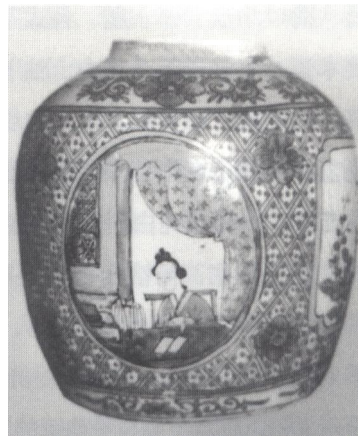
图二 中华民国青花诗句纹酒罇

有些器物为浦北民间百姓日常生活所独有的用具，器物乡土气息浓重，朴实笨拙，如瓷捉蚊灯、瓷油漏斗、酒罇、麻盅等。还有不少器物纹饰题材直接来源本土自然生活，如鹤哥纹、青蛙纹、猫纹、水牛纹、打油诗纹等，凸显山区农村地域特色。此时期瓶罐上下接胎痕明显，器足修胎粗糙，多见泥鳅背圈足；青花瓷胎灰白，彩瓷胎质灰黄居多；釉层不匀，多见有“波浪釉”和“橘皮釉”现象，器足多有缩釉斑痕；青花发色以洋蓝为主，色泽泛蓝飘浮，常有晕散；五彩、粉彩瓷器色彩以红、黄、蓝、绿为主，着色浓重，色层堆积不匀，画工较粗糙；釉下红绿彩瓷器为民国时湖南醴陵窑釉下绿彩瓷技术传播影响后烧制。小江窑釉下红绿彩瓷器以绿彩为主，绿彩有深绿