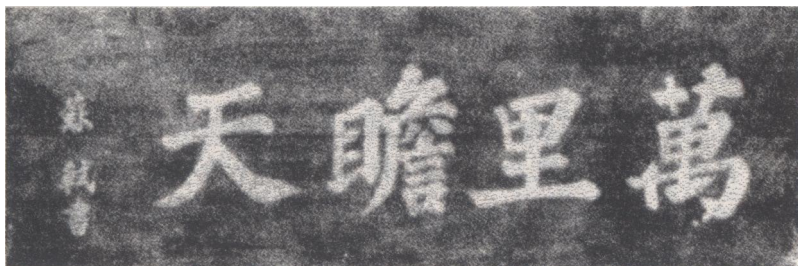
图 1-6 苏东坡亲笔书写的“万里瞻天”字匾

苏东坡在合浦畅游了三廉古刹东山寺，参观了还珠亭和海角亭等名胜古迹。海角亭建在廉江边，面临浩瀚的大海，远处的潮声清晰可闻。远望茫茫大海，回想自己流放天涯的艰辛以及亲人的离散，庆幸自己此次北归不仅能与家人团聚，而且将能重新为国效力，苏东坡深有感触，挥笔写下了“万里瞻天”四个大字，抒发自己对国家、对亲人的思念之情。