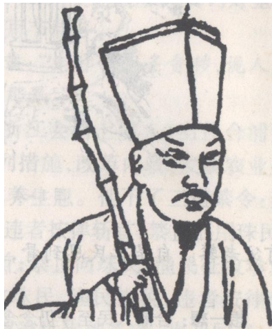
图 1-5 苏东坡像

我国宋代著名文学家苏东坡(1037-1101)，在文学史上是唐宋八大家之一，是继欧阳修之后的文坛领袖。