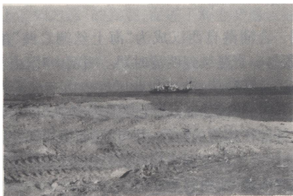
图 1-2 北海港旧码头图

中国封建社会特有的闭关锁国政策，代代都有延续，但是这条“海上丝绸之路”两千多年来却一直断断续续地发展。原因有：合浦北海有“玳瑁、珠玑、果、布”等丰富物产，对外国商人有很大的吸引力，所以闭港的铁幕，往往由外力而冲破；这里海上交通便利，与越南毗邻，中越之间的民间贸易来往频繁；历代皇帝和地方官府，有时出于政治上和经济上的需要，在某个时期、某个局部地区，也采取一些开放政策，促进对外贸易的发展。