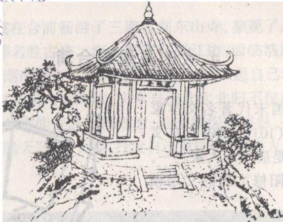
图 1-4 还珠亭

孟尝离任时，合浦成千上万的老百姓哭声相送，攀辕挽留，他只好在深夜偷偷上船，沿南流江北返。明朝甘泽的《孟太守祠》诗说：“为官合浦去珠还，万古流芳天地间。富贵心轻犹敝屣，贞廉名重并高山。来时岭外神人惧，去时辕前父老攀。自是仁民恩到骨，至今祠屋祀天南。”