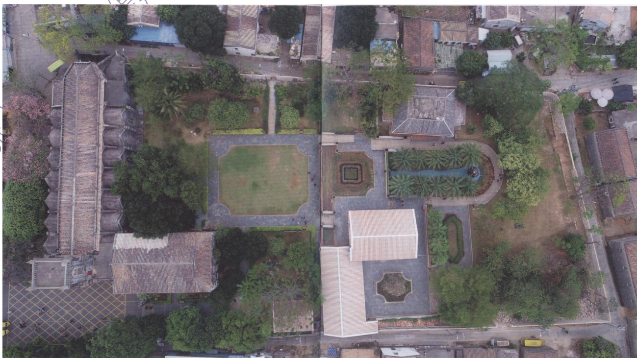
俯拍天主堂全貌

岛上渔民在每年农历三月二十三日妈祖的生日那天，还有农历十月收获季节，都要在这座庙里举行隆重的庆祝仪式，感谢妈祖保佑平安，赐予丰收之恩。每逢初一和十五，他们也会到庙里烧香求拜。每年岁末，濶洲岛还要举行一次妈祖出游活动，这一天，濶洲岛热闹非凡，大人小孩倾城出动，有如过节一般兴高采烈。