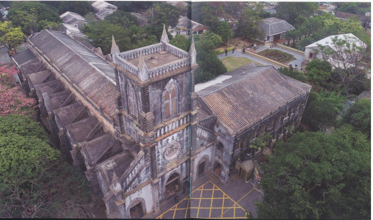
俯拍天主堂

关于这口井，有一个神奇的传说故事。说的是早年有一巡抚上岛巡查，淡水耗尽，官兵四处寻水，发现此地有一茅舍，内有一口井，井虽小而水却取不尽。官兵取水后见四下无人，便一把火烧了茅屋，用草填盖井口。返回船上开船时，无论船工怎么努力，船却纹丝不动，起不了锚。大海茫茫，此时官兵们仿佛看到船的锚头上站立着一位衣着洁白的女子，慈祥而肃穆地望着他们。官兵立即醒悟，统统双膝下跪，磕头忏悔，女子遂飘然离去。官兵心存悔意，临行时捐献金银，嘱咐岛民修建此座妈祖庙，自此庙里香火不断。