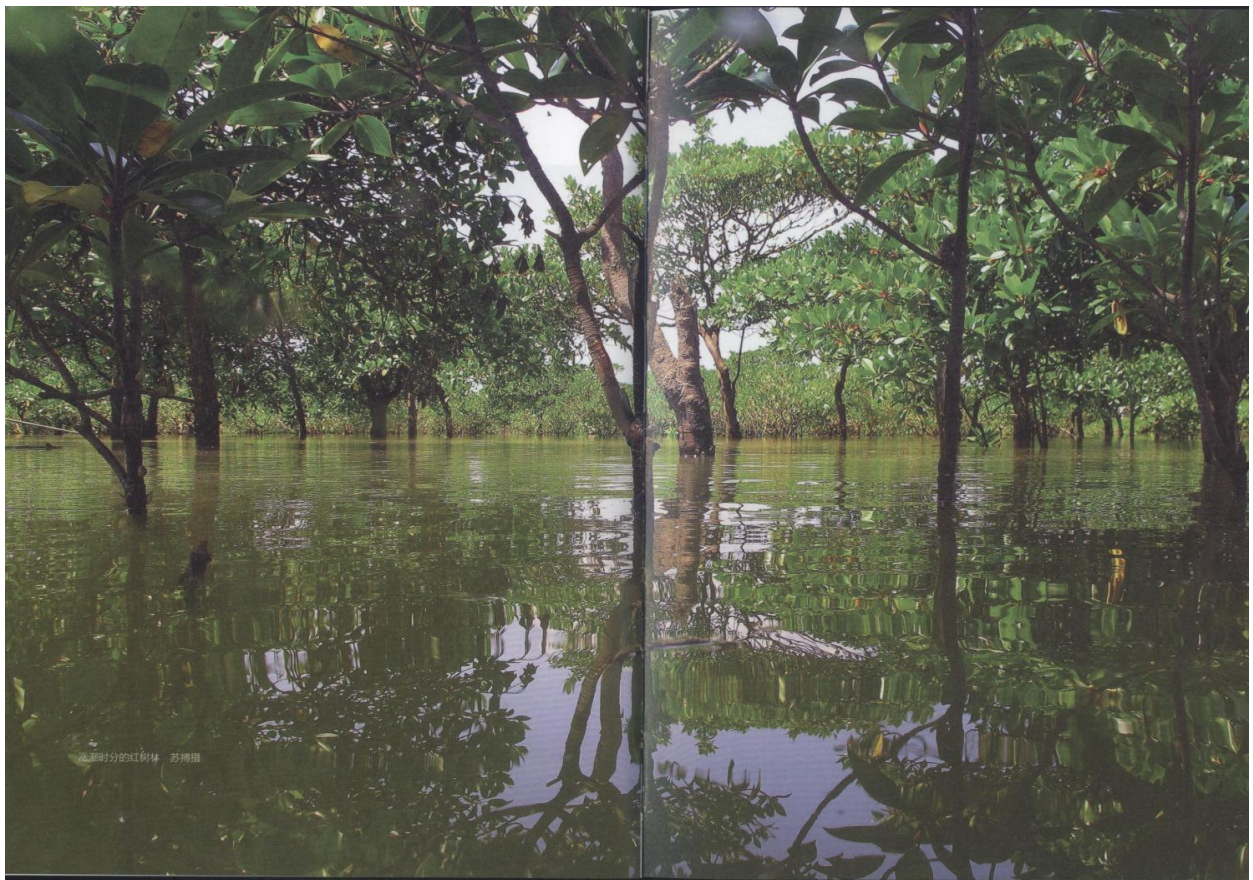
涨潮时分的红树林