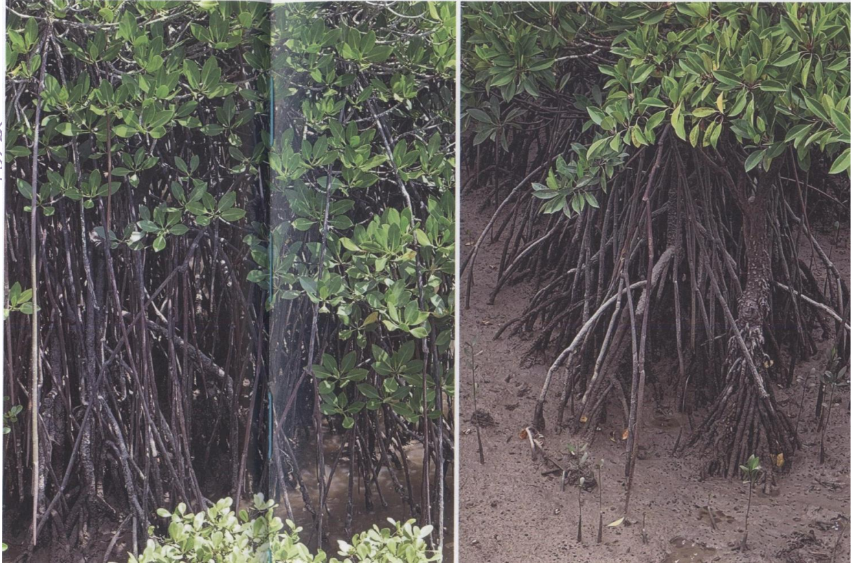
红树林发达的根系