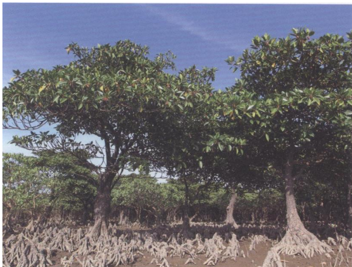
红树林发达的根系

被称为“海岸卫士”的红树林，它最大的特征是有密集而发达的支柱根。参观红树林景区，在栈桥上你就可以看到，那绿叶覆盖的下端长着密密实实的支柱根，这是植株为了保持本身的稳定，将支柱根牢牢地扎入泥滩里，同时，还要从根部长出许多气生根露出于海滩地面，这些气生根也称为呼吸根，在退潮时或者潮水淹没时可以用来通气。这种根部的构架不仅支持着植物本身，能够使红树林在海浪的冲击下屹立不动，保护海岸免受风浪的侵蚀。盘根错节的发达根系还能有效地滞留陆地卷来的沙尘，减少近岸海域的含沙量。所以人们称红树林为“海岸卫士”。