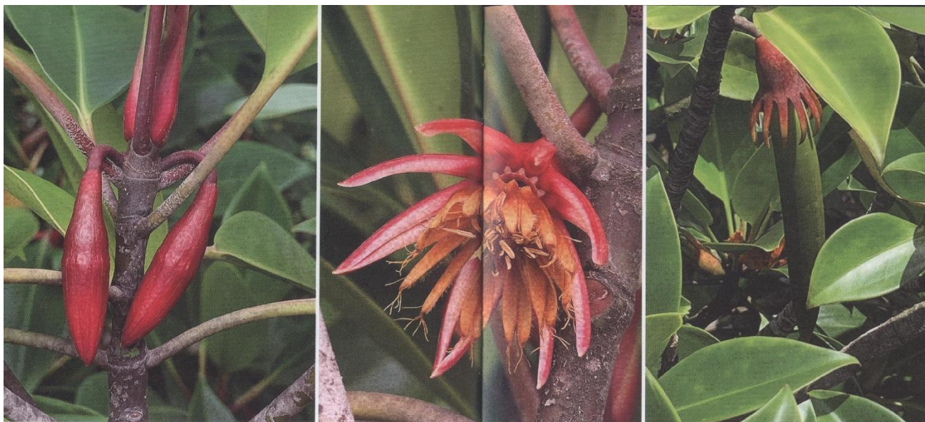
红海榄的花与果实

知晓这个地方的历史。军话是我国南方一些地区一种含有官话成分的混合型汉语方言，那是由于军队驻防或屯垦而形成的地方语言。明代中央政府为了加强军事管制建立卫所制，在广西大量设置军屯，所实行的都司卫所制度使得南下汉族士兵和劳工与当地民族的关系凸显了军事的特点，这些士兵和劳工来自五湖四海，与当地民族融合之后，逐渐形成了能够相互沟通官话中的一种——人们就将此种语言称为军话。军话的形成应该算是一种历史现象。山口镇里的居民有一部分是这些人的后裔，他们祖上主要是明、清两朝派驻戍边的军队士兵或劳工，也许因为他们希望避开中原的战乱，也许因为这里富庶，生活比较安逸，所以驻扎在此地后再也没有离开。由此也可见合浦自古就是一个军事要地。什么是海话呢？何主任说，近几百年来，陆陆续续有从广东、福建迁徙到广西沿海的渔民，来到合浦这个富饶的地方，他们就聚众而居，不再往西走了，他们不同的语言也逐步演化，形成了现在的海话。