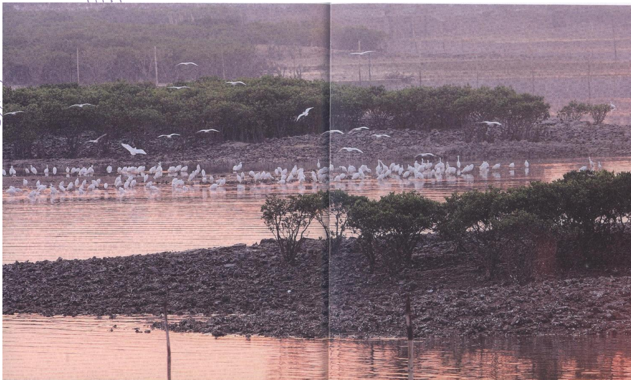
栖息在红树林保护区内的白鹭