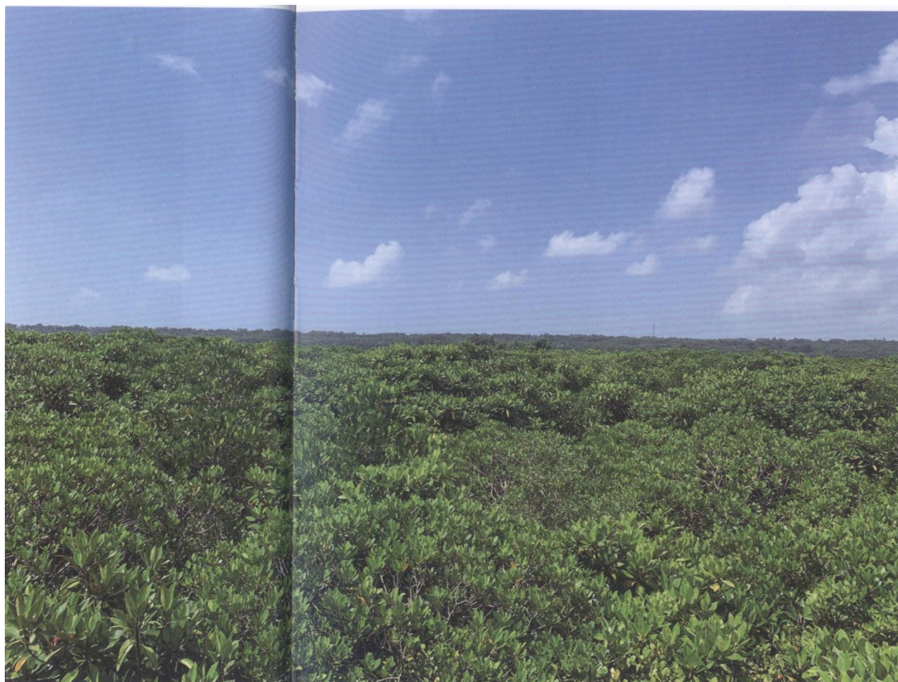
一望无际的红树林

色丝带。金滩绵延 20 多里，滩平坡缓，沙质细腻，因为此处生长着大片红树林，所以海产品资源也非常丰富。贝类、鱼、虾、蟹等生物在此繁衍栖息。这里还是鸟类的天堂，在红树林里栖息着各种各样的海鸟，其中数量最多的是白鹭。春夏季节，一群群白鹭怡然自得地在红树林间觅食玩耍，偶尔被渔人惊起，一时间百鸟飞翔，那景象真是壮观。退潮时宽广的沙滩上留下无数的贝类、螃蟹、沙虫、泥丁等，此时当地的渔民男男女女都会拿着工具，走出家门去赶海。沙滩上有一个个小洞，若是洞口里有水并有小气泡，那就说明洞里有东西，渔民会迅速把小洞挖开，很快地掏出里边的东西，有时是沙虫，有时是贝类。不一会便把容器装满，在回家的路上那一挑或一袋的鱼虾螺蟹都有买家等着了，讲价、收钱，然后高高兴兴地回家。赶海的时间就在退潮和涨潮之间，渔民必须抢时间，尽快地挖到足够的海产，一个“赶”字真是足够生动。