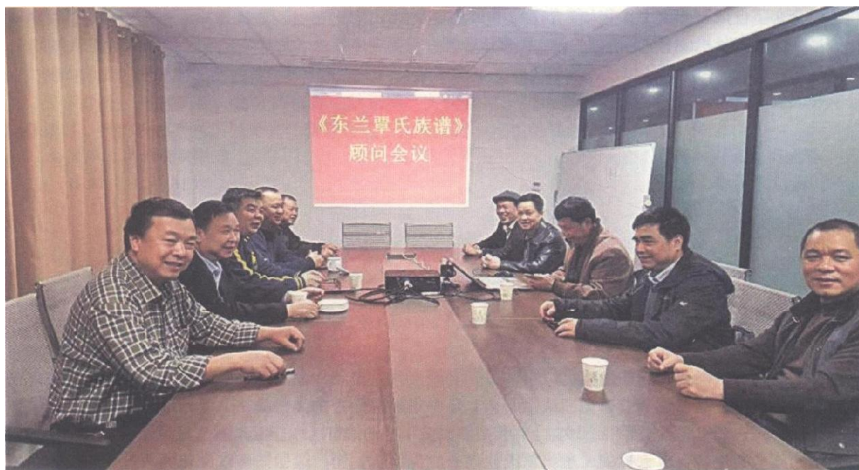
2019年3月20日在南宁召开顾问会议