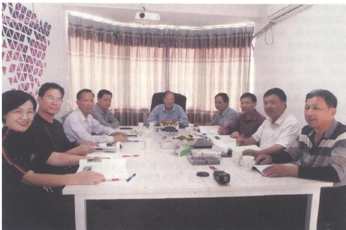
2019年10月19日，《东兰覃氏族谱》编委会主要成员在广西日报社集中会校审样稿。