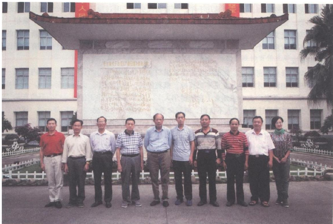
2019年10月20日，《东兰覃氏族谱》编委会主要成员集中在广西日报社会校审样稿。所有人在毛主席给《广西日报》指示信纪念碑前合影，庄重承诺以严谨、认真的工作态度和使命担当传承怀满精神、贯彻领袖指示。