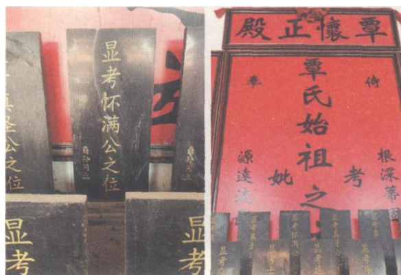
宾阳于100多年前建就覃怀大殿，将始祖覃怀满公的牌位刻竖大殿高堂中心。

谭三耀奉命驻守宾州。屯兵数年，官兵无所事事。谭三耀尽管战功卓著，但朱元璋对他的“天下兵马大元帅”名号耿耿于怀，不予重用，深感再留军中无益。值夜巡