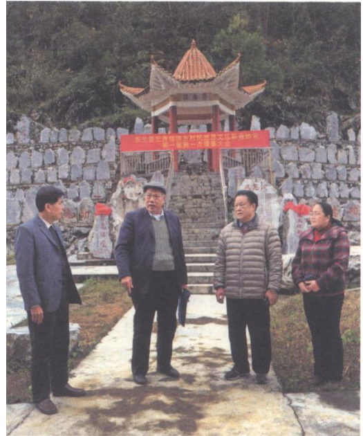
2015年11月26日，自治区人大常委会原副主任覃日飞（右二）到感恩文化园视察。

不知道感恩的人不是一个高尚的人；不知道感恩的民族不是一个文明的民族；感恩是一种感情，更是一种美德的传承。感恩是一种行为意识，更是一种文化，感恩文化是中华民族传统文化的重要组成部分。