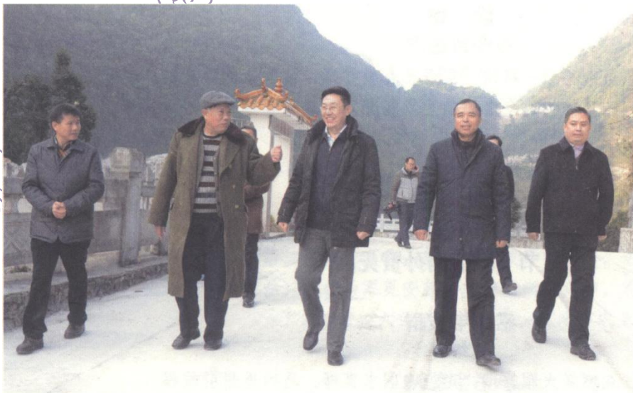
▲河池市人大常委会主任、市委书记何辛幸（右三），市长唐云舒（右二）在东兰县委书记、县长陪同下视察感恩园。

2016年2月6日，河池市委书记何辛幸、市长唐云舒，在河池市政协原主席覃绍明、东兰县委书记黄贤昌、县长徐迪克等领导的陪同下，兴趣勃勃视察感恩文化园，深有感触地说：“覃老主席退休后发动一家人，五年艰辛，执着创建感恩园的感人理念，由衷敬佩，我们要充分发挥“感恩文化教育