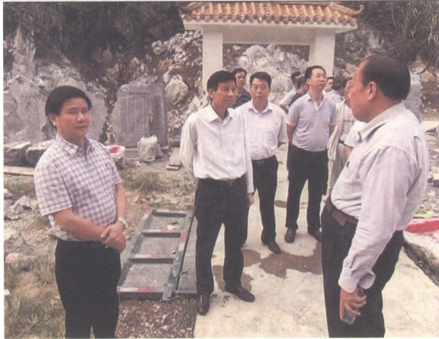
东兰县委书记黄贤昌（左一）和时任自治区高级人民法院党组书记、院长罗殿龙（左二）视察感恩园情况。

2014年初冬，广西高级人民法院党组书记、院长罗殿龙视察隆奋村民感恩文化园时说：“覃氏一族，精诚团结，自愿募款，投工投劳，历经五载，用心血与汗水，建成了规模宏大的感恩文化园，很有意义，观后深受感动，深受教育。”并挥笔题写“吃水不忘挖井人，幸福不忘共产党”的书法。