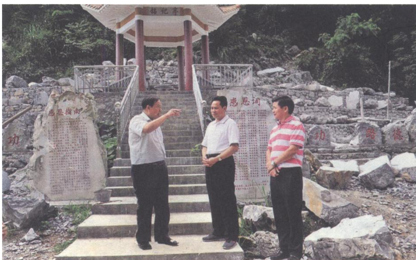
河池市委原书记，现任自治区党委常委、政法委书记黄世勇（中）视察感恩园施工情况

2014年7月8日，时任河池市委书记、市人大常委会主任，后任广西壮族自治区人民政府副主席、区党委常委、政法委书记黄世勇，两次视察感恩园时说：“之前我就听说绍明您老领导前些年从河池市政协主席岗位上退休以后，为进一步弘扬我们中华民族、壮乡人民憨厚朴实的感恩美德，回乡发动家族亲人，自行设计、自行筹资、自行投劳建设一个感恩文化园，并且已经远近闻名，我今天到