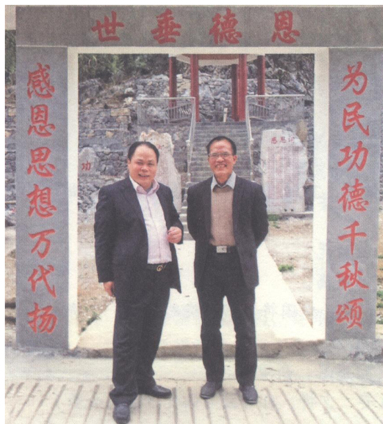
曾任东兰县县长、崇左市委书记、广西壮族自治区高级人民法院院长黄克（左）视察感恩文化园。

2014年春，时任崇左市委书记、市人大常委会主任，后任广西高级人民法院院长、党组书记——黄克，视察感恩园时说：“你们覃氏家族，真是了不起，敢做出一般人不敢想，不敢做的大事！这种就是敢为人先的拔群精神。拔群靠这种精神，把东兰办成全国有名的老区。你们一家人，自行设计，自行出资、自行施丁，建成村民感恩文化园，这也体现拔群的创新精神，成为全国首创。使东兰又增加了一张全国靓丽的名片。覃氏建园及时，立意高远，富有创意，意义非凡。”