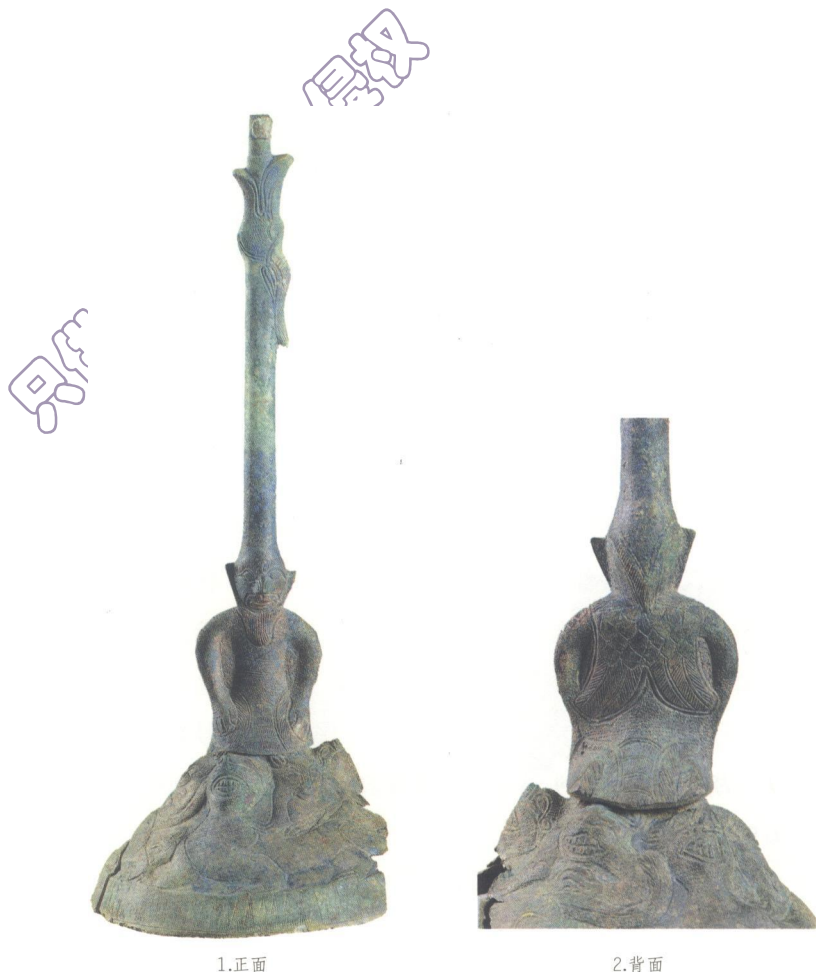
图 7-8 九只岭 M6A 出土的羽人铜座灯

羽人是汉代艺术中常见的形象。汉代羽人与先秦羽人不同，前者大都长着两只高出头顶的大耳，造型大致可见四类：第一类，人首人身，肩背出翼，腿部生羽；第二类，人首鸟身，鸟爪；第三类，鸟（禽）首人身，人身生羽翼；第四类，人首兽身，身生羽翼。这四类羽人当中，以第一类出现的频率最高，其他三类皆不多见。在汉代羽人常出现的图像组合中，或翱翔于云天，与天帝、雷公、雨师、风伯、电母等天庭诸神济济一堂；或出没于仙庭，与捣药玉兔、蟾蜍、九尾狐、三足鸟等灵瑞禽兽一同陪侍在西王母或东王公周围；或嬉戏于祥禽瑞兽中，与龙、虎、鹿、朱雀、凤凰、熊黑等祥瑞戏舞。它们很可能是在演示既能强身健体，又能帮助众生延年益寿甚至不老不死的行气导引之法。 [5] 合浦出土的羽人铜座灯上的羽人，大体未脱离学者归纳的汉代羽人范畴，前述铜钹上的羽人属少见的第四类，而这件铜座灯上的羽人虽属常见的第一类，但也有明显的区别：一是双翼紧贴背后，与其他地区发现的双翼飘出的类型不同；二是双耳没有高于头顶；三是双手似持有乐器。