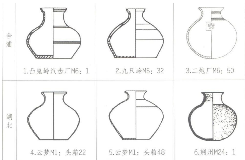
图 7-3 合浦与湖北汉墓出土陶罐对比图

此外，以长沙为中心的“南楚”是楚国玻璃制造的中心地带。合浦发现的璧与长沙地区西汉早期墓所出土的璧形制、大小、纹饰均较相似，剑璜也多见于长沙楚墓，经检测分析同为铅钡玻璃，判断为楚地传入。