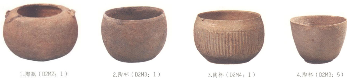
图7-2 双坟墩2号墩出土的江浙越式陶器

2号墩出土的陶甗、陶杯（图7-2）在江浙土墩墓中均可找到原型。墓主应为江浙越人或其后裔，因战乱或其他因素南迁至广西，而其迁移岭南的路线最大可能是经由浙南、福建沿海进入广东、广西。这条南迁路线被越来越多的考古发现和研究所证实。沿线的福建发现有土墩墓遗存，而广东和广西桂平近年来也发现疑似土墩墓的墓穴。刘波将两广地区东周时期的青铜器分为长方釜斧钺群和椭圆釜斧钺群，并指出前者中部分青铜器的源头在长江下游的吴越地区，可能是越人南迁的一条线索；郑小炉以吴越和百越地区出土的特色器物“镇”为例，说明越国败于楚国后，使用“镇”的人群将其带到了广东西部地区，而非文化交流传入。郑小炉还进一步指出，春秋晚期以后，尤其是战国中期以后，吴越地区越人有向岭南迁徙的过程。其迁徙路线主要有两条：其一是陆路，穿过浙江、江西，进入赣南山区，翻五岭进入广东中部，进而扩展到其他地区；其二是经由浙南、福建沿海进入广东、广西，这条路线应为主要途径。