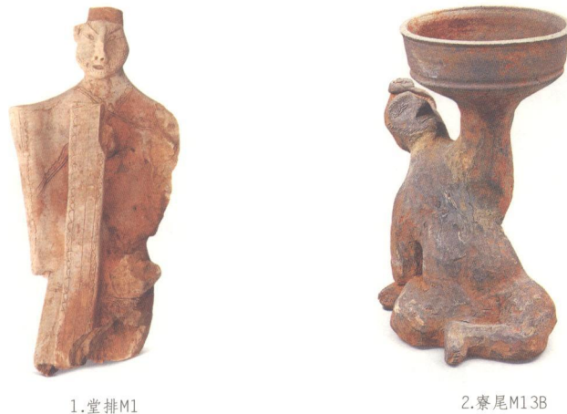
图 7-7 胡人俑

堂排1号墓(M1)和寮尾13B号墓(M13B)出土2件胡人俑(图7-7)。所谓胡人，即面部特征为深目高鼻、络腮胡须的异族人种，多来自当时北方、西域和南海地区。因而各地出土的汉代胡人俑，其容貌、服饰和帽饰也有所不同。