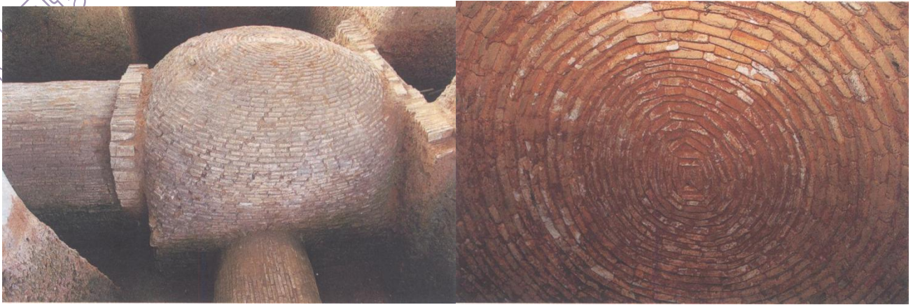
图 7-4 叠涩穹隆顶墓（四方岭 M36）

面合顶”的结砌手法不同，除广州、佛山、合浦（图 7-4）、贵港外，邻近的湖南、江西、福建等省未曾见过，其来源关系有待研究。除两广部分地区外，这类叠涩穹隆顶墓在中国香港及越南等地区和国家亦有发现。