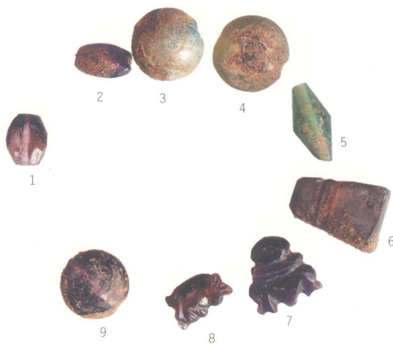
1、2、6、9.紫水晶串饰 3、5.玻璃串饰 4.玉髓 7.紫水晶三宝佩 8.石榴子石摩羯佩

在钵生莲花镜上，可见两人对着钵生莲花下跪作揖的形象，如此看来，钵生莲花器也是一件供奉神器。出土这类器物的砖室墓，为多室墓和穹隆顶墓，规模相对较大，推断墓主人的身份地位应较高，也从侧面说明了从东汉晚期起，佛教已在合浦地区特别是在中上阶层逐渐扎根。此外，出现在合浦风门岭10号墓(M10)的石榴子石摩羯佩和三宝佩也是有力的佐证（图7-6）。摩羯是印度神话中的动物，被认为是河水之精，是法力无边的海兽。摩羯纹饰常见于古代印度的雕塑、绘画艺术之中，在寺院建筑的塔门上尤为多见。现知最早的摩羯纹饰大约出现于公元前3世纪中叶，直到12世纪，摩羯纹饰在印度一直流行，其传入中国的路线，之前被认为是循西边陆路。但摩羯纹饰在陆路出现的时间偏晚，较早出现在陕西三原县双盛村隋代李和墓的椁盖上，之后流行于唐代金银器中。象征佛、法、僧的三宝佩以及作为法器的铜钹等文物，也应与佛教有关。