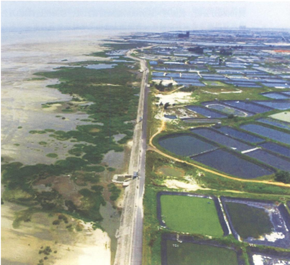
图 5-7 无人机航拍的广西北海市的滨海盐沼湿地

根据 2009~2012 年进行的第二次全国湿地资源调查结果，广西北部湾滨海盐沼湿地面积为 431.35 公顷（统计中仅包括不小于 8 公顷的湿地面积）。鉴于广西北部湾滨海盐沼湿地与红树林常形成交错带且斑块较小，第二次全国湿地资源调查的统计结果要比实际分布面积小。据何斌源等的调查，广西北部湾滨海盐沼湿地的面积应在 1000 公顷以上，且随着外来入侵种互花米草的持续扩散以及海三棱藤草的发现，广西北部湾滨海盐沼湿地面积仍在持续增大（图 5-7）。