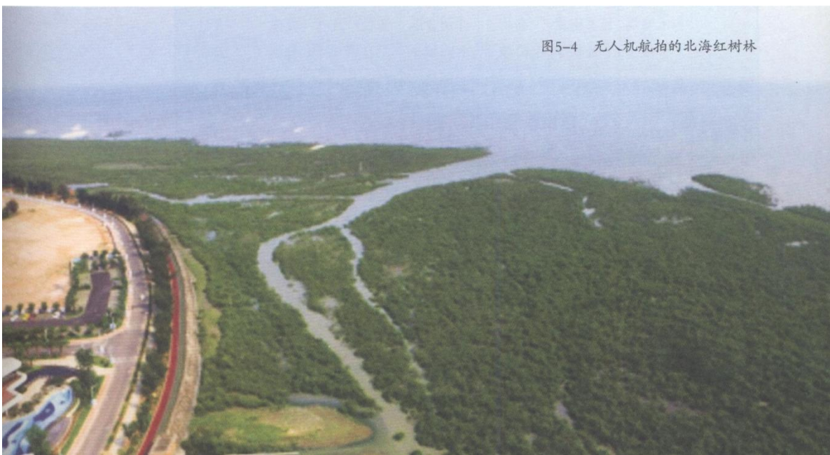
图5-4 无人机航拍的北海红树林