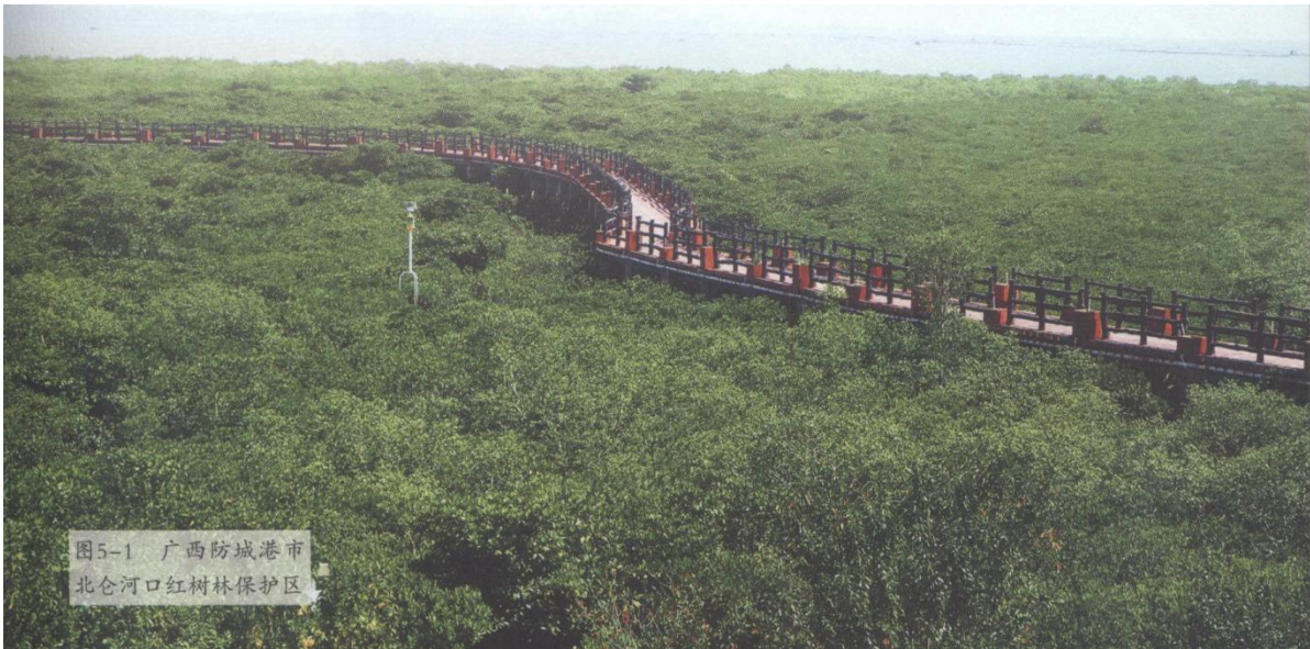
图5-1 广西防城港市北仑河口红树林保护区

红树林是生长在热带、亚热带低能海岸潮间带上部，受周期性潮水浸淹，以红树植物为主体的常绿灌木或乔木组成的潮滩湿地木本生物群落。它是能够同时适应海洋和陆地环境的特殊植物种类，是陆地向海洋过渡的特殊生态系统，也是至今世界上少数几个物种最多样化的生态系统之一，生物资源非常丰富（图 5-1）。其最突出的特征是根系发达（图 5-2），能在海水中生长。它具有呼吸根或支柱根，种子可以在树上的果实中萌芽长成小苗，然后脱离母株，坠落于淤泥中发育生长，是一种稀有的木本胎生植物。红树林中生长的木本植物叫红树植物，其他草本植物或藤本植物称为红树林伴生植物。红树林里的常绿乔木和灌木林非常茂密，涨潮时，树干全被海水淹没，树冠在水面上荡漾；退潮后，棵棵树木又挺立在海滩上，形成了海滩上的奇特景观。