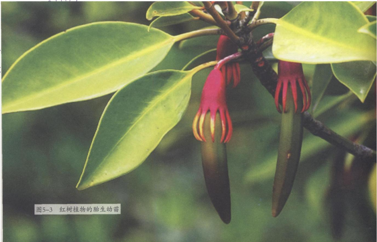
图5-3 红树植物的胎生幼苗