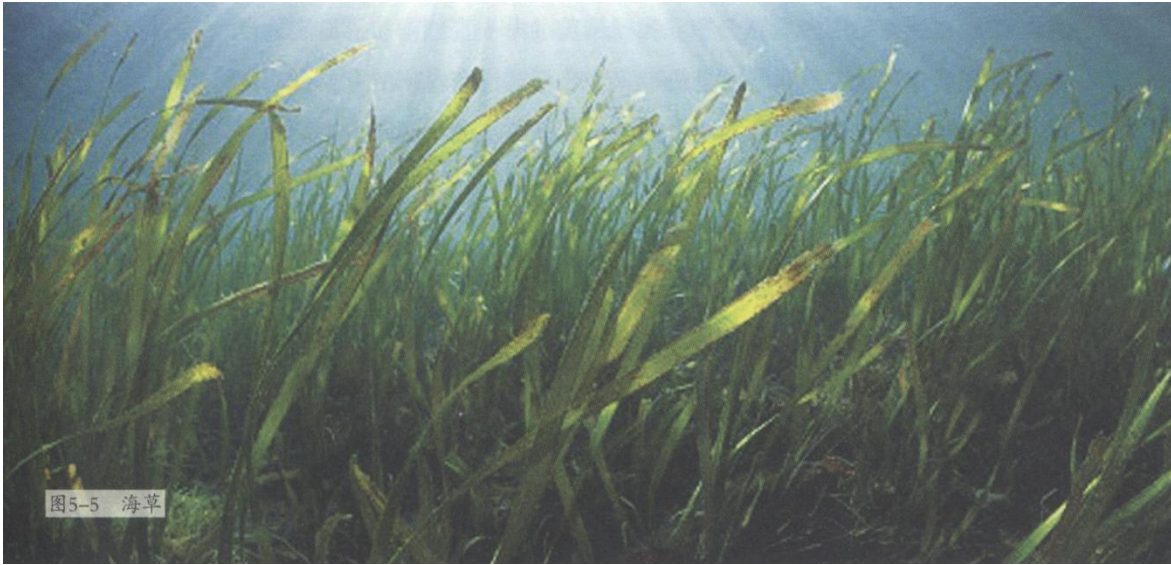
图 5-5 海草

海草是生长于河口和浅岸水域的单子叶植物，是完全可以海水中的被子植物，是由陆地植物演化为适应海洋环境的高等植物，在植物进化史上拥有非常重要的地位（图 5-5）。海草种类丰富，生物多样性高，大面积的连片海草被称为海草床，是许多大型海洋生物甚至哺乳动物赖以生存的栖息地。海草床是典型的海洋生态系统之一，是地球生物圈中最富有生产力、服务功能价值最高的生态系统之一，在生态上具有重要意义。