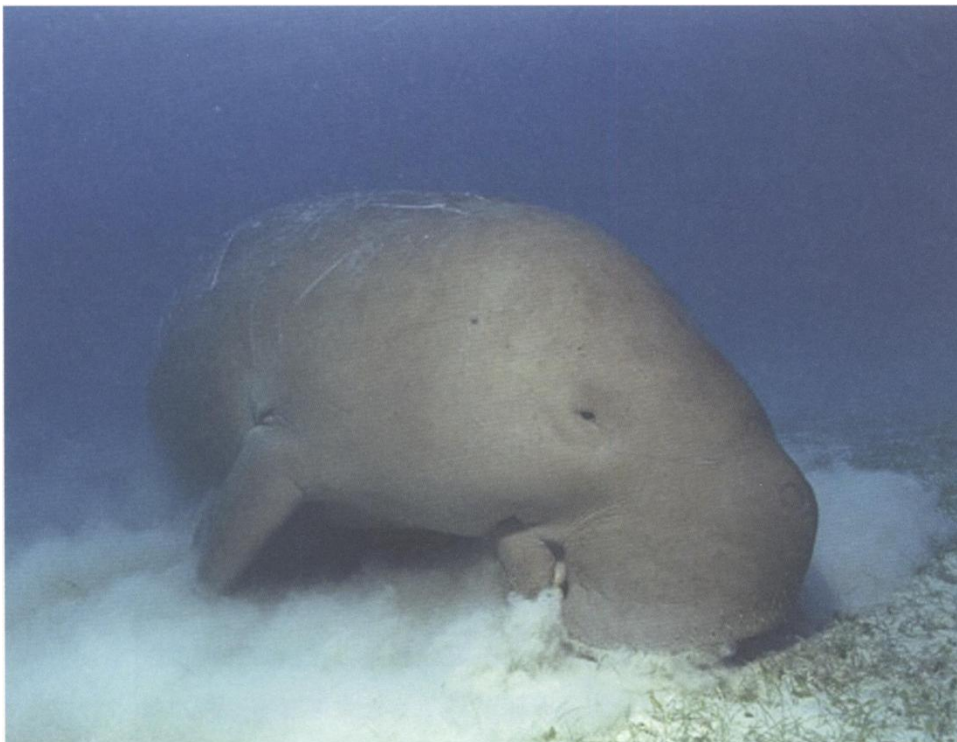
图 5-6 儒艮

合浦海草床与山口红树林国家自然保护区相邻，海草床主要分布在红树林向外海延伸的地段。合浦海草床的喜盐草是世界级珍稀保护动物儒艮的重要食物，该海草床的大部分已经划为国家级儒艮自然保护区。除了儒艮 (图 5-6)，该海草床还分布有 5 种对虾 (长毛对虾、日本对虾、布氏对虾、刀额新对虾和边缘新对虾)、2 种篮子鱼 (黄斑篮子鱼和褐篮子鱼)、3 种海胆 (薄饼干海胆、葛氏刻肋海胆和扁平蛛网海胆)、4 种海参 (马什海参、瘤五角瓜参、糙海参和蛇锚参)、2 种海星 (鹿儿岛槭海星和单棘槭海星)。