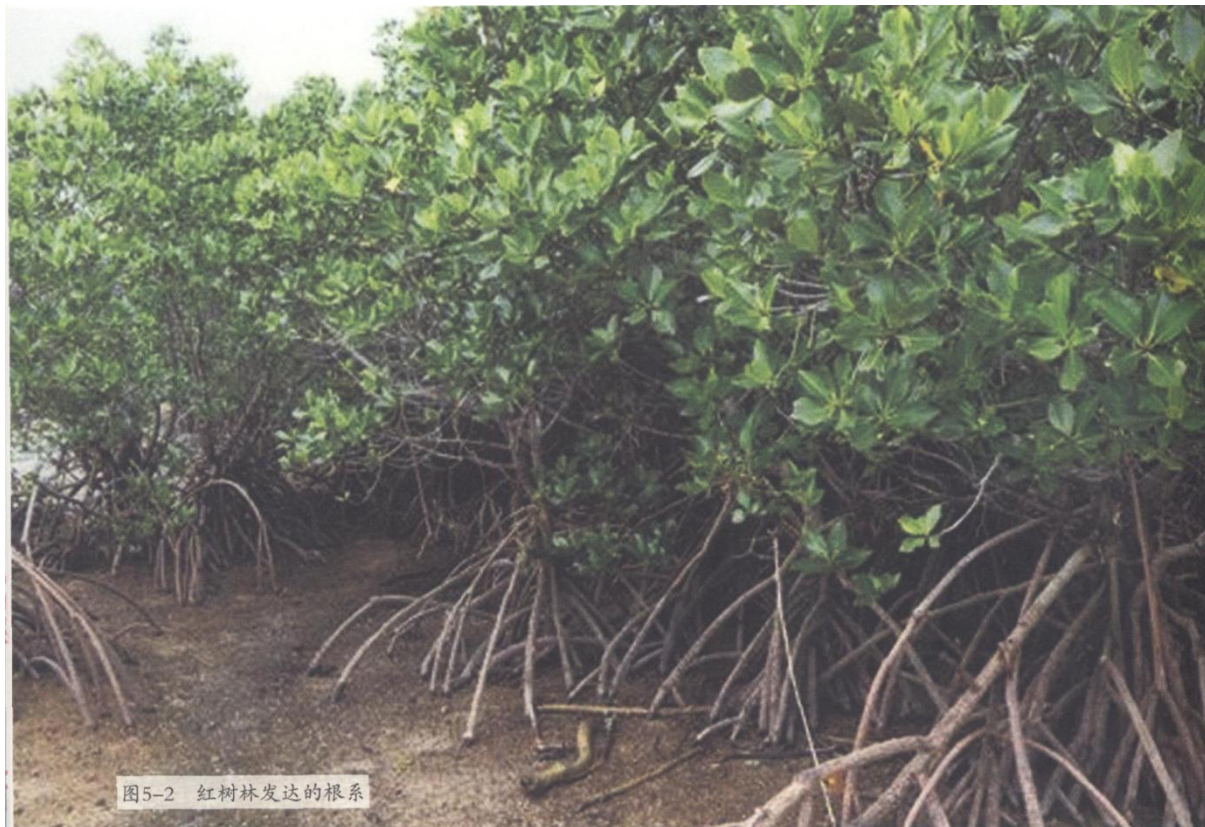
图5-2 红树林发达的根系

胚轴明显伸长，逐渐突破果皮，形成如同长长的“水笔”的胎生苗，此为显胎生（图5-3）。红树林中进行显胎生繁殖的植物主要集中在红树科，其中红树属的红树、红海榄，木榄属的木榄、海莲、尖瓣海莲，角果木属的角果木，秋茄属的秋茄，都在果实外长有长长的胎生苗，形成“树挂幼苗”的奇观。隐胎生植物的胚轴并不伸出果皮，萌发的种子被果皮包裹着，从果实外面看不出来，果实落地后胚轴才伸出果皮。马鞭草科的白骨壤、紫金牛科的桐花树和爵床科的老鼠簕等植物就属于这一类。剥开隐胎生植物的果皮，能看到里面已经萌发的种子。