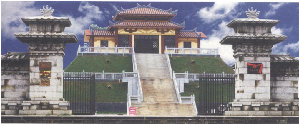
图 6-1 北海合浦汉代文化博物馆

广西北海合浦汉代文化博物馆（图 6-1）馆藏有为数不少的合浦汉代出土文物，包括陶器、金银器、玉器、水晶、玛瑙、玻璃器、瓷器等共计 936 件（套），其中水晶 21 件、玛瑙 29 件、琥珀 13 件、玻璃 41 件、金属器 352 件、玉器 12 件、陶器 362 件、其他杂项 106 件。这些文物直接或间接地反映了当时海上丝绸之路的繁华景象。如合浦出土的不少汉代玻璃器，经检测，其中有钾硅玻璃，也有我国中原地区产的铅钡玻璃，还有一些产于西方的钠钙玻璃。国外博物馆展出的玻璃器，无论从器型还是从成分来看，都与合浦汉墓出土的玻璃器有所不同。鉴于在合浦的平民墓中也出土了一些十分珍贵的玻璃器，因此有些专家认为，通过海上丝绸之路，大量舶来品传入的同时，先进的生产技术也相应地传入我国，能工巧匠们最终学会了运用本地的原材料制作玻璃器。