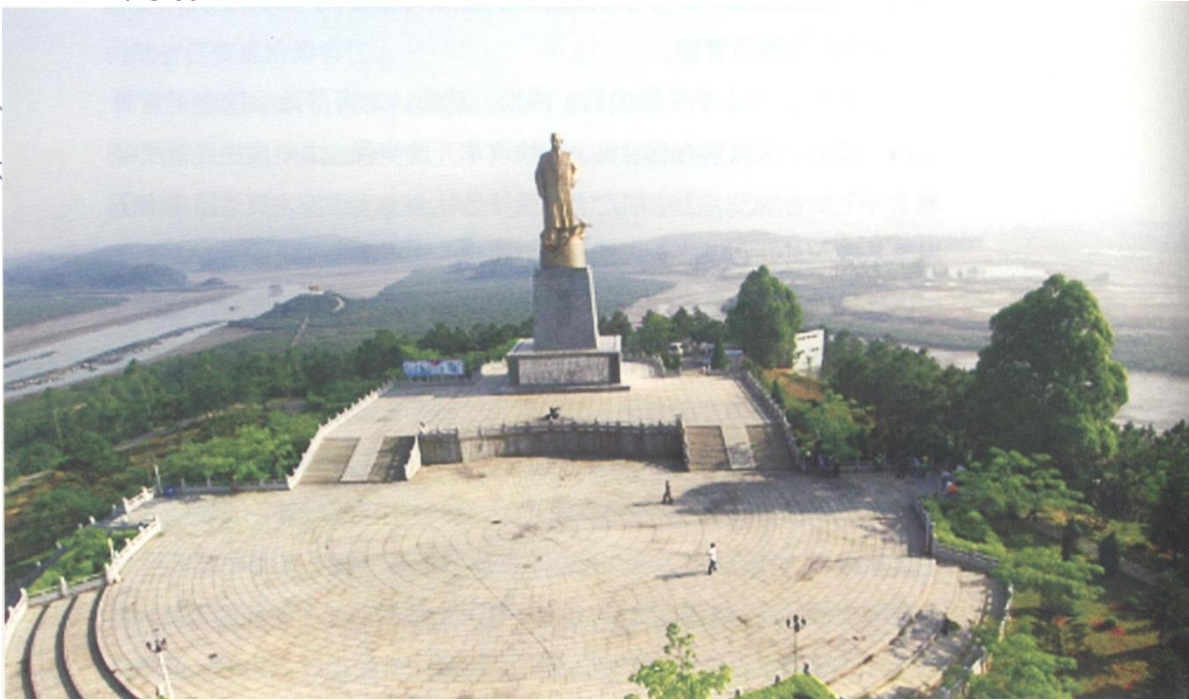
图6-2 钦州港逸仙公园的孙中山铜像

米，是1996年钦州人民为了纪念孙中山先生规划建设“南方第二大港”——钦州港而建造的，以此来永远铭记孙中山先生的丰功伟绩（图6-2）。