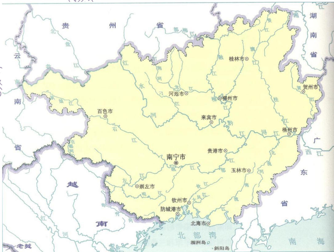
图 2-1 广西主要河流分布示意图