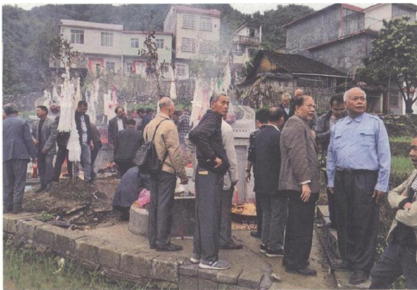
2019 年 3 月中下旬至 4 月中旬前后，有东兰或市内外 10 多个县区的一波波上到耄耋，下至孩童的覃氏宗贤，深怀认祖祭祖之炽情，或徒步或驱车，络绎不绝云集大同乡和龙村累吴屯始祖怀满公奶墓前，虔诚祭拜，祈祷平安，图为上林、马山、武鸣宗亲祭祀摄影。

3 月 23-24 日，中华覃氏宗堂理事会，委派九位特派员（详见名单），驱车前来累吴屯，在怀满公、奶墓前，烧香敬拜，其真挚情感，令东兰广大覃氏宗贤，感叹不已，并撰动感心弦的赞颂诗文，载入族谱。