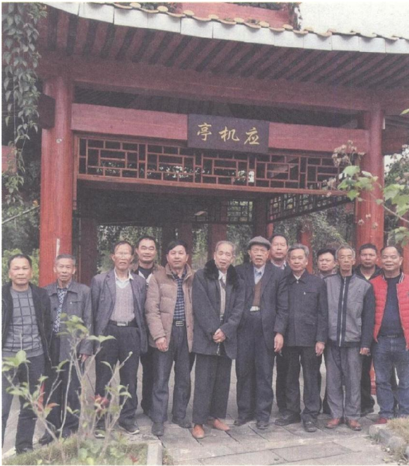
怀满后裔参观应机亭

转战千里，血战疆场，为创建东兰革命根据地，为中国人民解放和建设事业立下不可磨灭的历史功勋。新中国成立后，积极配合韦国清主政广西三十年，业绩卓著。他既是广西人民的楷模，也是怀满公百万后裔的楷模，享有崇高的威望，而世代仰止。”