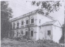
原北海教区圣德修院