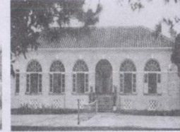
原北海洋员俱乐部