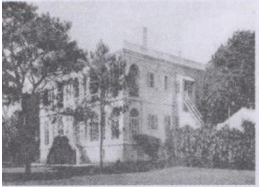
原北海税务司公馆