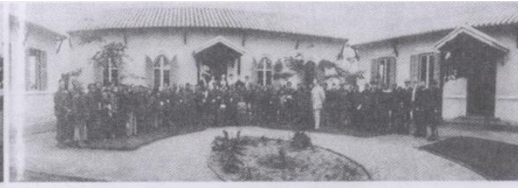
原北海普仁麻风院