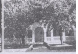
原安立间教会纪念楼