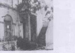
原北海洋务局大楼