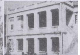
原五旬节圣洁会牧师楼