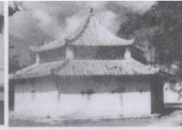
原北海麻风院澡房