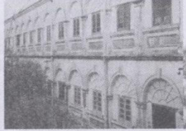
原北海关外班洋员大楼