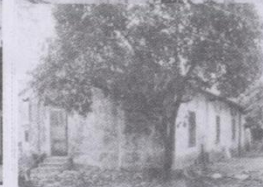
原五旬节圣洁会教堂