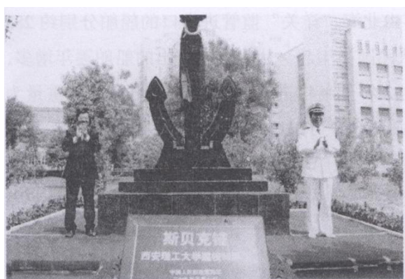
西安理工大学国防教育学院的标志物——斯贝克锚及其说明碑。锚已成为人类在海洋活动的标志。

通过对这些铁锚的发现和追溯，从中可了解到很多与火船埠有关的历史和知识，比如说地角北面海域为什么被称为“火船埠”。所谓“埠”，古称埠头，为停船的“码头”，是停泊船只的地方。然而，这个“地方”是有特定要求的，即此海底要较为粗糙，让下沉船锚的锚爪能钩住海底，使停航的轮船不因海水的流动而漂走。锚爪钩不住海底被称为“走锚”，如果这种情况一旦出现对船只是很危险的，因此有了“锚地”这个概念，即较粗糙的海底，为船舶寄碇之所。地角北面海域具有作为锚地的条件，故近现代到北海的中外船舶大都停泊在此锚地。地角火船埠成了北海早期有名的埠头之一。