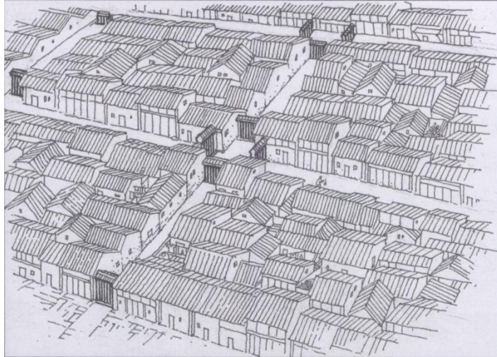
昔日北海老城用闸门护卫一段街区的概貌。