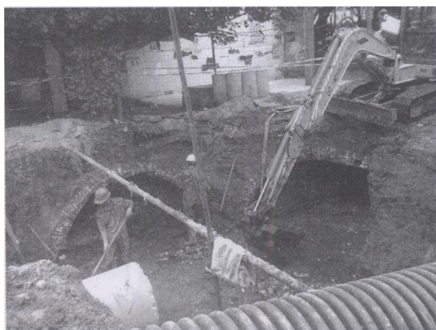
图一 2013年11月上旬为修筑下水道而露出的中山桥遗址，一挖掘机停在一桥拱上面。

2013年10月25日下午，一位友人告知笔者，中山西路末端的中山桥遗址，因修筑下水道而露出了埋在地下砖砌的桥拱，问笔者是否有兴趣去看看，笔者连忙和友人一起前往。在工地（见图一），友人拍了好几张照片，问道：“中山桥遗址的发现是否有历史价值？”经友人这一问，笔者决定把老街的这一遗迹的发现，作一小小的课题来研究，相信是一件很有意义的事。