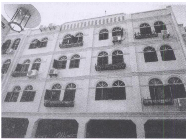
珠海西路数间原贴瓷片的立面经整治后的亮丽风貌。

一位网友提了这样一个问题：“改了之后还是传说中的老街吗？”笔者认为，只要依照“不改变文物原状”的原则去“改”，它还是传说中的老街。例如上文介绍过天安门城楼的大修缮，则是“不改变文物原状”的经典样板，有人称之为“修旧如新”。笔者认为，像珠海路这样一条很有历史价值的老街，应重现其昔日初建成时的亮丽风貌——一条长1.5公里，具有欧陆风情的建筑群。此建筑群在20世纪20年代我国南方沿海的城市中是少有的。前人给我们留下这珍贵的近代建筑遗产，如果作为后辈的我们没有很好地维护而变成“不伦不类”的“危旧建筑群”，那么我们就对不起前人了。