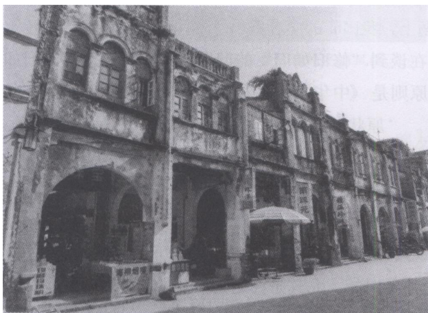
图一 珠海西路一排老得很有“味道”的立面。

网友喜欢的老街的“味道”是什么？这是需要追溯一下的。老街于1927年前后拓建成欧陆风情的骑楼商业大街。笔者偶遇一位90余岁的老人，他说年轻时因参加革命从外地来到北海。那时的中山路和珠海路建好约有十来年，是两条非常漂亮的街道，这让他至今记忆犹新。老街从1950年至21世纪初的半个世纪中，因各种原因，老街的建筑群只使用不维护，因而留下的沧桑痕迹随处可见，这些旧屋建筑群被一些网友认为就是老街的“味道”（见图一）。