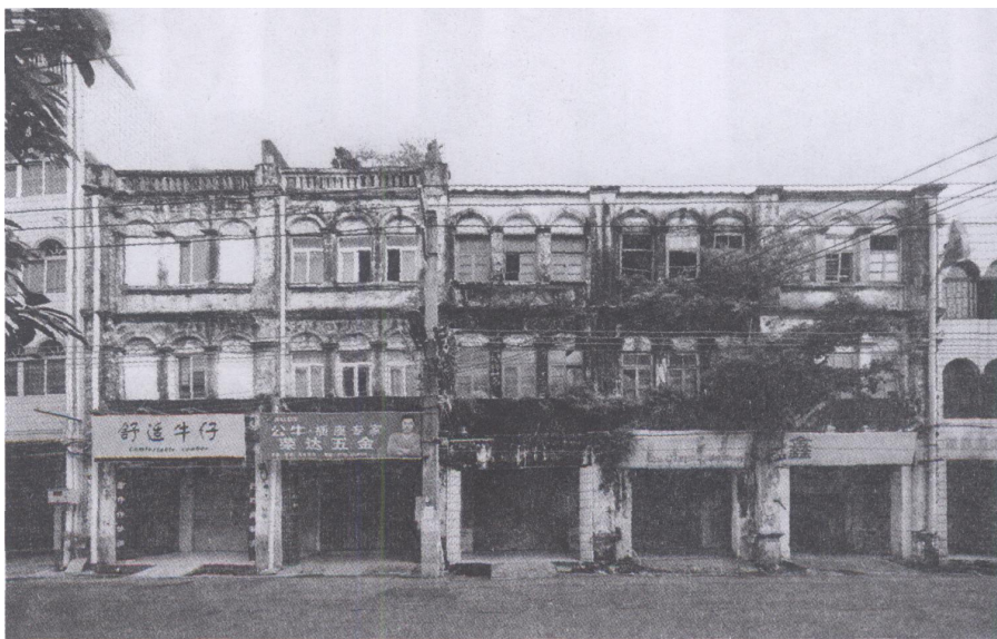
图二 中山东路数间三层楼房，为保存较好的早期建筑。

在随后的二三十年间，由于珠海路的商业发展较快，对中山路商业的发展有很大影响，很多重要的建筑如北海商会、广东省银行北海支行、农民银行、珠光电力公司，以天海楼为代表的各式各样的酒楼、酒家，以及文体方面的靖海戏院、世界影画院及民众剧社、强北体育会、强新书局和绿波书社等建筑或商铺都建在中山路。这些建筑立面，大多为欧陆风情的骑楼建筑。今中山东路一连数间的三层楼房（见图二），虽经风雨侵蚀几十年，但其风情依然，为中山路立面保存较好的建筑之一。