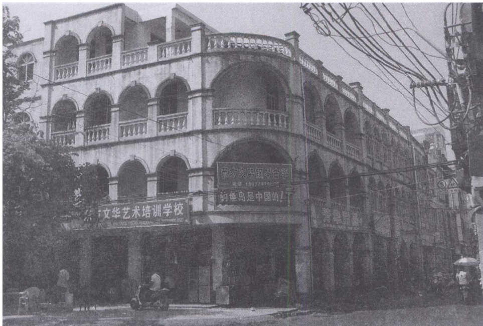
图三 中山西路数间经改造的建筑立面。

解放后，北海的商业中心从珠海路向中山路转移。二三十年时间，由于经济发展了，中山路不少房屋拆旧建新，或被改造。很多立面被贴上瓷片，加上中山路路面“坑坑洼洼”，新旧房屋高低悬殊，极大地破坏了老街原有的风貌和空间格局。立面边上的各种线路杂乱无章。商业虽繁荣，但建筑的立面很不雅观，中山路至今还有数十根方形钢筋水泥电灯柱，是广西最早有电灯的见证物，但中山路的路灯极为昏暗，由于上述各种原因，中山路虽然也是北海的历史文化街区，但外地游客很少到中山路参观。唯有于十多年前在中山西路东端路口拆旧建新的数间券廊式立面建筑（见图三），让老北海还能忆起中山路曾有过亮丽的风貌。