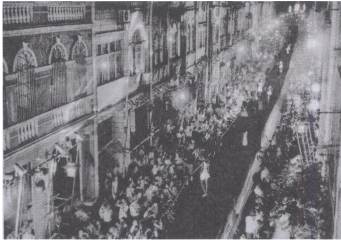
2009年，来自世界各国的模特在北海珠海路老街搭建的世界上最长的T台上表演。