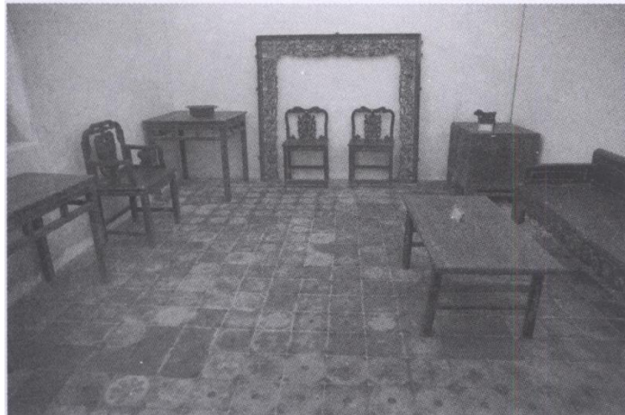
花楼一厅室内的摆设。