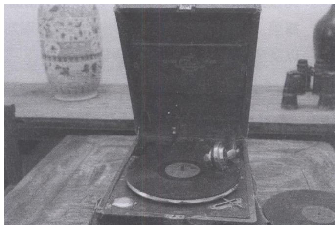
花楼一室内的老唱机和古董。