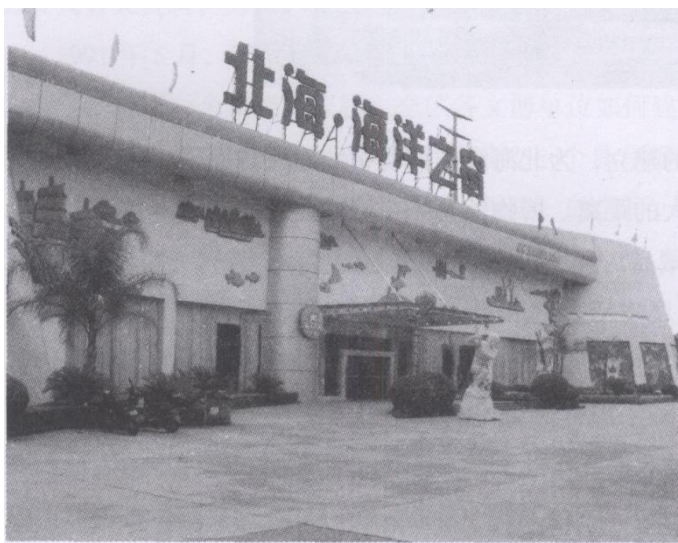
位于四川南路中段的“北海·海洋之窗”。

现在有一种叫“捆绑式”的博物馆, 如2006年5月国务院公布的第六批全国文物保护单位中, 把广西沿海地区的北海、防城港市等8处历史上建造的御敌入侵的炮台“捆绑”起来, 名为“连城要塞遗址”, 实际上是“连城要塞建筑博物馆”。北海的“国保”单位地角炮台也被“捆绑”在内。现在是实现建立北海市海洋历史博物馆这一“梦想”最好的时机, 只要市有关部门把既有私营, 也有公立的, 包括历史悠久, 具有南国蓬莱之称的涠洲火山岛这些几乎都是现成的文化资源进行整合, 然后把它们“捆绑”在一起, 列入建设文化北海的战略项目, 该项目一旦完成, 具有北海特色的海洋历史博物馆与合浦汉墓博物馆一起, 将成为北海历史文化名城最为亮丽的名片。