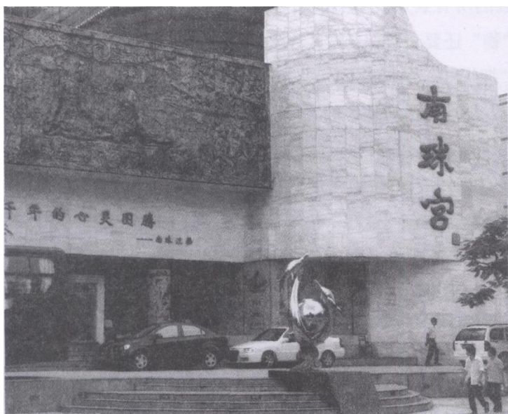
位于茶亭路海洋公园对面的北海“南珠宫”。

1984年北海被列为我国14个沿海开放城市之一。一些单位先后在北海市区建了与海洋文化有关的“海底世界”、“南珠宫”和“海洋之窗”三个场馆。先说“海底世界”，它是从20世纪70年代的北海水产馆（后改名水族馆）发展过来的。馆内有北海最早用亚克力玻璃建造的四面通透的水下表演池，可观赏海底鱼类的隧道和各种各样的海洋生物。亚马逊雨林、玛雅山冈、吴哥雨林、亚马逊科普区等一些经浓缩了的世界著名景点也尽收眼底；“南珠宫”始建于20世纪80年代末。该馆采用现代科技手段和艺术表现手法，展示南珠两千多年的发展史，把精彩的“珠还合浦”、“牛衣对泣”及“割股藏珠”的神话故事，向游人诉说。还计划把“南珠宫”扩建为“南珠博物馆”，馆中一颗重3.6克，产于合浦白龙珍珠池的南珠，为该馆的镇馆之宝。“海洋之窗”是21世纪创建的世界贝类珊瑚馆。后扩建，更名“海洋之窗”，它除了有供水下表演的大型亚克力玻璃圆缸外，还有丰富多彩的活体珊瑚。此外，该馆对中外海洋史如郑和下西洋、欧洲航海史，海上丝绸之路以及南珠文化等历史均用图、物作了生动的介绍。