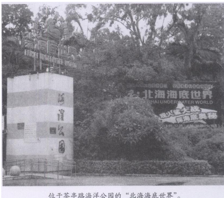
位于茶亭路海洋公园的“北海海底世界”。

我国自1984年正式加入世界博物馆协会后提出：凡有条件的县、地、市，除要建立图书馆和文化馆之外，还要建立博物馆。