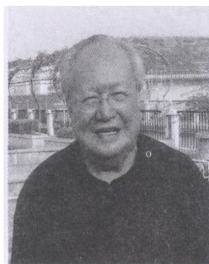
钱教授在北海艺术家村与画家们合影截图。

转眼间过了十多年。2006年的一天，笔者和老朋友袁先生到珠海路一古董店和潘老板聊天，当聊到书法收藏时笔者说，十多年前笔者得到钱绍武的两张墨宝。潘老板颇感惊奇地问，是真的吗？钱绍武不但是我国著名的雕塑家，而且也是一位大书法家，要想得到他的墨宝可不容易。笔者于是回家取出珍藏了十多年的墨宝给他看。潘老板