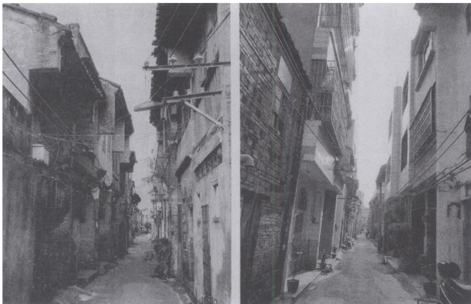
图一 左图为沙脊街旧立面的马头墙建筑；右图为拆旧建新的立面。

近二三十年间，沙脊街也和珠海路、中山路一样，经济有所好转的户主都另建房屋或买房居住。现居住在沙脊街的大多数为老人或外来人。不少房屋已残破不堪，甚至已成废墟。昔日的广州会馆于20世纪80年代被拆除建校舍。有北海第一酒楼之称的