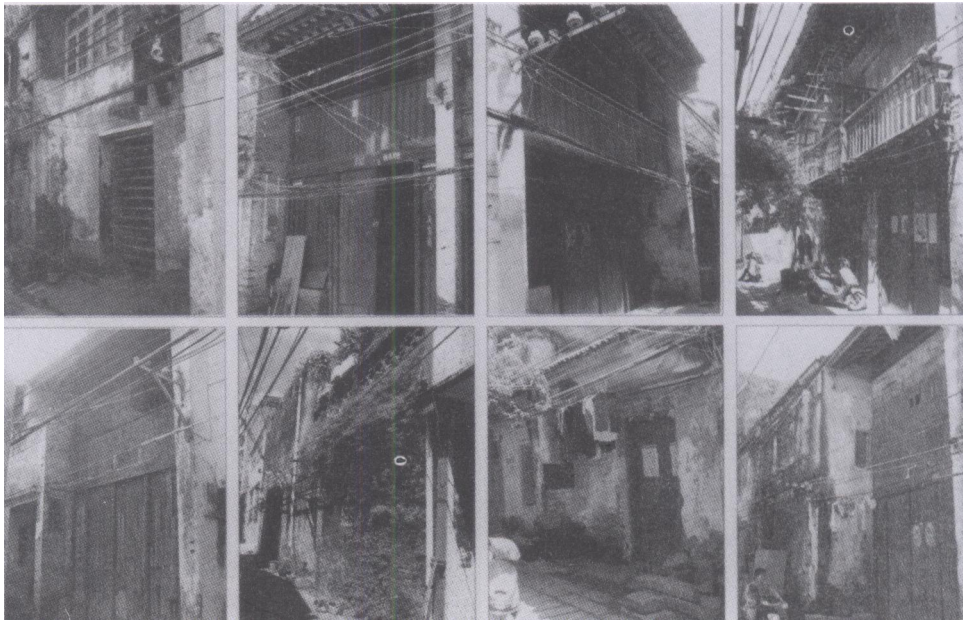
图二 沙脊街早期的八间木板装立面。

首先要修复石条路。此街各路段至今还保留一些马头墙（见图一左图）和砖木结构较完整的立面（见图二）。此外，在沙脊街东端有两间已成为废墟的旧屋，可采用西方保护体系的形式保护。此两屋已很久没人居住，屋顶被台风掀开了一个天窗，墙体破裂。立面下层的木门、木板壁早已坏烂，被人用红砖封堵；立面上层的木板壁上，还保留“文革”期间留下的标语，为重要历史事件的痕迹（见图三）。由于两屋已成危房，须及早采取一些保护措施，从里到外保留“原汁原味”的现状。