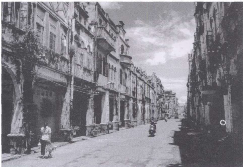
集中成片且有完整格局和传统风貌的珠海路骑楼老街。

北海的老城区很小，至解放前夕，其面积约0.8平方公里。城区南面为西洋建筑，北面为商业老街。这些东西方的建筑互为毗邻。数十年前，这些近代建筑群几乎没有引起人们的注意。1984年北海成为全国首批14个沿海开放城市之一后，这些建筑才逐渐引起一些有识之士的重视。就笔者所知，北海在开放之初有一位从北京来的专家任市规划局局长，听说他工作期满回京前，曾这样嘱咐：北海今后要注意外国领事馆等西洋建筑的保护。后来一位来自北京某建筑学院的教授带学生来北海考察，看到珠海