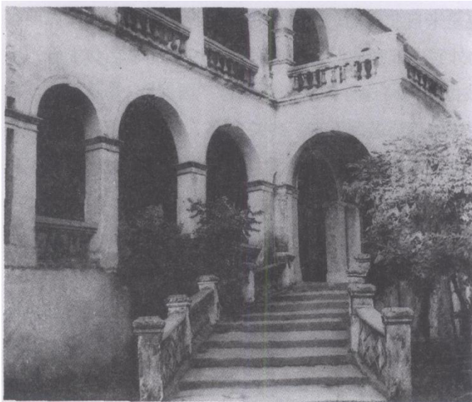
北海有数十座近现代西洋建筑。图为建于1905年的德国领事馆（旧址正侧面截图）。

效的工作，总结了北海历史文化遗产的价值和特色，写了一个很有详实系统的资料，它既是申报名城的文本，又是今后宣传的依据，这深刻地体现了市委、市政府对历史文化资源保护的重视。申报材料丰富翔实，自我评价客观，综合现场考察，一致认为北海市符合国家历史文化名城的条件。