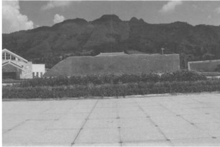
广西东兰壮乡英雄文化园