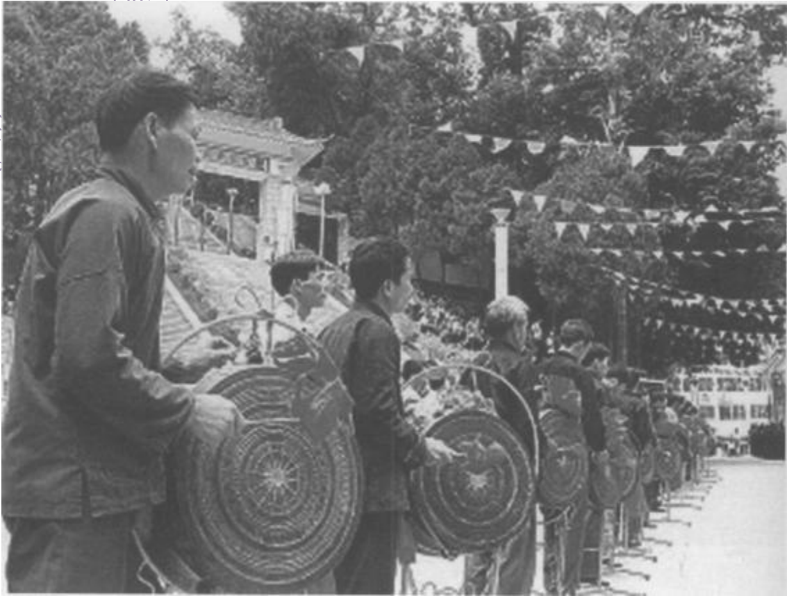
百面铜鼓喜迎壮乡将军纪念馆开馆

根据广西新四军历史研究会编写的《开国上将韦国清》（内部文稿）搜集，自1942年12月12日起，直到1989年6月14日韦国清与世长辞，他共留下了23篇文稿，有的已经公开发表，有的尚未发表（不包括他主政广西20年的一些讲话以及在广东、解放军总政治部和全国人大的一些讲话）。其中有代表性的是：《发扬政治工作实事求是的优良传统——纪念伟大导师毛主席诞辰85周年》、《英范永存——纪念共产主义战士韦拔群牺牲50周年》、《目前地方武装工作的几个基本问题》、《华东形势与苏北兵团任务》、《九旅部队的优良传统和作风》、《千里驰骋鏖战多——忆淮海战役中的苏北兵团》、《怀念彭雪枫同志》、《纪念百色起义》、《怀念张云逸同志》等。这些文章，充满着哲理和辩证思维，闪耀着韦国清哲学思想的火花。