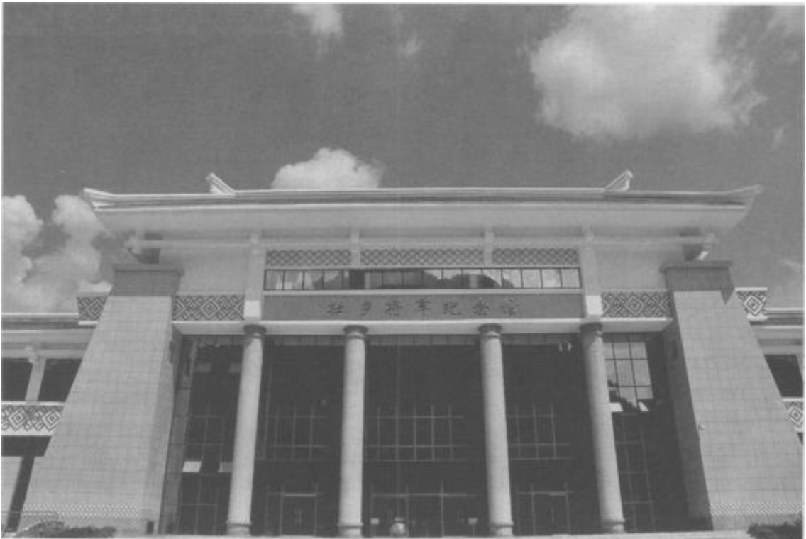
矗立在广西东兰的壮乡将军纪念馆