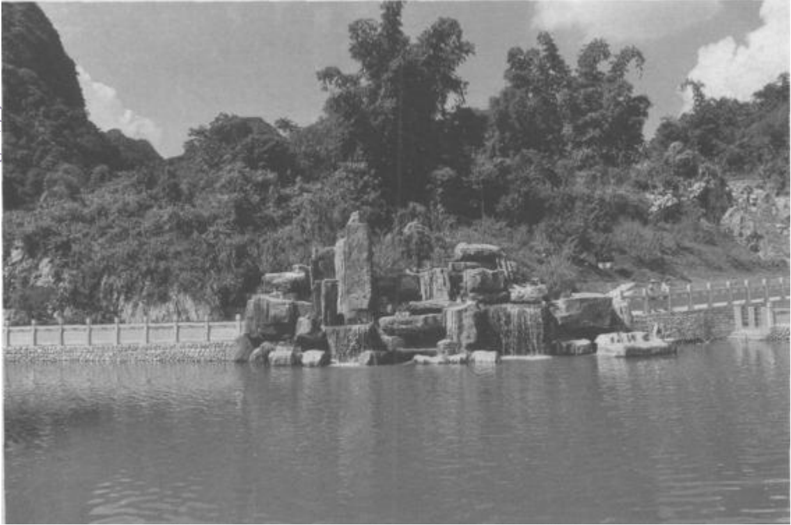
广西东兰将军园中的清风池