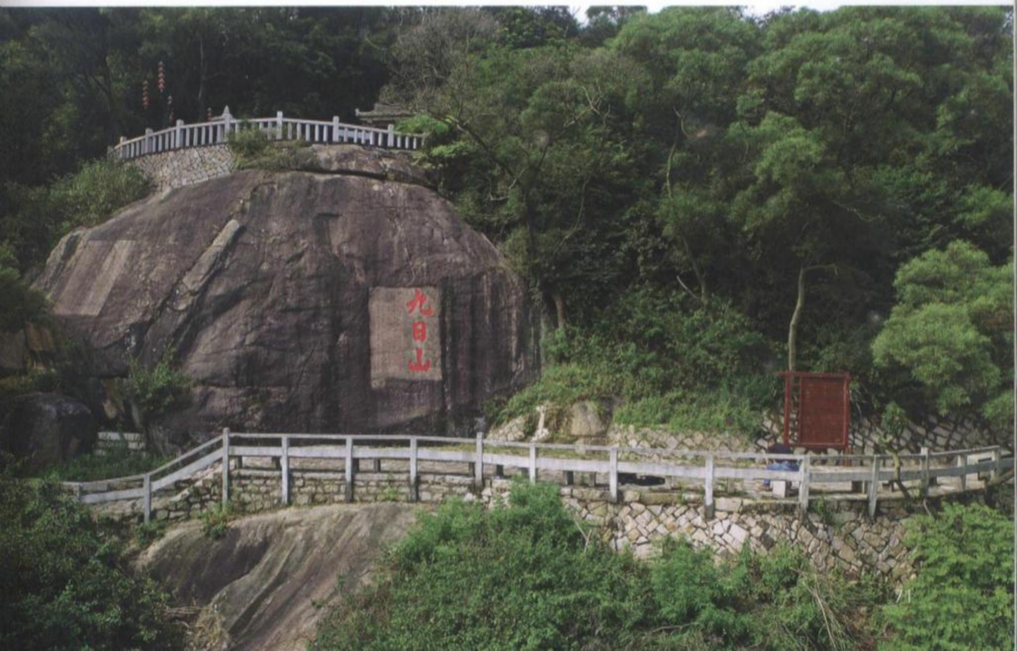
九日山的祈风石刻

磁灶窑系金交椅山窑址位于晋江市磁灶镇钱坡村，该窑场创建于唐末五代（10世纪），衰废于元末（14世纪中叶），是磁灶12处宋元窑址中保存较完好的一处。窑址范围约15000平方米。2002年至2003年经三次发掘，发现四条龙窑遗址（Y1—Y4）和一处作坊遗址（F1）。磁灶窑系在产品种类、釉色和装饰技法方面创新，主要是善于吸收名窑的先进工艺，兼容并结合自己的特点进行创新，而不是简单地照搬照抄。博采众长的技术创新使磁灶窑克服了当地无优质瓷土的弱势，不仅能生产出琳琅满目的各类陶瓷器，在装饰上求新求变，使产品能在强手如林的窑业竞争中独树一帜，并凭借其靠近泉州港的地利，将陶瓷器远销海外，为自己在陶瓷外销史上争得一席之地。