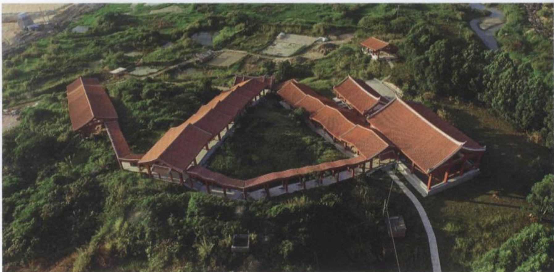
磁灶窑系金交椅山窑址

码头。文兴码头始建于宋代，呈南北走向，从江岸自上而下延伸至江面，为石构斜坡阶梯的驳岸码头，以错缝形式为主砌筑，现存部分长34米，宽3.5米。岸边现存宋代宝篋印经塔一座，塔身为花岗岩，现存两段，系分别雕凿后再行衔接。上段四面各有一尊半浮雕的半身佛像。下段四面分别阴刻一字，由右至左顺读为“佛”“法”“僧”“宝”。美山码头始建于宋代，临江处筑就石构墩台，以“一丁一顺”的方法交替叠砌，现存部分长约30米，宽约20米，墩台东西两侧各附有一条南北走向的石构斜坡式道路，向南延伸至江中。墩台的台基由下而上渐次内收，外侧壁面呈斜状，以供大船深水停泊。