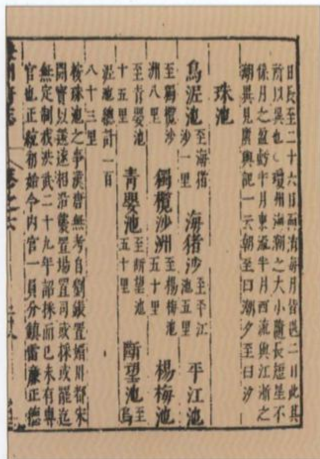
崇祯《廉州府志》珠池方位记载