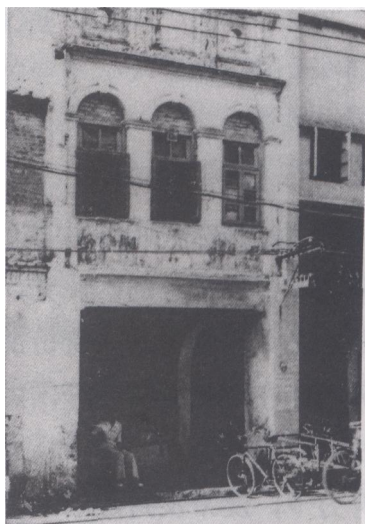
肖我照相馆（现北海市中山路 53 号）

中共北海地方组织的建立，是五四新文化运动以来，马克思主义在北海的传播和北海工农运动蓬勃发展的结果，它是北海有史以来的第一个无产阶级政党，给深受压迫和剥削的北海工农群众带来了光明和希望，北海工农群众在争取解放和自由的斗争中，有了明确的方向和可靠的领路人。