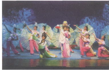
图3 大型神话粤剧《合浦珠还》片段剧照