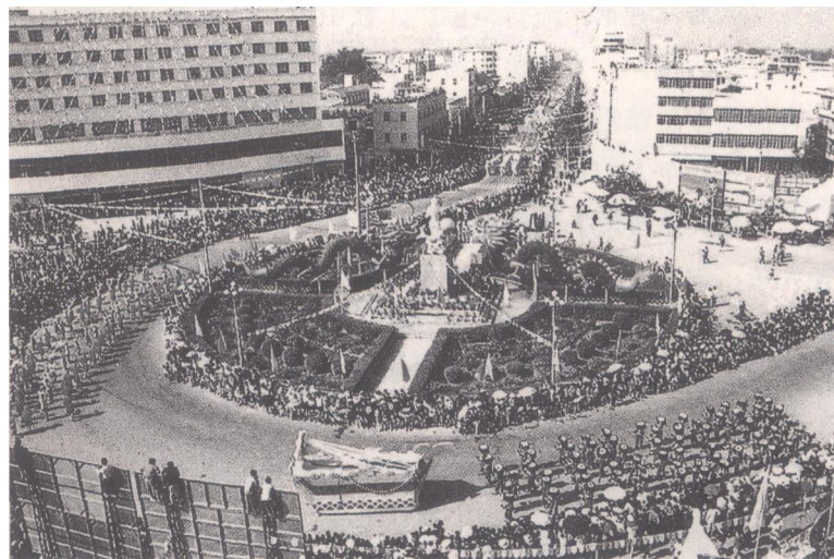
图5 合浦举办采珠节的情景