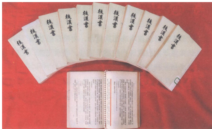
图1 《后汉书》关于“合浦珠还”的记载，展示其深厚底蕴及历史价值

“合浦珠还”反映了人民的心声，希望当官的都能像孟尝一样给老百姓办实事。人民呼唤清廉的官，爱惜老百姓的官，敢于为民请命的官，这对于以人为本，推崇珠蚌的崇高品格和无私奉献精神，加强廉政建设，构建和谐社会，具有相当重要的现实意义。