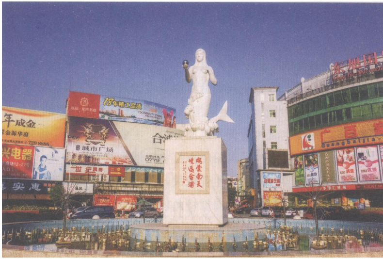
广西北海市合浦县广场中心的美人鱼雕塑

是一个充满海洋神话色彩的民间传说，也正是美人鱼传说在南珠之乡世代流传的魅力所在。