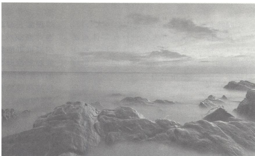
北海冠头岭海岸风光