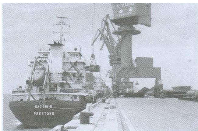
繁忙的铁山港码头

如今，这座千年汉郡正把认真学习宣传贯彻习近平总书记视察广西时重要讲话精神作为当前和今后一个时期首要政治任务，扬起“工业强县、旅游旺县、农业稳县、民生惠县”的风帆，扎实推动经济社会持续健康发展，扎实推进现代特色农业建设，扎实推进民生建设和脱贫攻坚，扎实推进生态环境保护建设，扎实建设坚强有力的领导班子，推动合浦各项事业发展迈上新台阶。