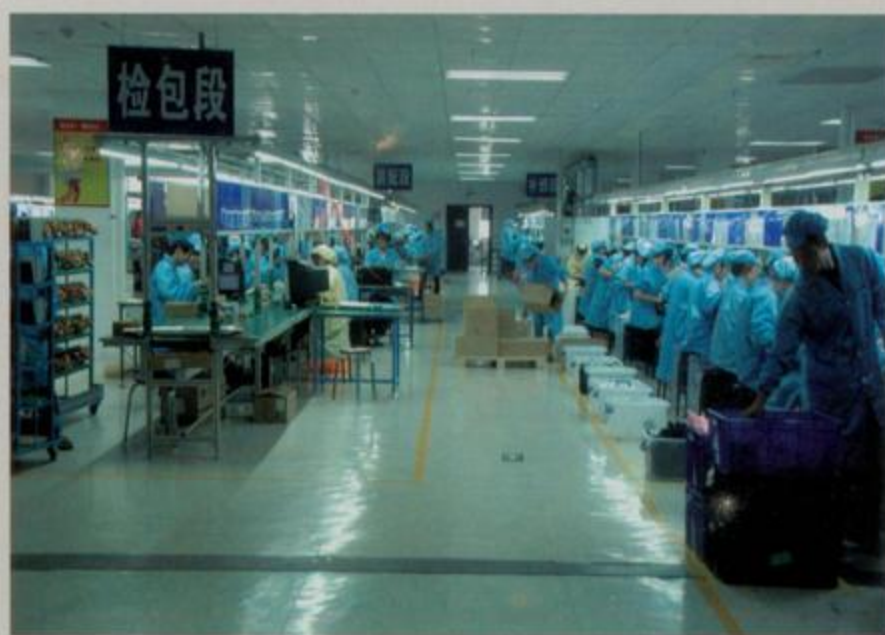
北海长城能源科技股份有限公司厂房一角