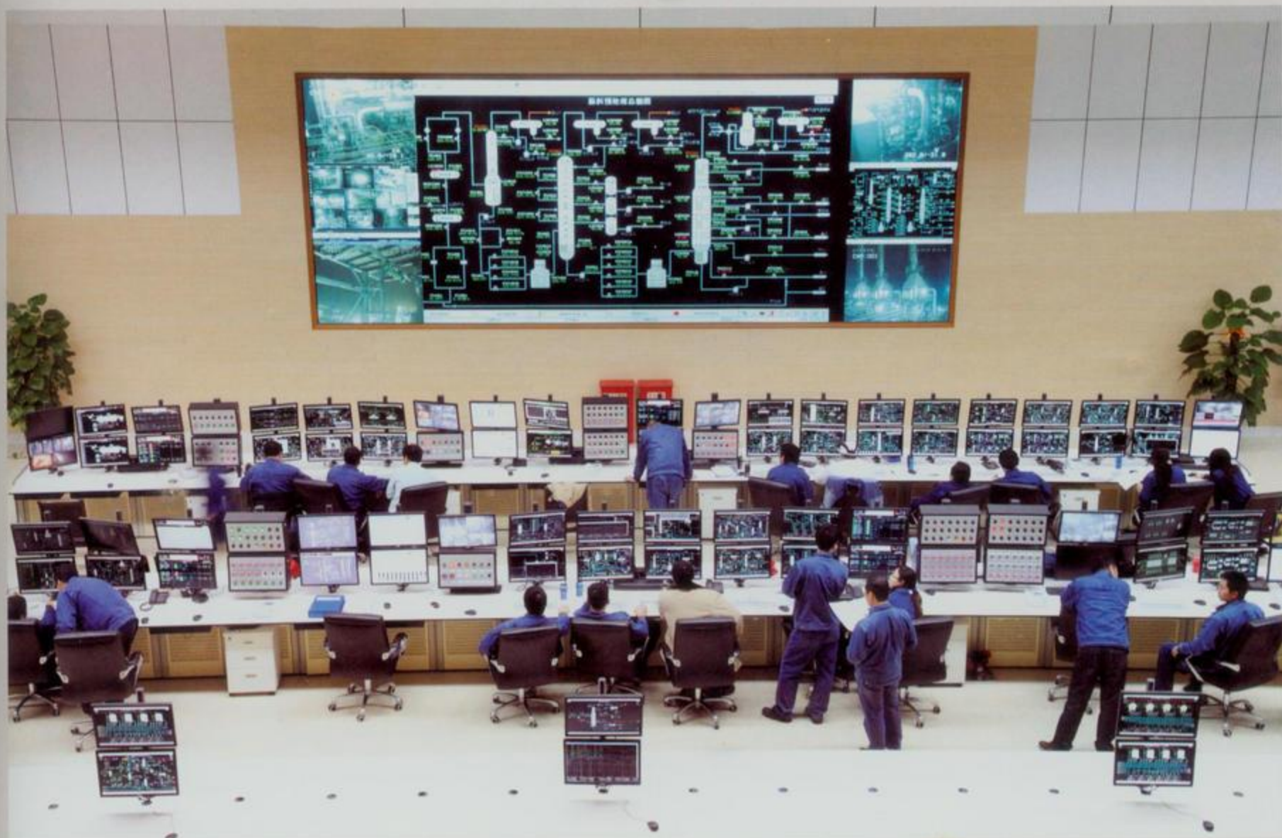
中石化炼油厂数控中心