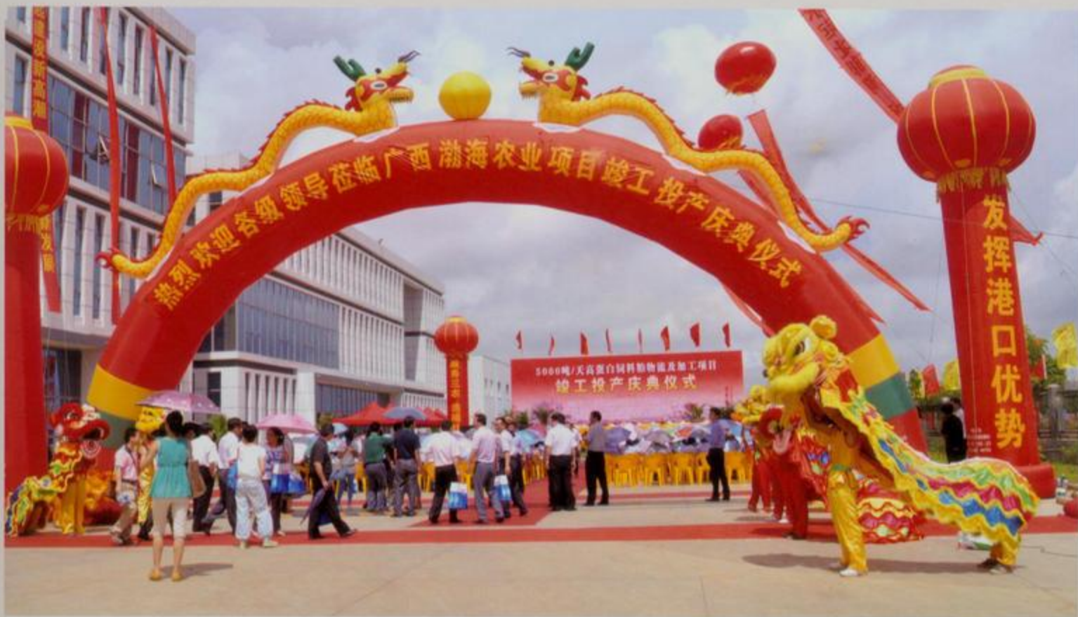
渤海农业项目竣工投产庆典