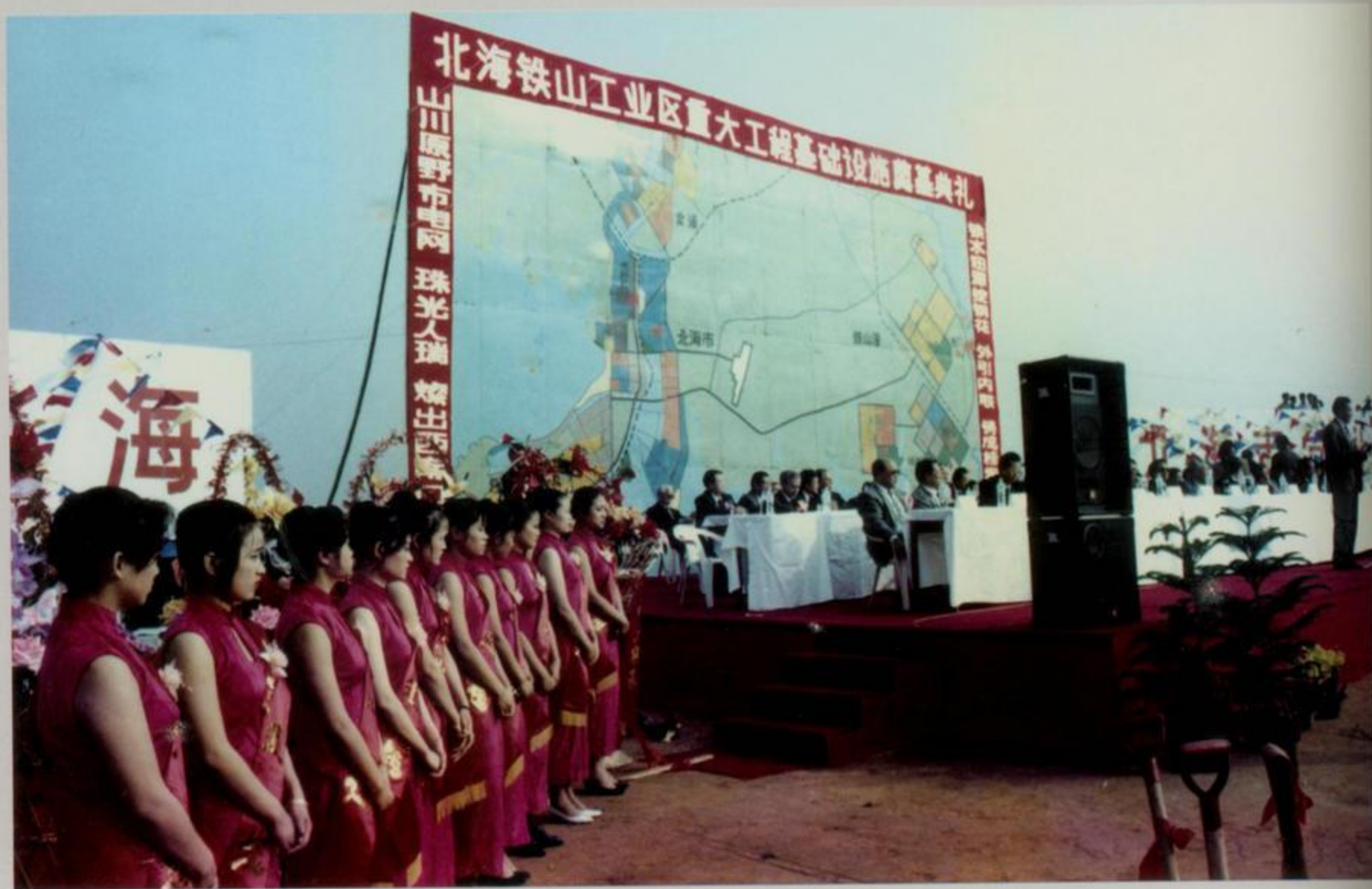
铁山港工业区重大项目基础设施奠基典礼

北海 500 多公里的海岸线，拥有天然良港。1994 年，铁山港工业区奠基，临港工业开始起步。进入 21 世纪后，北海全力加快铁山港基础设施建设步伐，打造临港石油化工、诚德镍业千亿元产业。2012 年，中石化项目实现满负荷运转，完成产值 281.52 亿元，临港新材料产业实现产值 151 亿元。临港工业的沸腾带动了北海工业产值的跨跃发展。