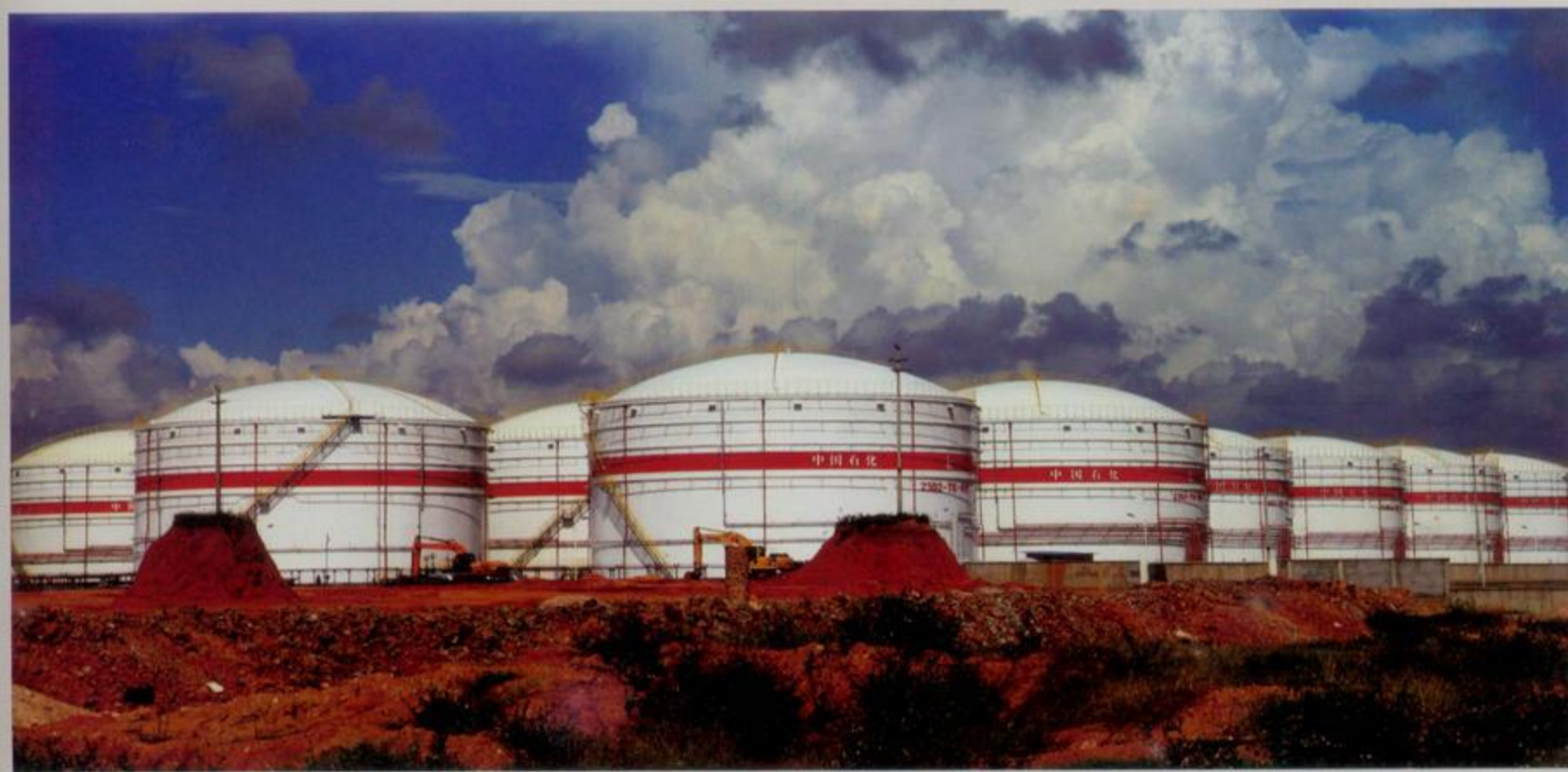
中石化炼油厂油库