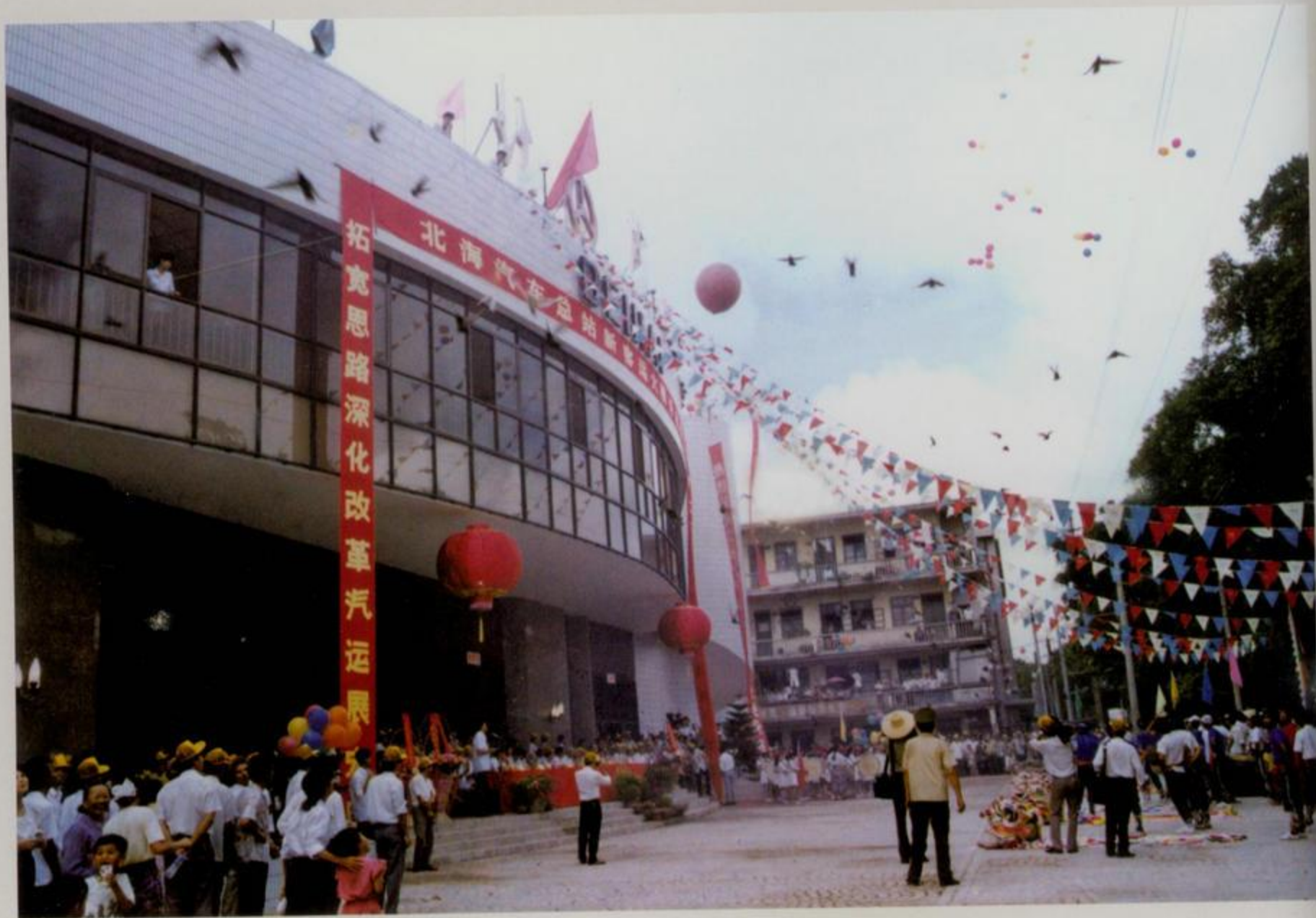
北海汽车总站客运大楼

交通的发展，物流的通畅，使得北海的商贸得到了很大的发展。1984年北海改革开放后，商贸队伍迅速扩大，1986年，全市商业企业3300个，从业人员13886人，社会商品零售总额26082万元。2012年，全年全市实现社会消费品零售总额146.51亿元。