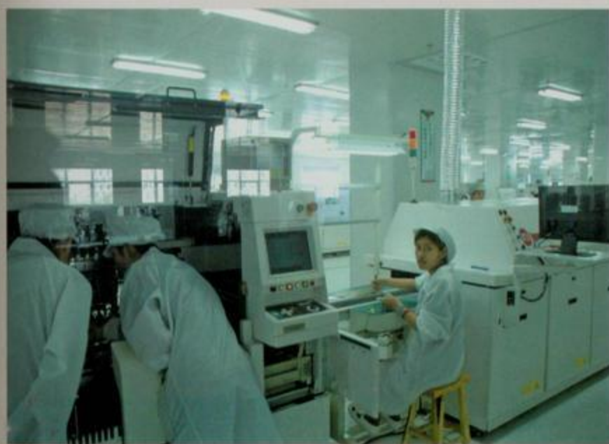
操作仪器的六禾电子工人