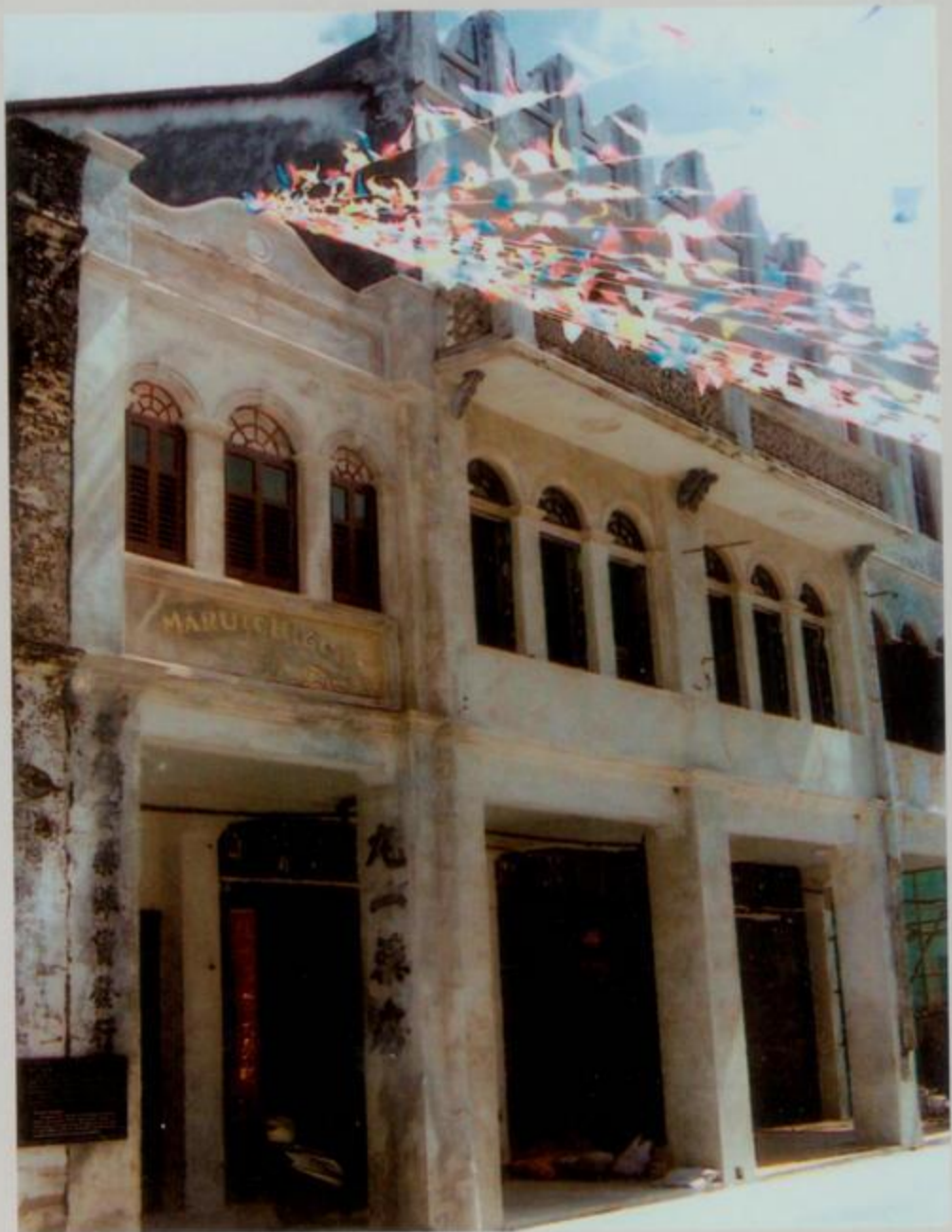
北海“丸一药房”旧址