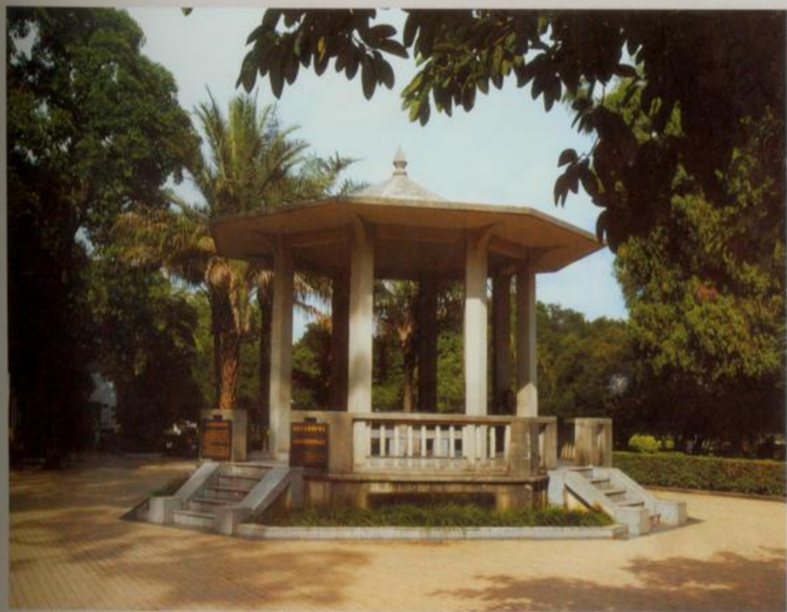
北海抗日战争胜利纪念亭

战争的硝烟已经弥散,留存下来的抗战遗址和抗日志士的遗物,是当年日军侵华罪行的见证,承载着中华之耻、民族之痛,凝结着北海人民万众一心、团结御侮的决心,是北海人民的精神丰碑。