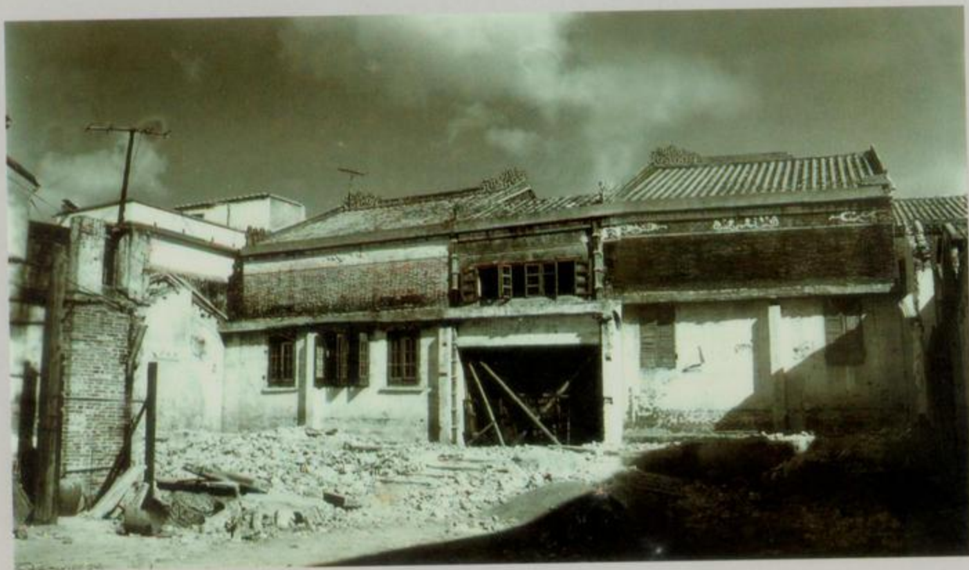
广州会馆南面建筑