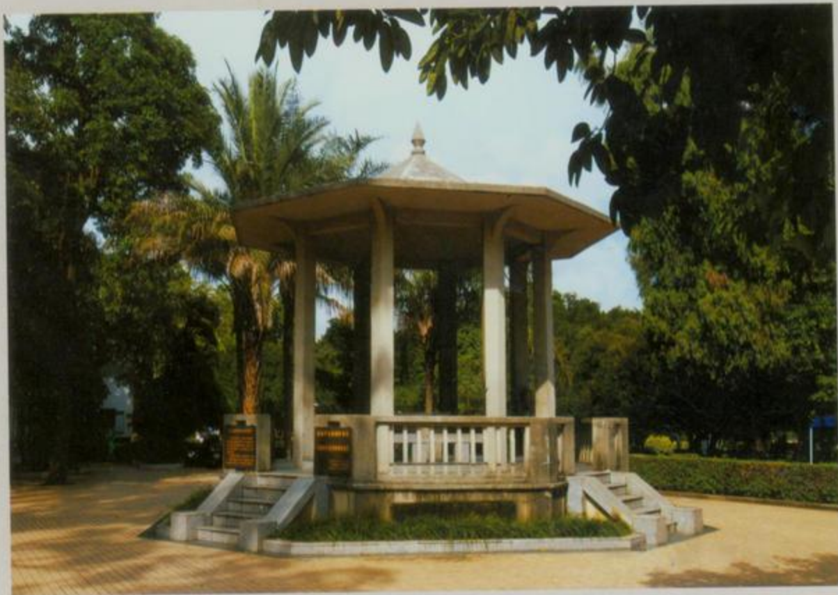
北海抗日战争胜利纪念亭

抗日战争胜利后,钦廉四属党组织进一步加强人民武装建设,继续坚持游击战争,巩固粤桂边山区革命根据地。1949年12月4日迎来了北海解放。北海历史从此翻开了新的一页。