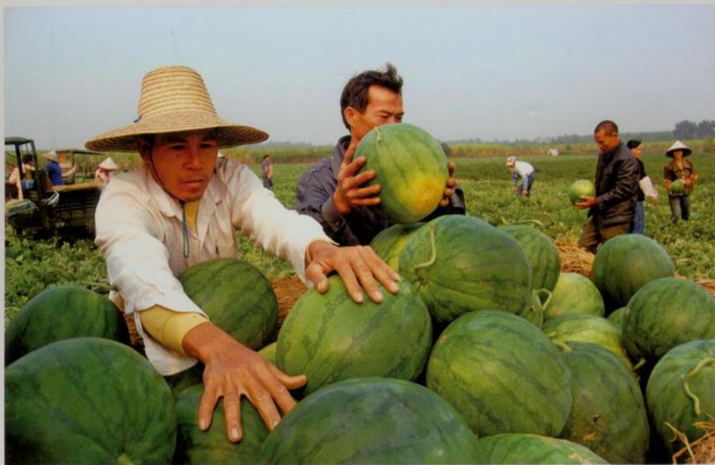
铁山港西瓜喜获丰收