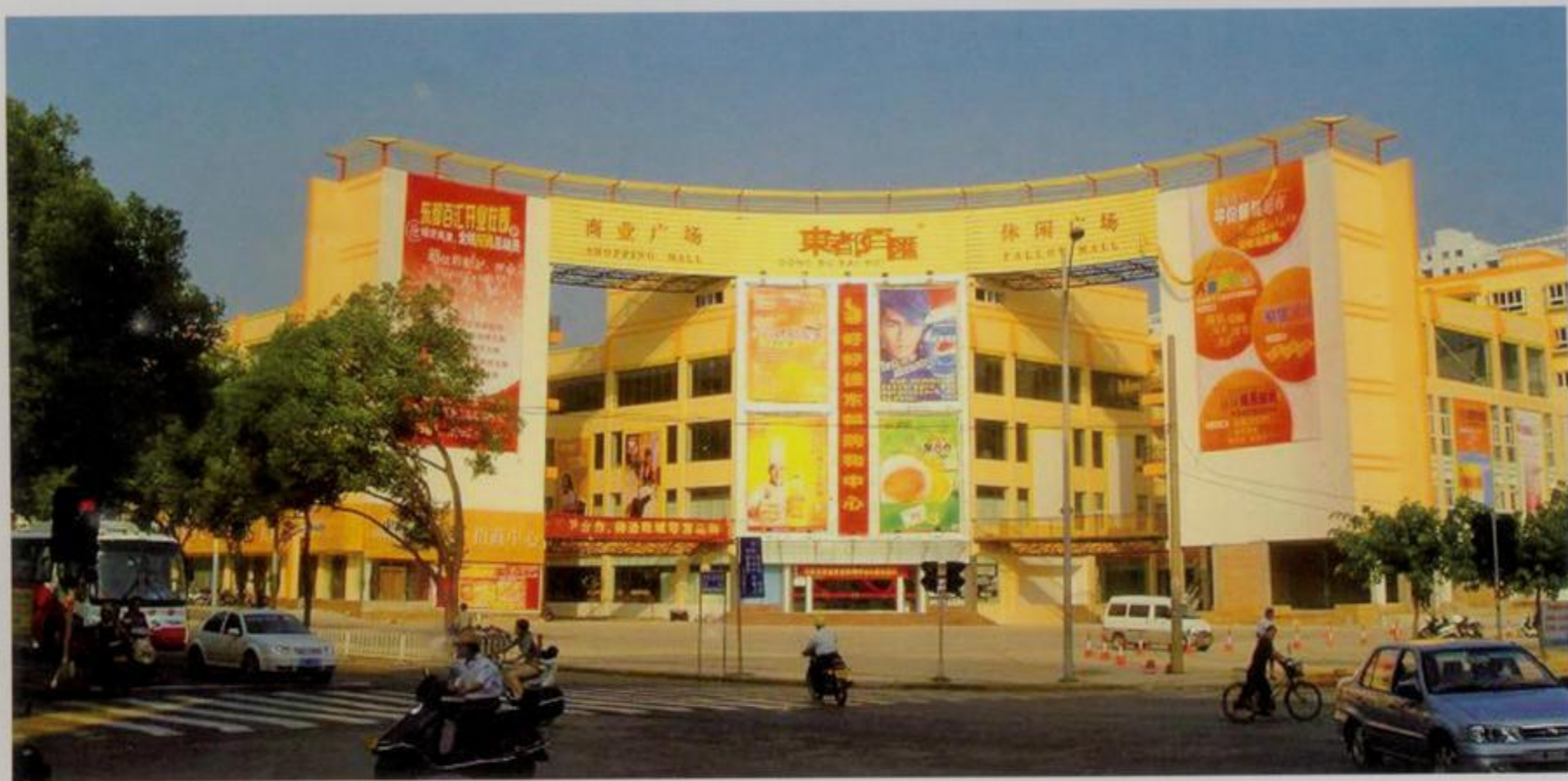
东都百汇商业广场