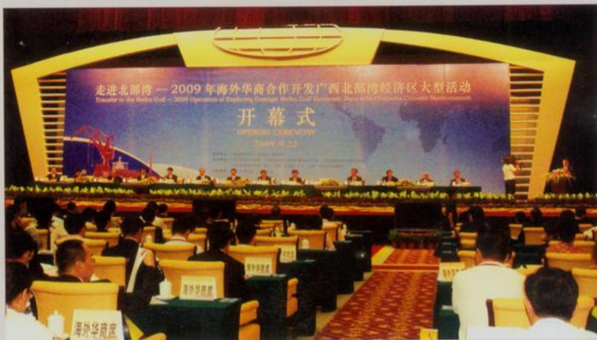
海外华商合作开发广西北部湾经济区 大型活动开幕式