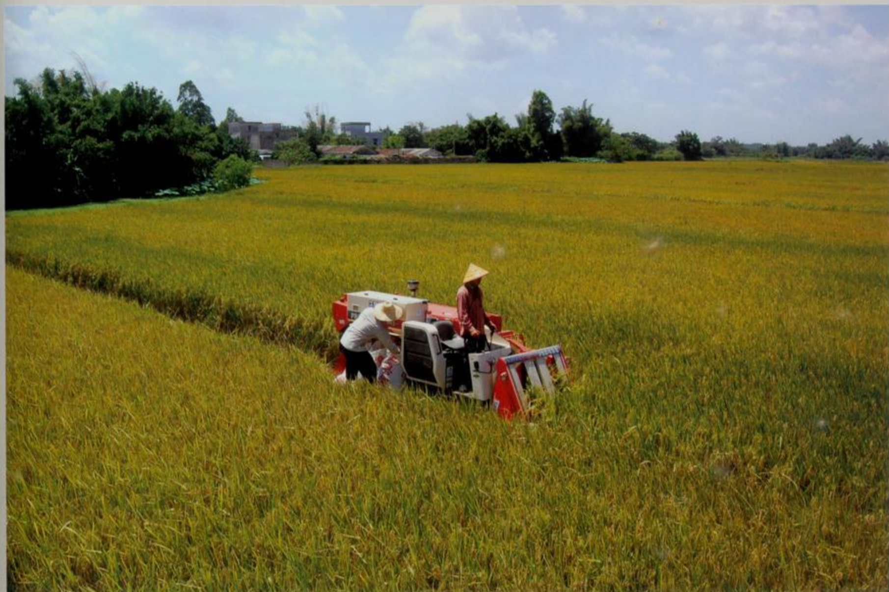
合浦党江超级稻生产基地