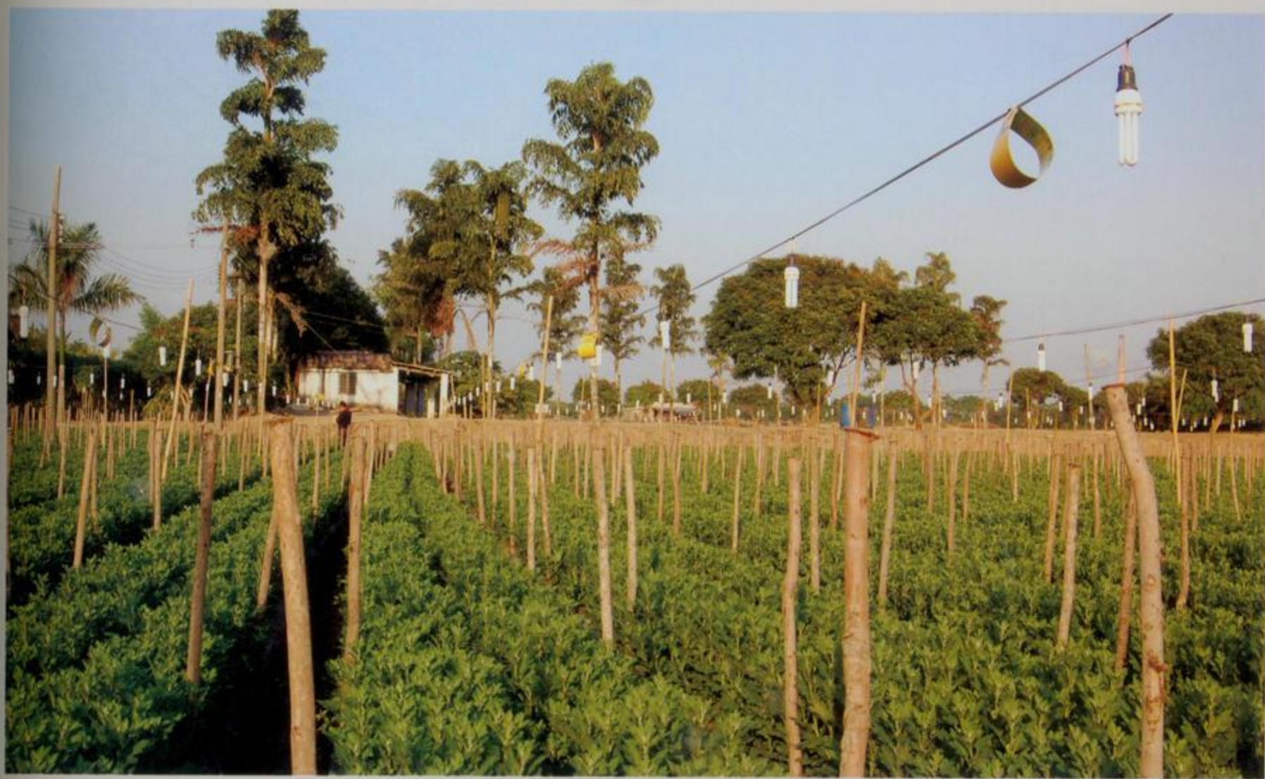
出口菊花生产基地