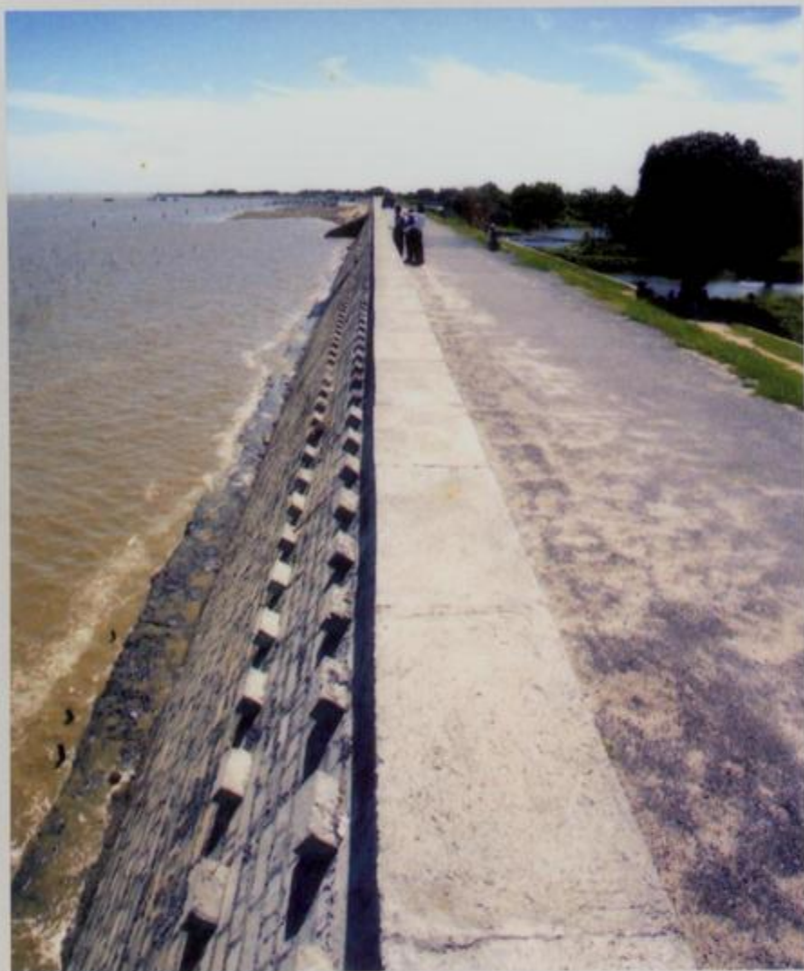
合浦西沙联围标准化海堤