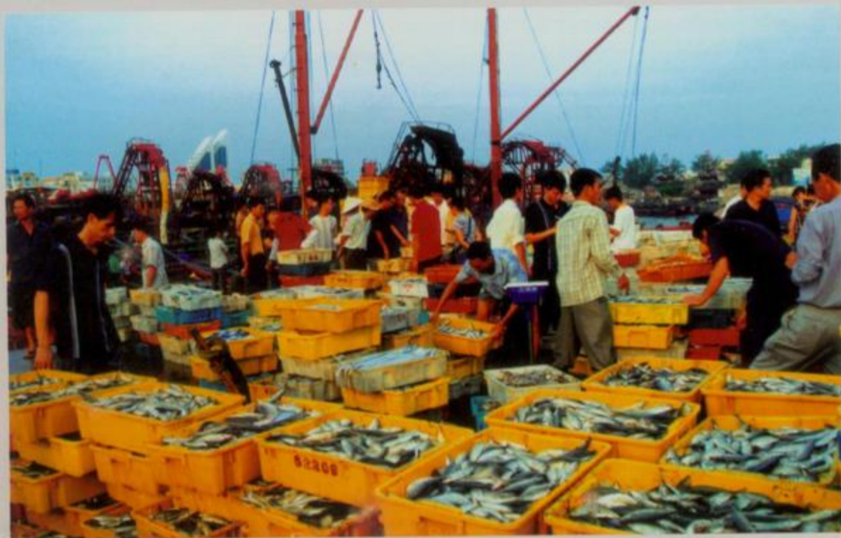
侨港鱼市