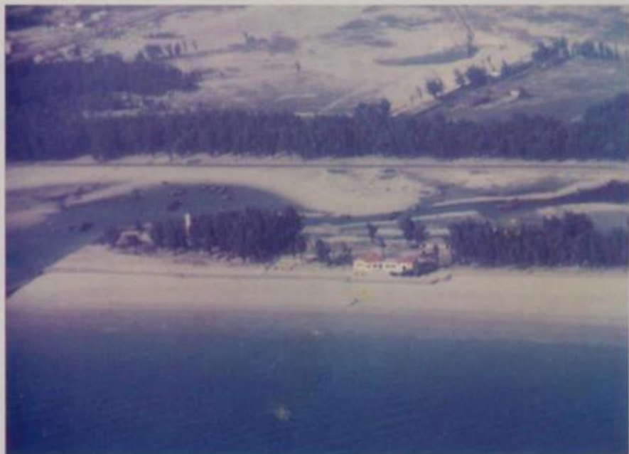
原白虎头沙滩概貌

旅游区改建为北海银滩国家旅游度假区。2001年列为首批国家4A级旅游区（当时4A是最高等级），2003年5月1日，银滩景区向游客免费开放，实现“还滩于大海、还滩于自然、还滩于人民”。