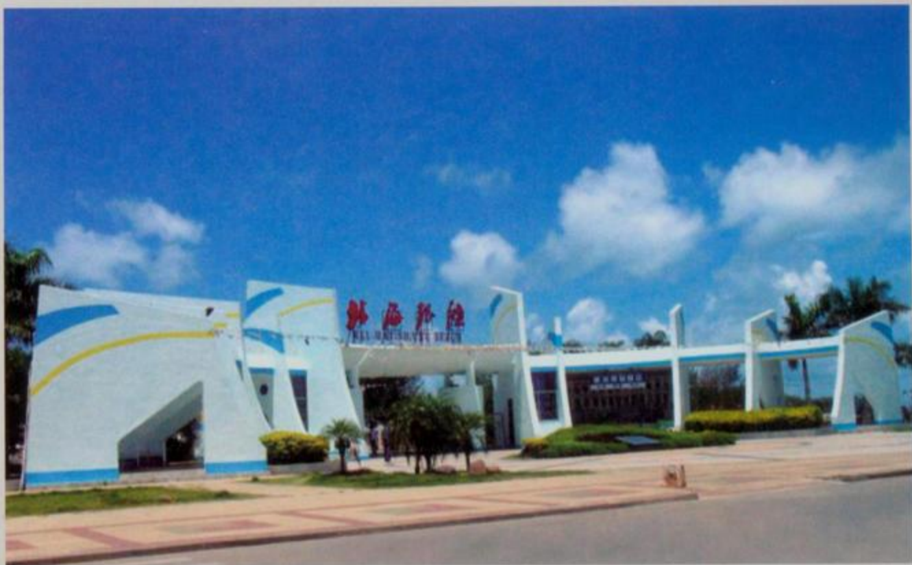
北海银滩公园正门