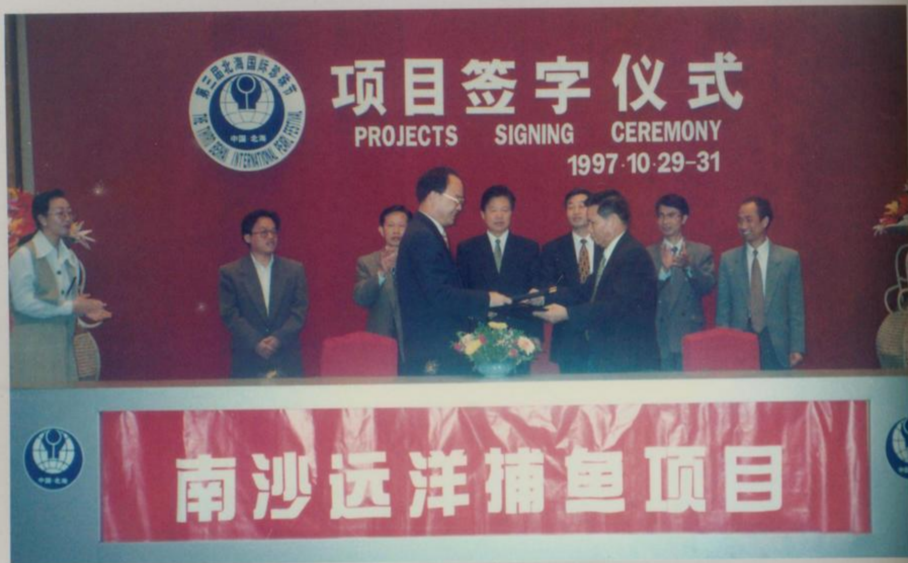
南沙远洋捕鱼项目签字仪式