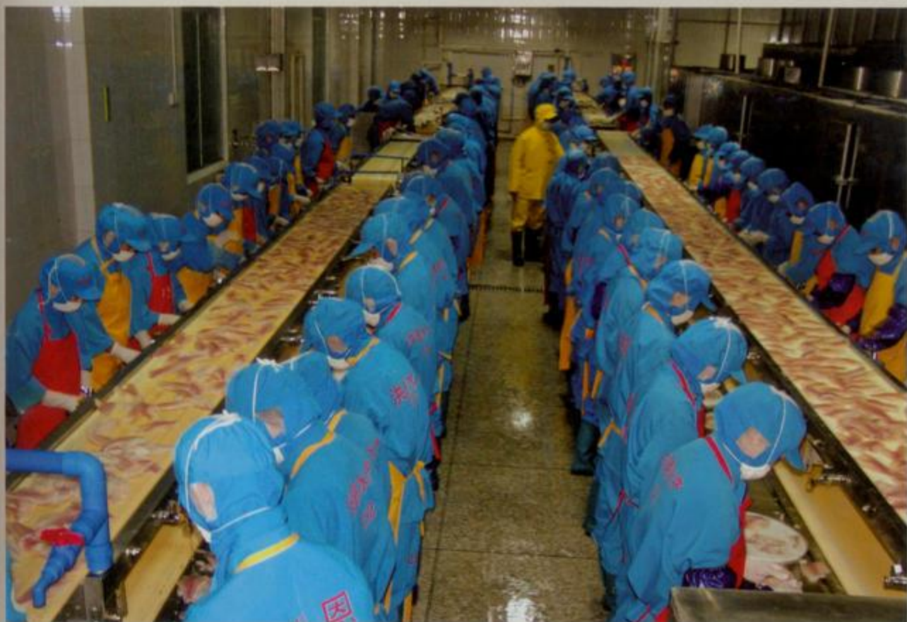
罗非鱼加工生产线 市水产局 供