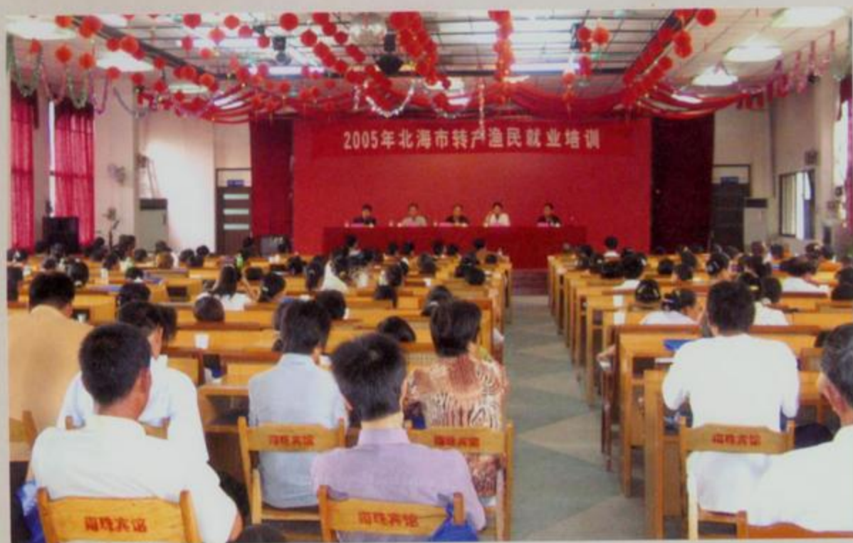
北海市转产渔民就业培训