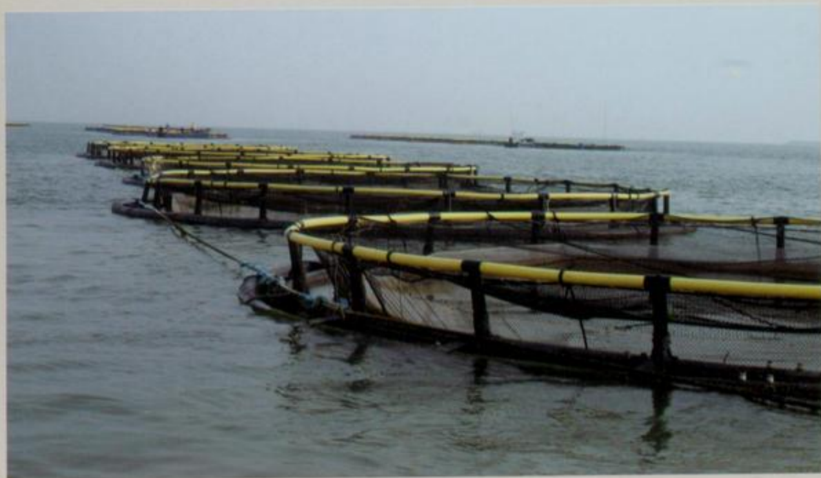
深海抗风浪网箱基地一角