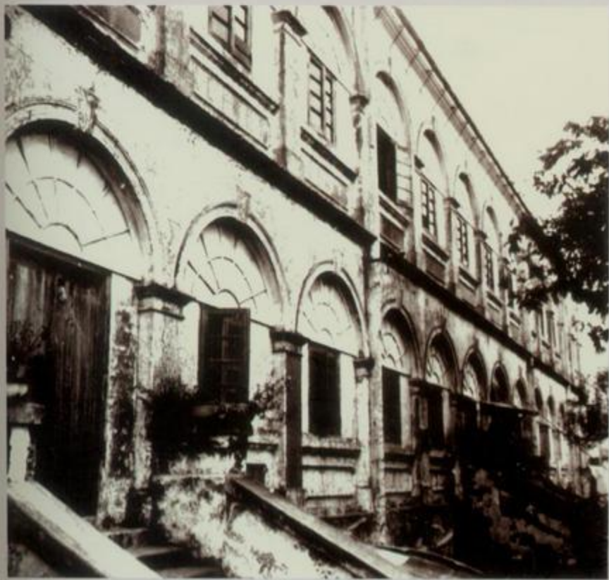
北海关外班洋员大楼旧址

清光绪三十年（1904年）北海关在离办公楼址不远的地方（旧称“崩沙口外”）买地一幅，于20世纪初建造洋关外班洋员大楼、监察长楼和俱乐部三座大小不同的洋楼。其中俱乐部因有一张英式桌球供洋人打球而出名，所以本地人又把俱乐部叫“波楼”。久而久之，人们把整个院子称为“波楼”，从此成为北海一个特别的老地名（已毁）。