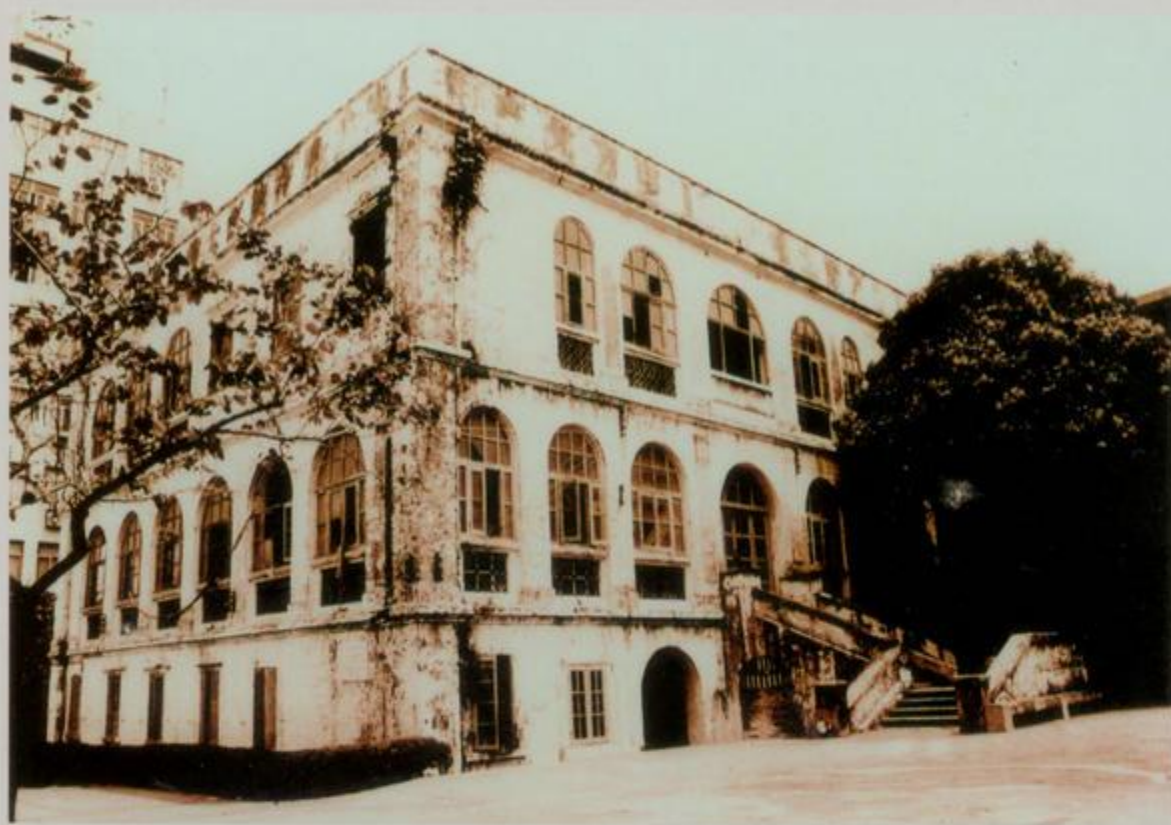
北海海关大楼旧址

位于北海市海关路海关大院内，清光绪三年（1877年）设北海关（旧称“洋关”），清光绪九年（1883年）建北海海关大楼，2001年公布为全国重点文物保护单位。