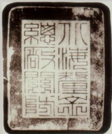
北海厘金總廠關防印

清光緒二年(1876)北海設厘金廠,除負責征收北海口岸的厘金稅外,還負責兼管設在廉州和欽州的兩個分廠。