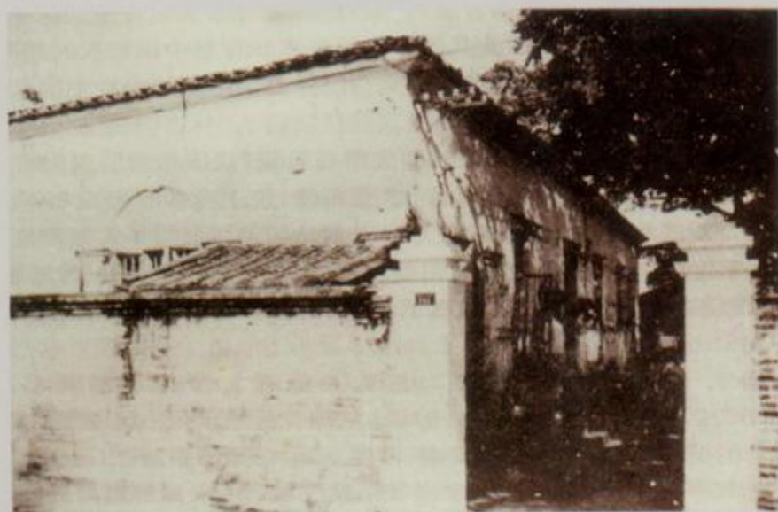
清末北海郵政分局舊址

清光緒八年(1882年)北海關設郵務辦事機構,兼辦郵遞業務,代送外國駐北海各使團、領事館文函和外籍官員、眷屬來往郵件。光緒二十一年郵務辦事處改稱海關寄信局,開始收寄國內公眾郵件。光緒二十二年,清政府開辦“大清郵政”。次年北海海關寄信局轉為北海大清郵政局,局址在北海關所在地牛車路街(今中東路204號)。