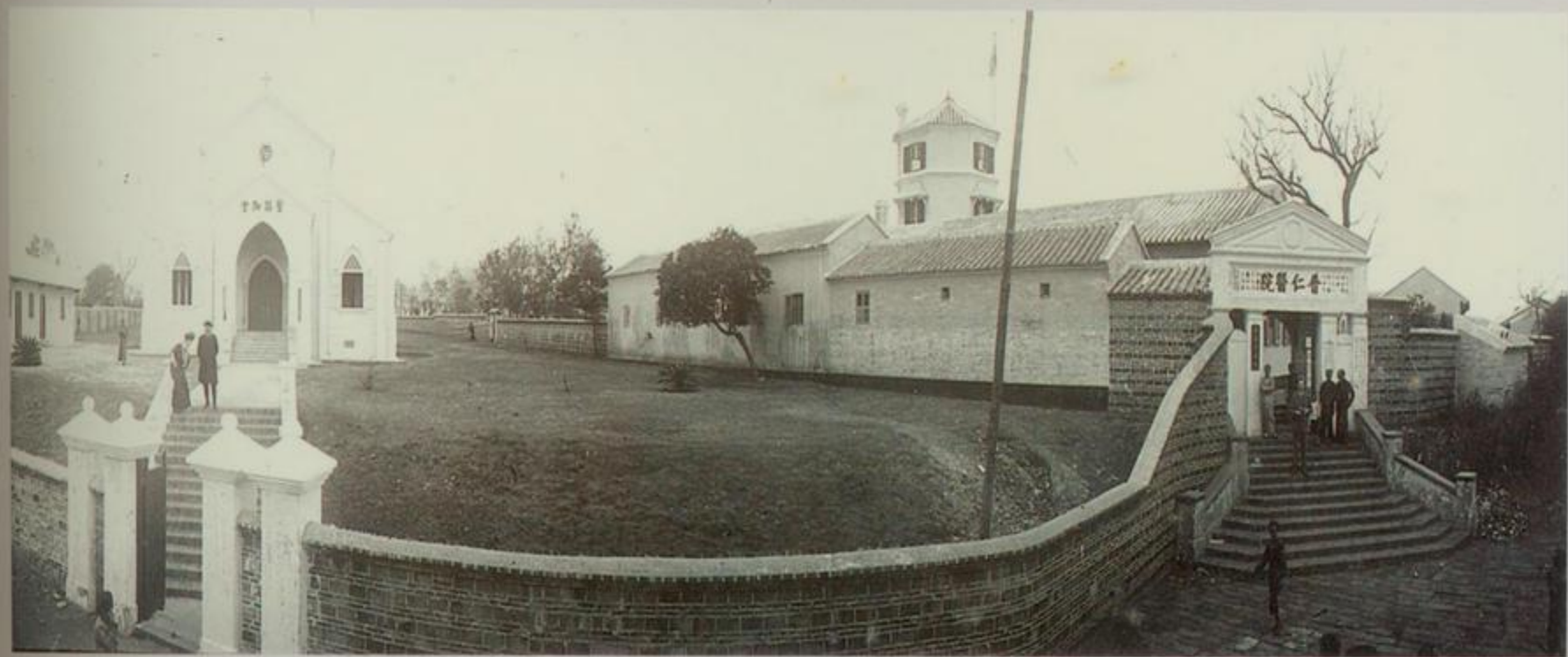
北海普仁医院和北海圣路加教堂