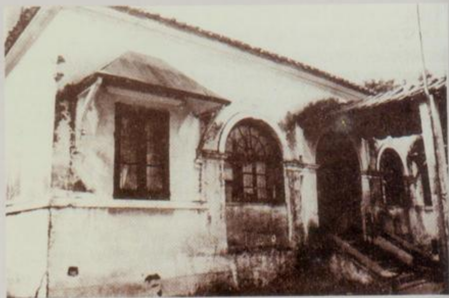
清末至民國時期郵政局長公寓舊址