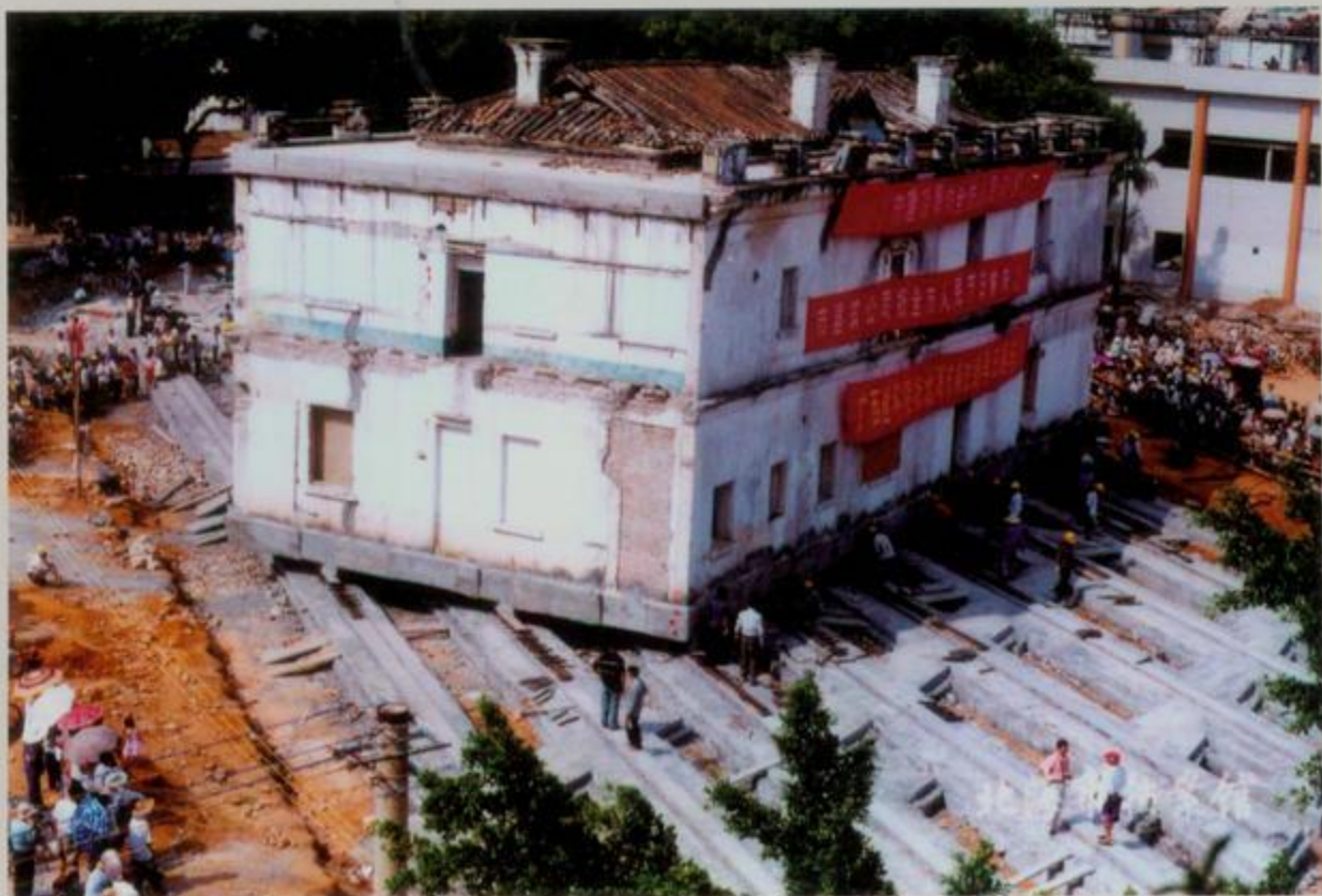
英国领事馆平移现场

设于清光绪三年（1877年），馆址建于清光绪十一年（1885年），位于市一中校园内，为二层券廊式西洋建筑，建筑面积664平方米。该馆是外国在广西设立最早的领事馆，民国11年（1922年）撤。2001年公布为国家重点文物保护单位。