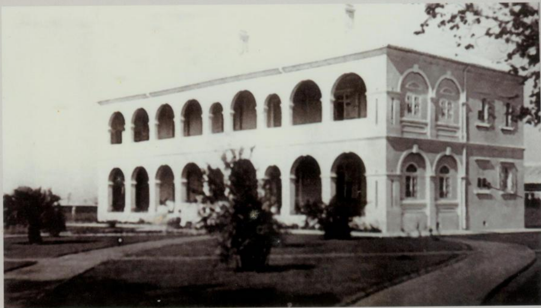
北海普仁医院院长宿舍楼