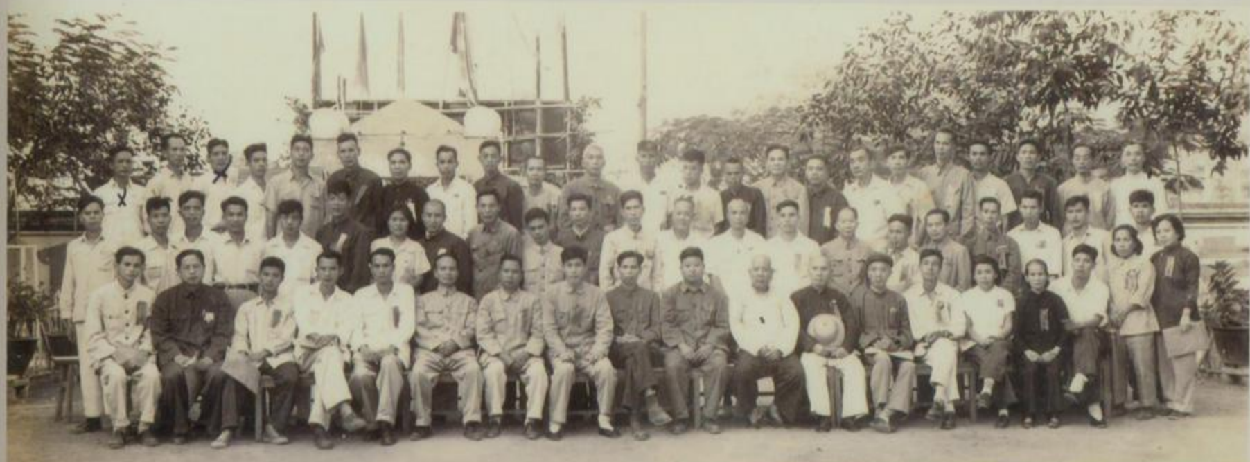
中国人民政治协商会议 北海市第一届委员会第二次全体会议摄影 一九五六年十一月一日