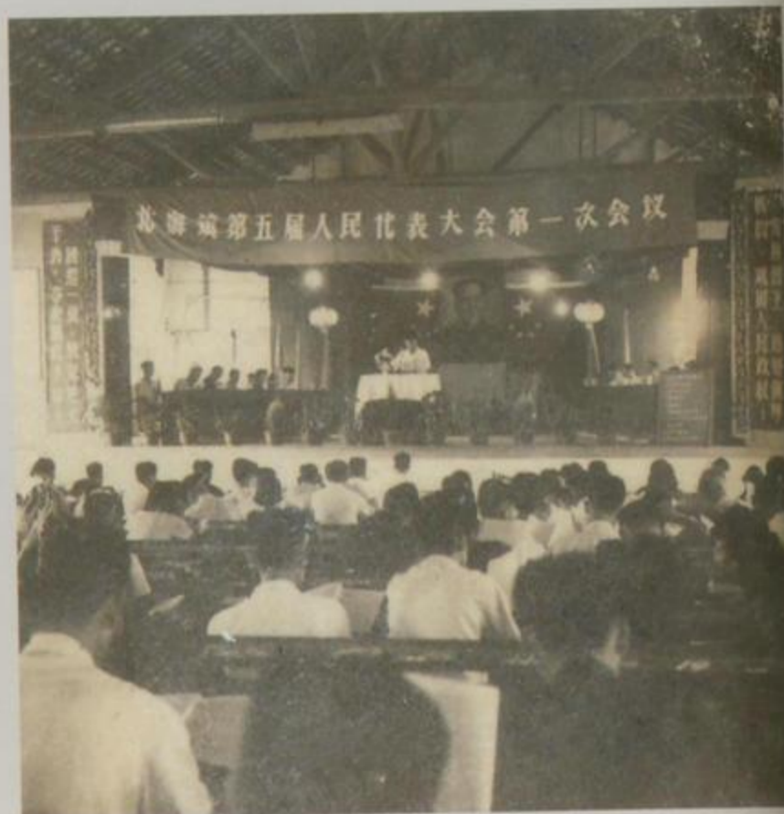
北海镇第五届人民代表大会第一次会议