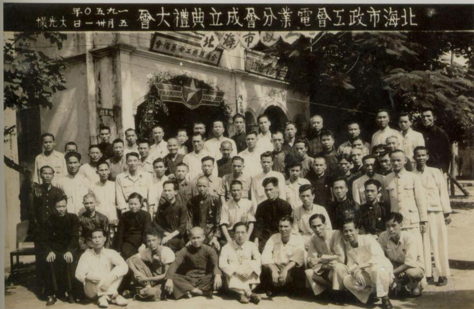
北海市政工會電業分會成立典禮大會合影

20世纪50年代初期，北海一些行业成立行业工会。1953年12月，北海市首届工会会员大会召开，大会选举产生市总工会第一届执行委员会，成立北海市总工会。