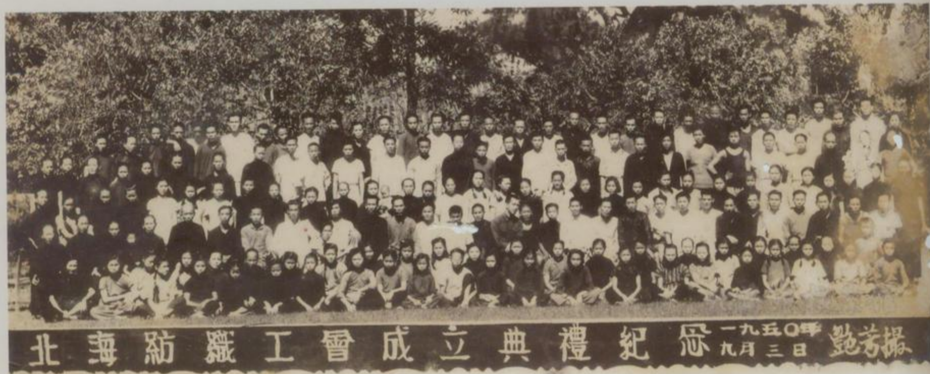
北海纺织工会成立合影 摄于1950年9月3日