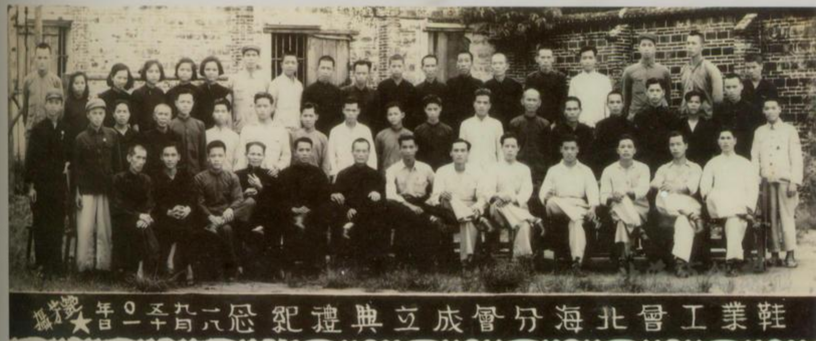
鞋業工會北海分會成立合影