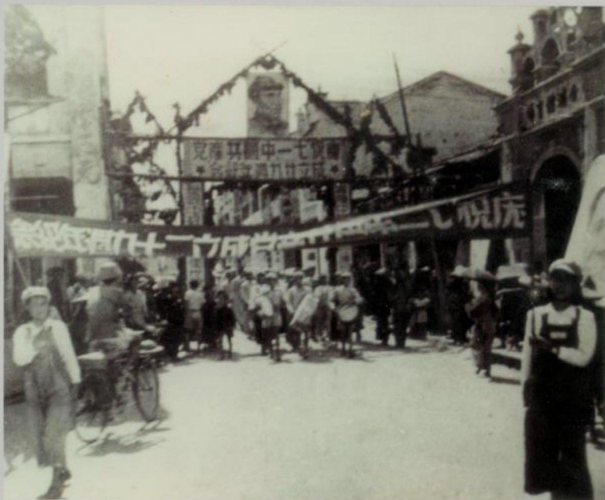
1950年，北海镇庆祝中国共产党成立29周年的游行队伍。