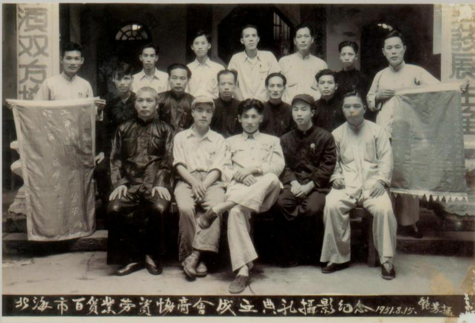
北海市百貨業勞資協商會成立典禮攝影紀念 1951.8.15.