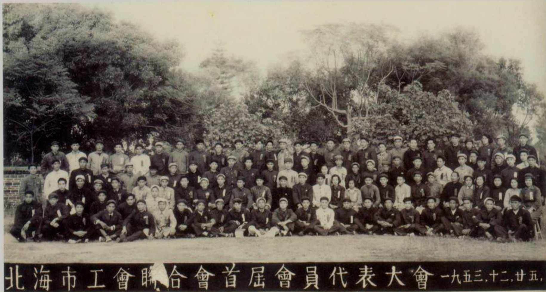
北海市工会联合会首届会员代表大会合影