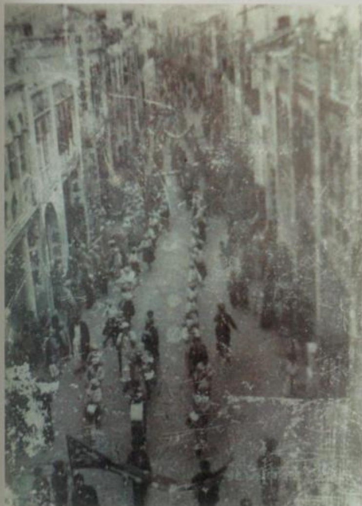
1950年，元旦大会后游行队伍。