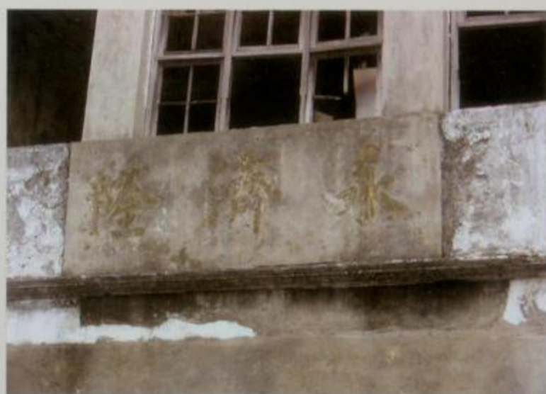
建筑物上“永济隆”三字还依稀可辨