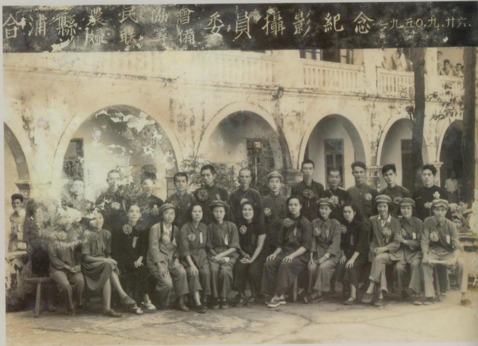
合浦县农民协会、妇联筹备会委员合影 摄于1950年9月26日