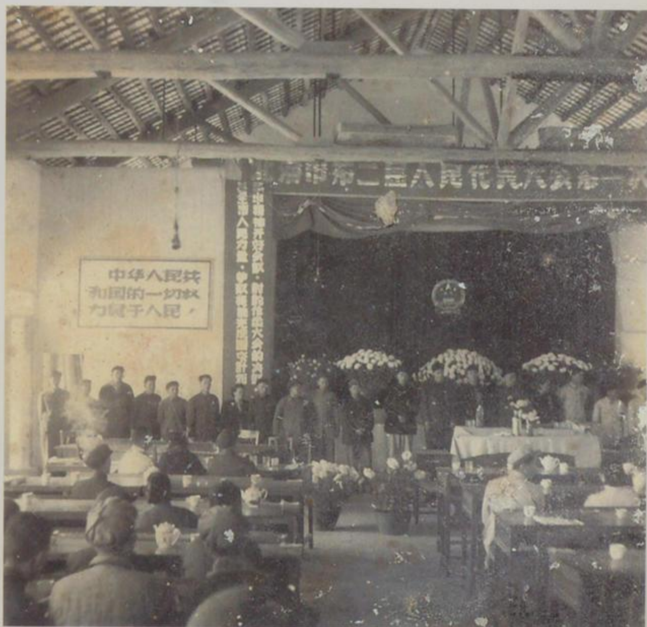
北海市第二届人民代表大会第一次会议