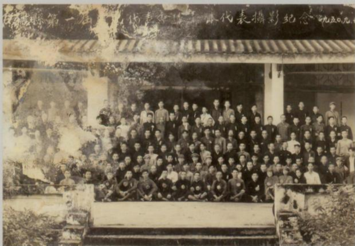
合浦县第一届人民代表大会全体代表合影

1950年9月27日~10月4日在廉州镇举行合浦县第一届各界人民代表会议，出席会议代表402人，其中北海镇代表40人。