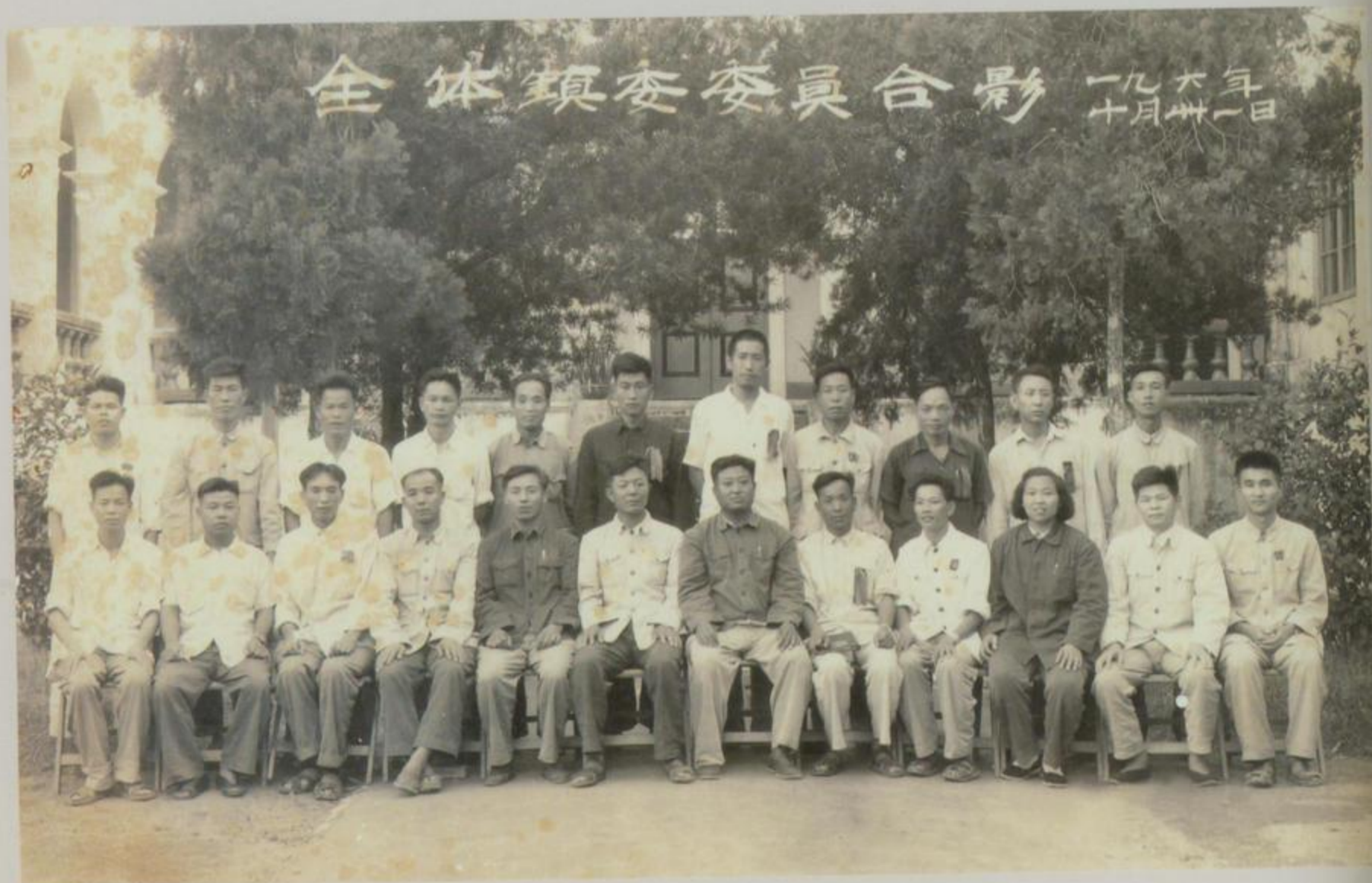
北海镇全体镇委委员合影