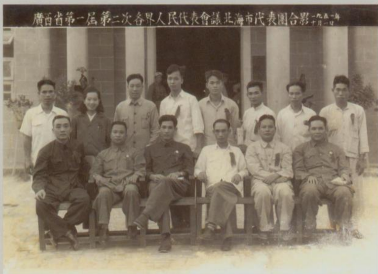
广西省第一届第二次各界人民代表会议北海市代表团合影