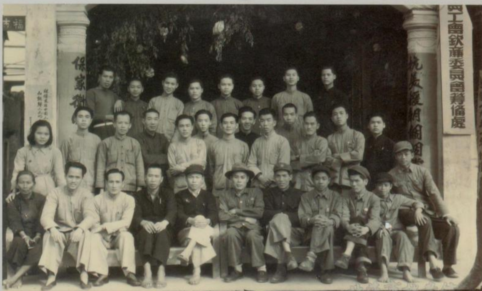
北海市百貨店員工會成立紀念攝影