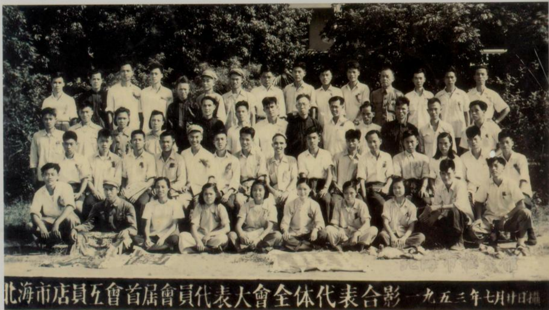
北海市店员工会首届会员代表大会全体代表合影