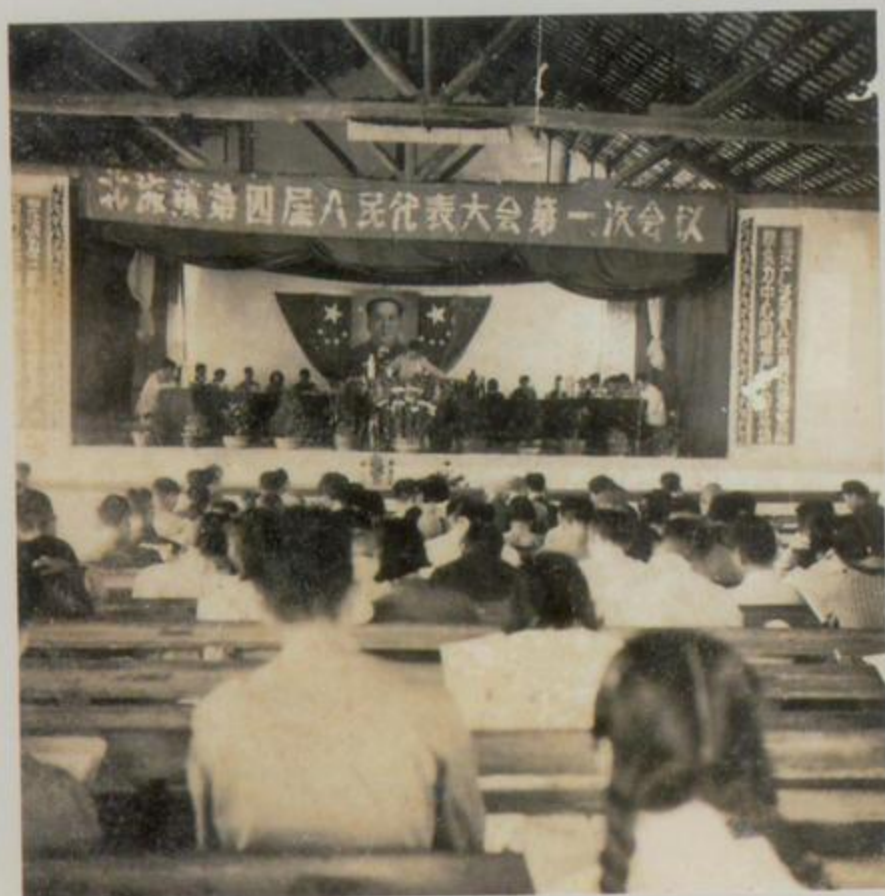
北海镇第四届人民代表大会第一次会议