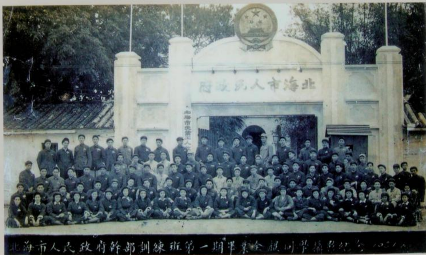
北海市第一期干部 训练班合影

1951年8月北海市举办第一期干部训练班，学员128人，10月4日训练班结束。图为全体学员与市领导在原北海市人民政府大门（今市政府北面围墙——北海市人民群众来访接待中心左侧）的合影。