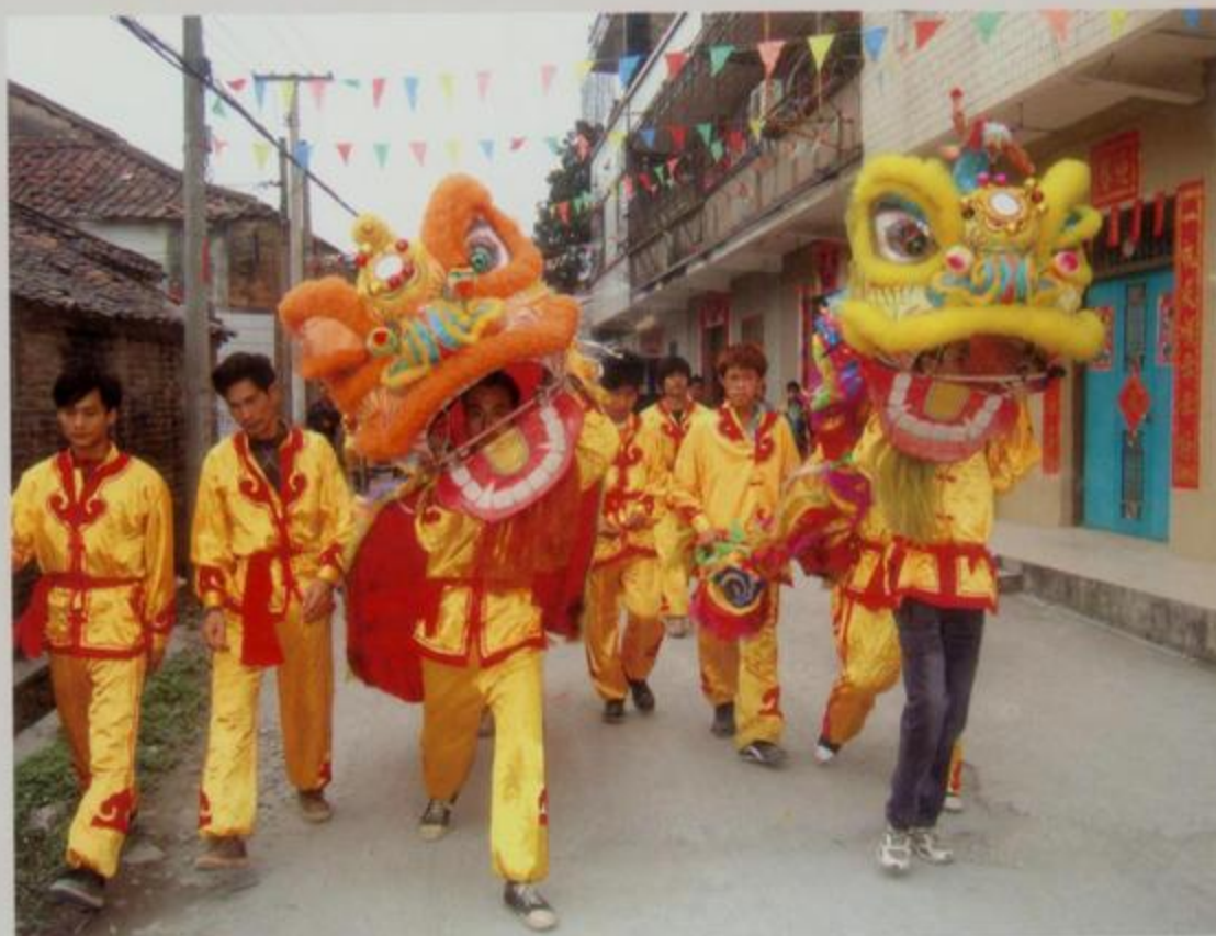
客家人的拜年活动