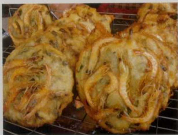
北海特色小吃虾仔粿