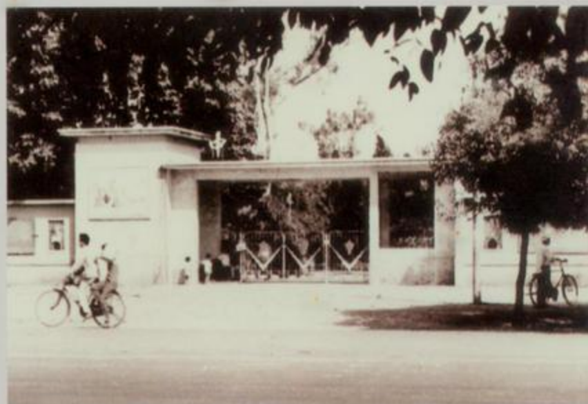
20 世纪 80 年代的中山公园大门