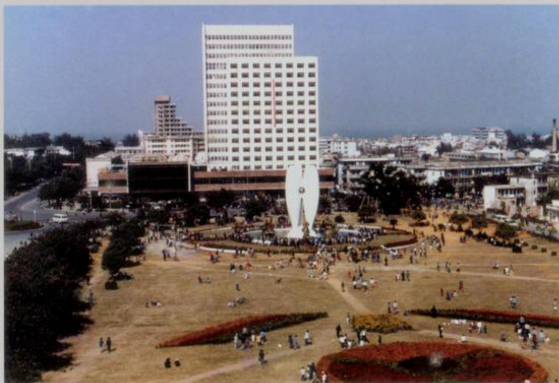
1988年的北部湾广场