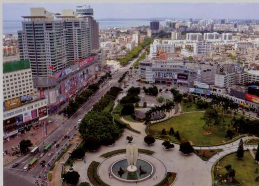
2008年的北部湾广场