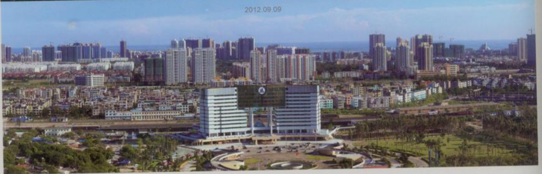
火车站周边建筑变化