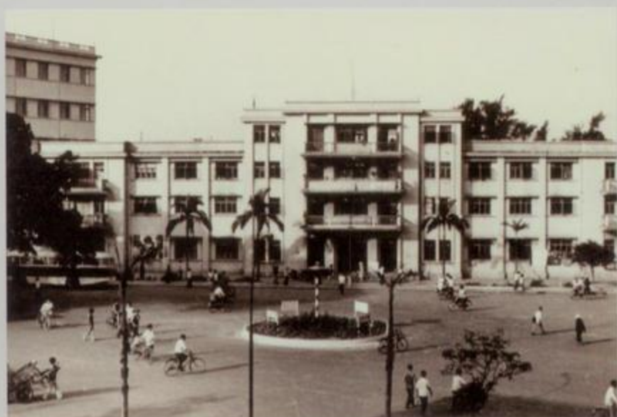
20 世纪 80 年代的东方红广场 现邮电大楼门前广场