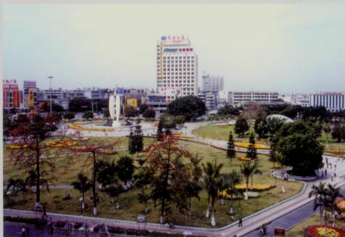
1999年的北部湾广场