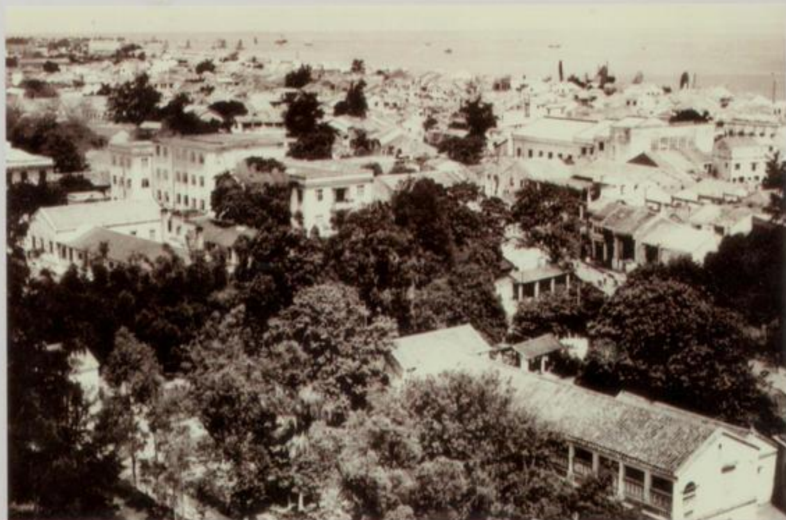
20 世纪 80 年代市区俯瞰图