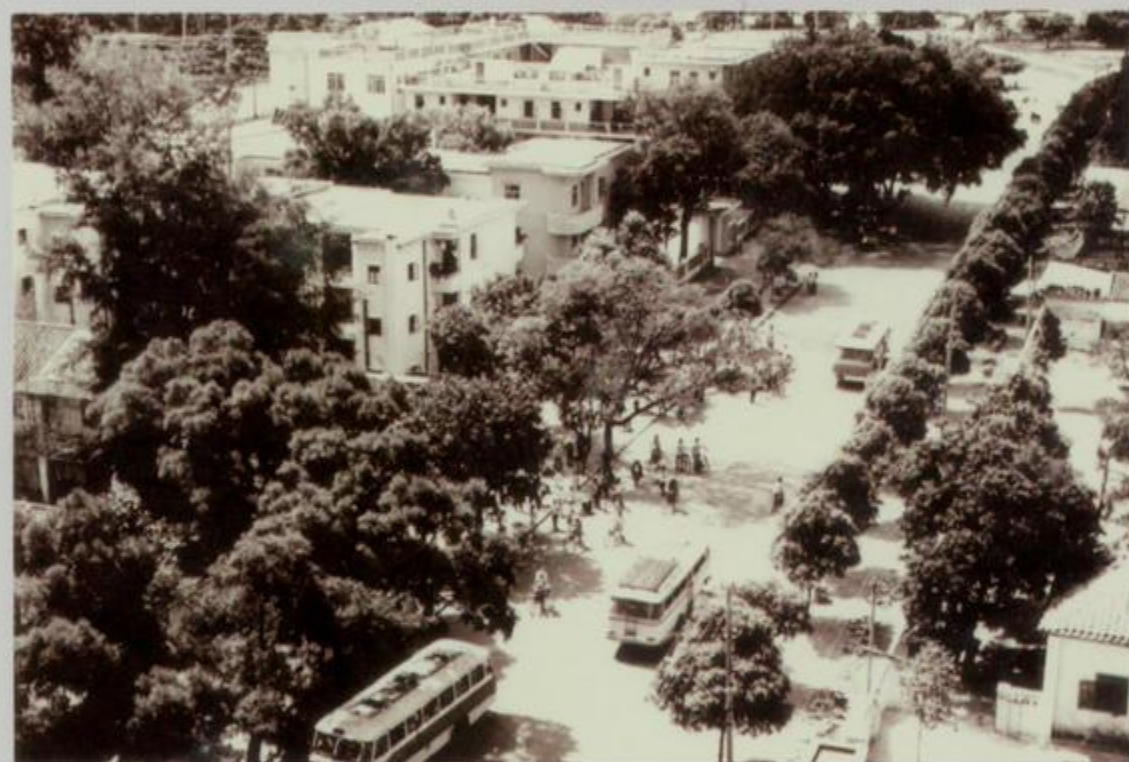
20 世纪 80 年代的解放路上段