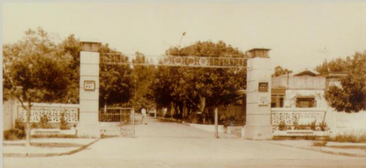
北海市风机厂大门