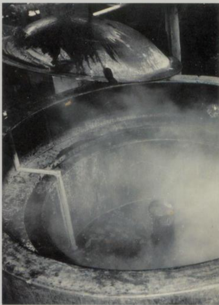
北海市染织厂解放初期纺纱车间之三