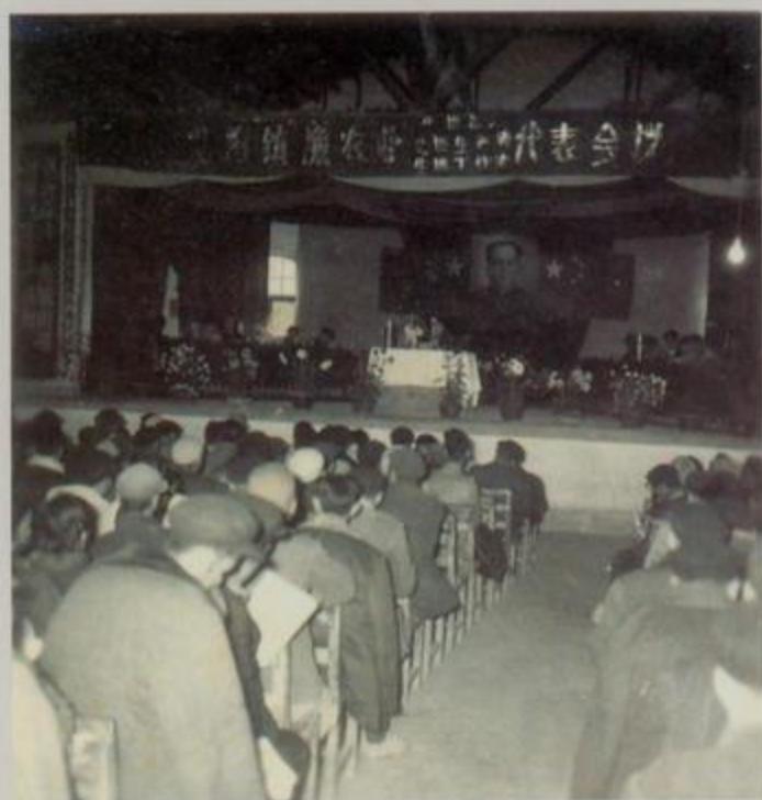
北海镇渔农业先进单位、先进生产者、先进工作者代表会议