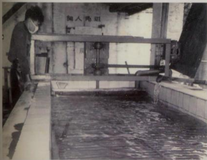
北海市染织厂解放初期纺纱车间之二