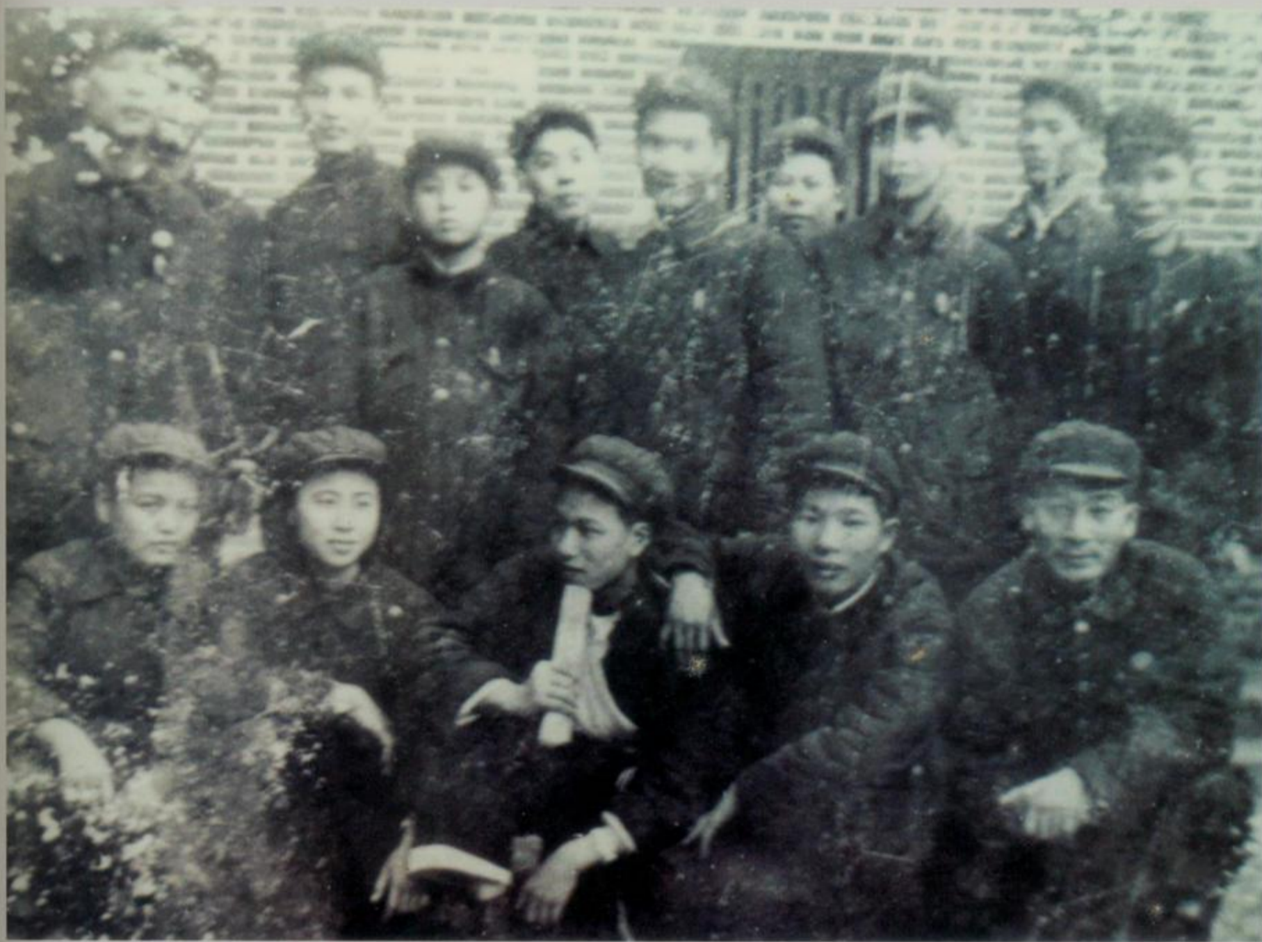
参加土改试点工作队员在合浦白沙合影

1951年1月，中共钦廉地委在合浦白沙乡3个联村进行土改试点工作，1952年8月，北海市土地改革指挥部成立，1953年4月土改结束。