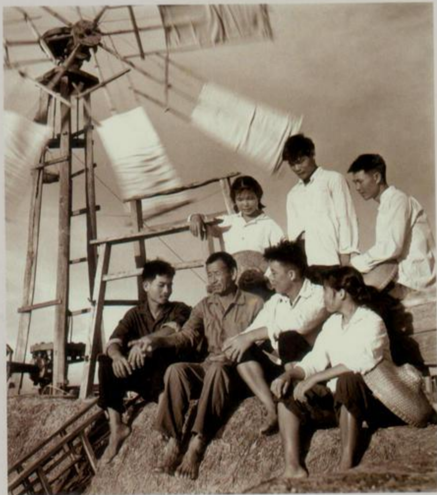
1973年，北暮盐场第一工区的青年盐工，在盐田边听老盐工“忆苦思甜”。