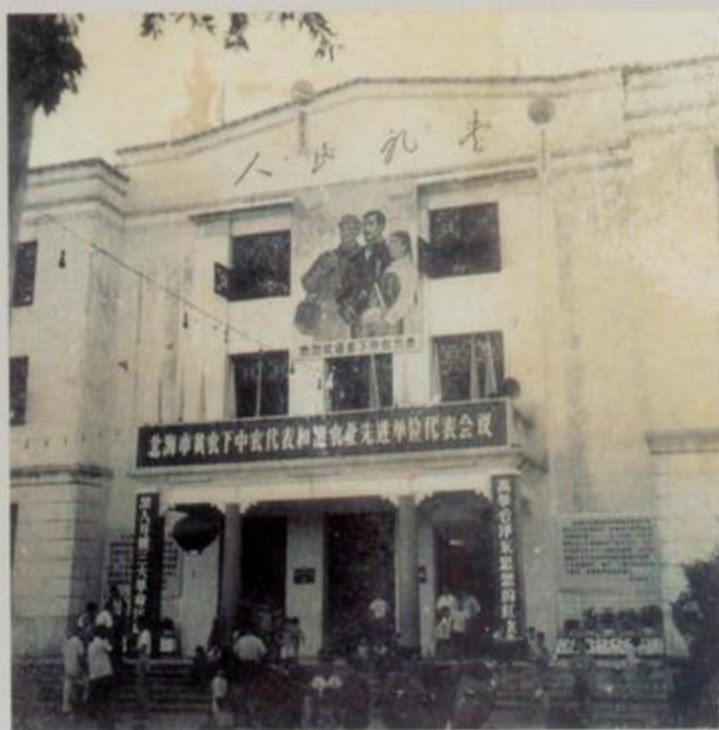
北海市贫农下中农代表和渔农业先进代表会议