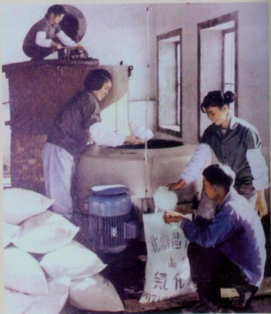
70年代，北暮盐场职工自建小化工厂，生产氯化钾等化工产品。