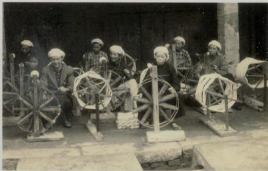
解放初期，北海市染织厂纺纱工人在纺纱。