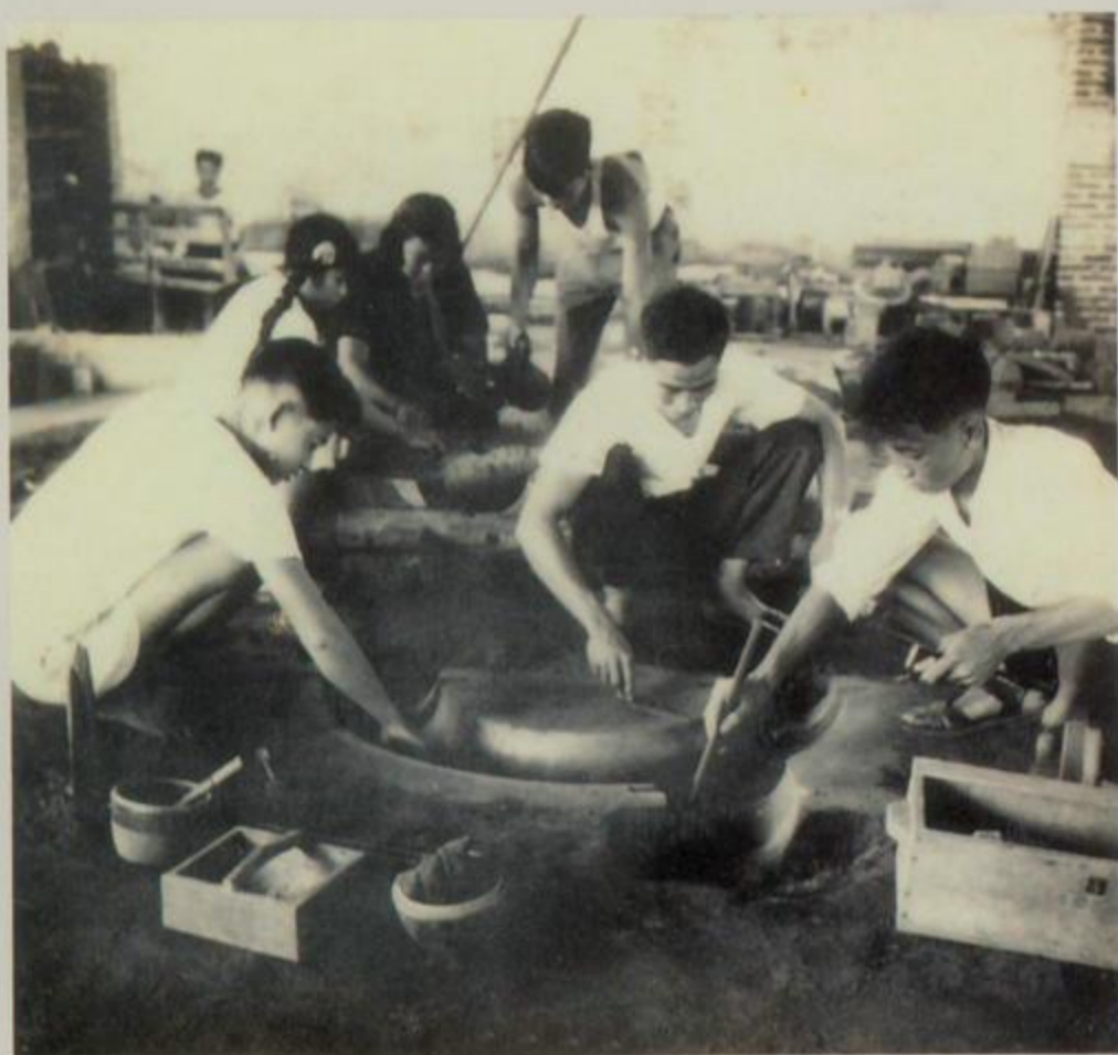
铸造车间工友在做沙模