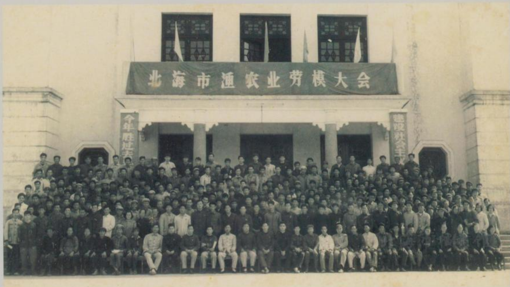
北海市渔农业劳模大会合影

20世纪五六十年代，是一个激情飞扬的年代，刚刚当家做主的北海人民以主人翁精神，积极投身社会主义建设，各行各业涌现了许多劳动模范和先进工作者。