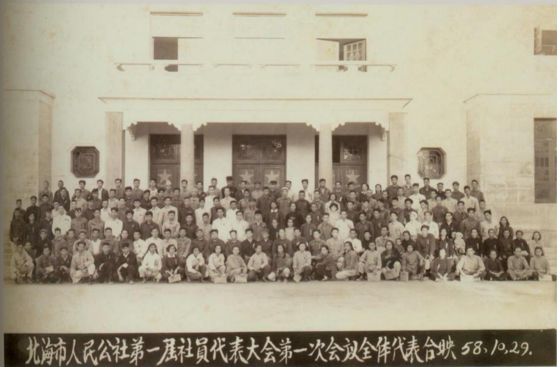
北海市人民公社第一届社员代表大会第一次会议全体代表合影 58.10.29.

1958年11月，掀起人民公社化运动高潮。北海市改为合浦县北海人民公社，原中共北海市委员会、北海市人民政府分别改为中共合浦县北海公社委员会和北海人民公社管理委员会。公社下设郊区、渔业、城市、涠洲4个团。1959年6月，撤销合浦县北海人民公社建制，设北海镇（县级），受广东湛江专署管辖，下辖渔业、郊区、城镇、涠洲4个公社。1984年9月撤销渔业、郊区、城镇、涠洲公社建制，设乡镇建制。