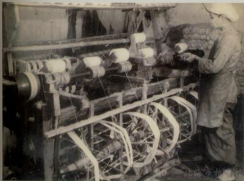
北海市染织厂解放初期纺纱车间之一

北海解放前夕，全市有私营织布厂 128 家。1952 年，广成兴、艺兴、国强等 9 家较大的私营布厂实行联营。1954 年，建立公私合营桂南染织厂。1958 年，北海市公私合营桂南染织厂改名为地方国营北海市染织厂，集染织于一家。