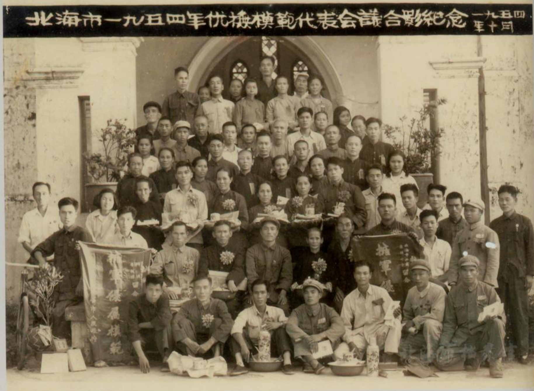
北海市 1954 年优抚模范代表会议合影

解放后，北海市认真做好对革命烈军属、残废军人以及复员退伍军人的优待抚恤工作，给军烈属及复员退伍军人生产、生活、入学、就业、医疗等方面给予优待。根据国家颁布的有关牺牲病故人员，革命伤残军人、烈军属和复员退伍军人的抚恤条例，分别给予抚恤。