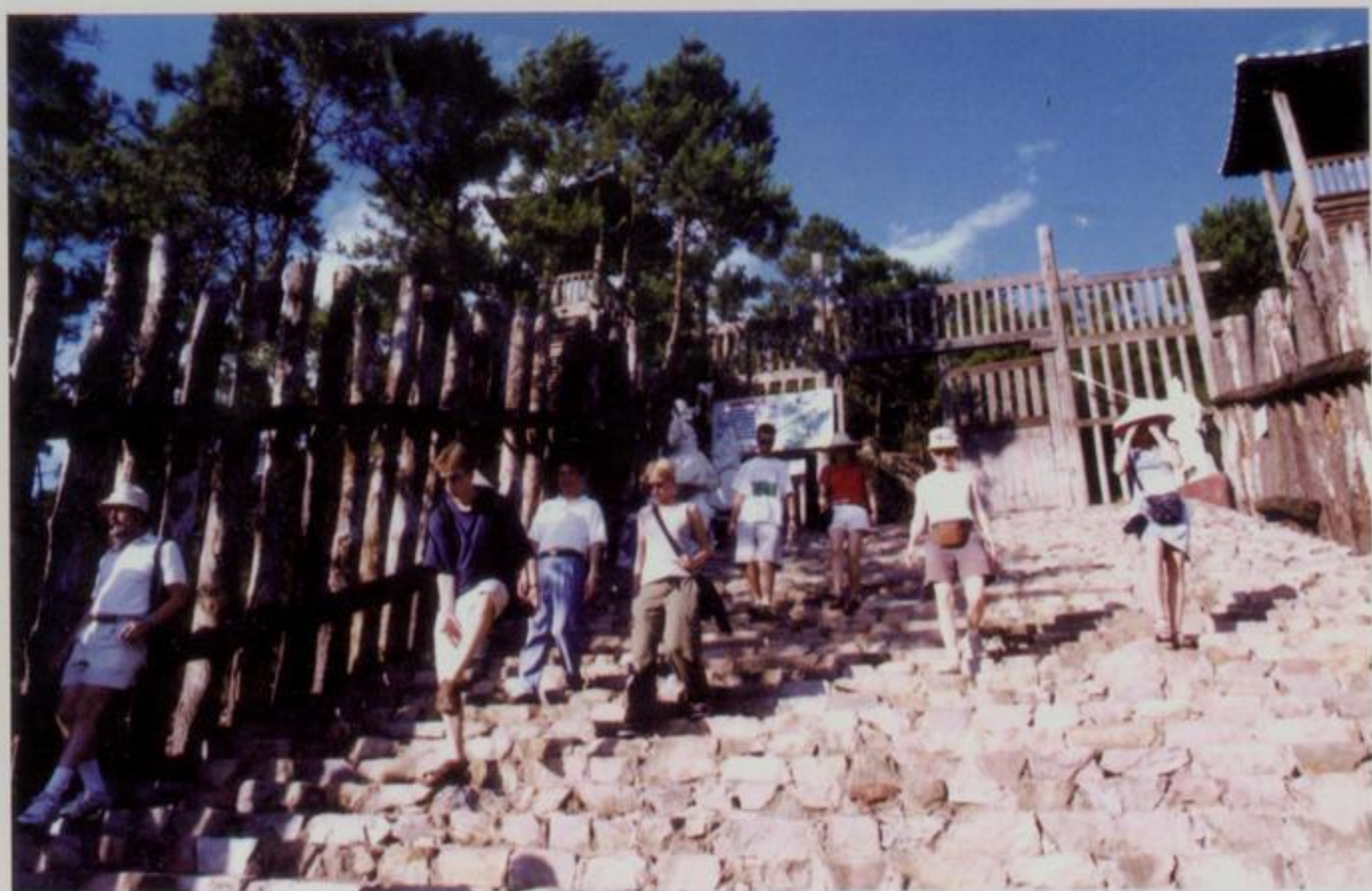
在合浦南国星岛湖游览 的外国游客