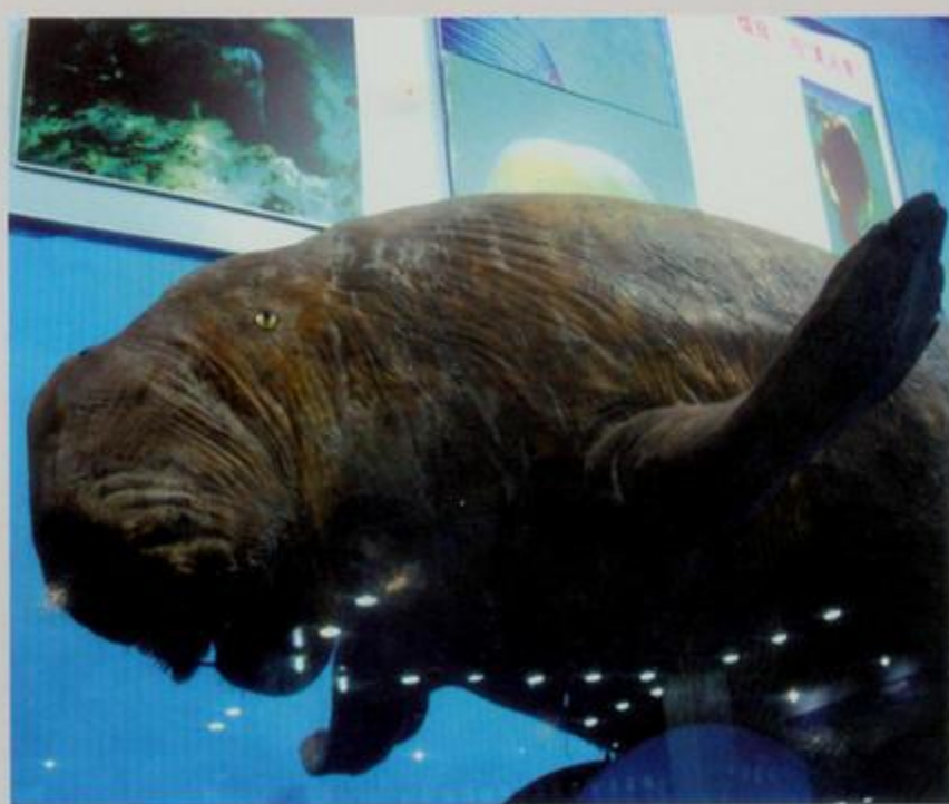
海底世界的儒艮标本