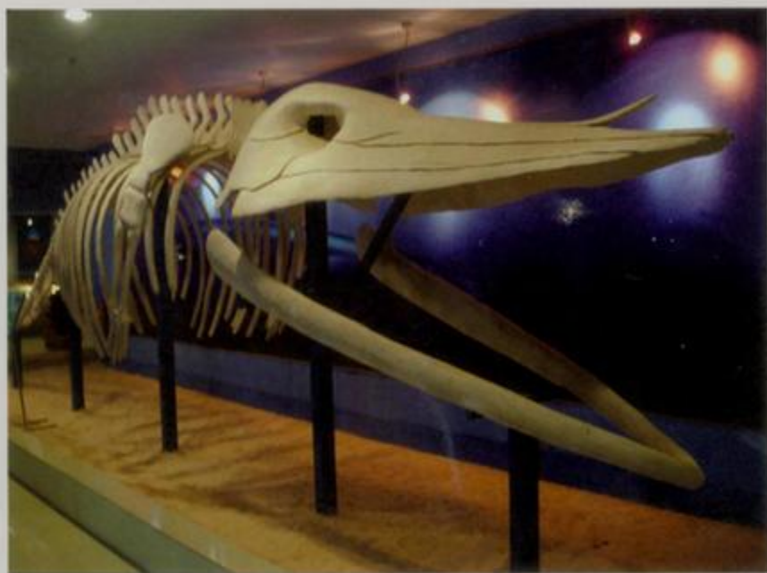
海底世界的鲸鱼骨骼标本