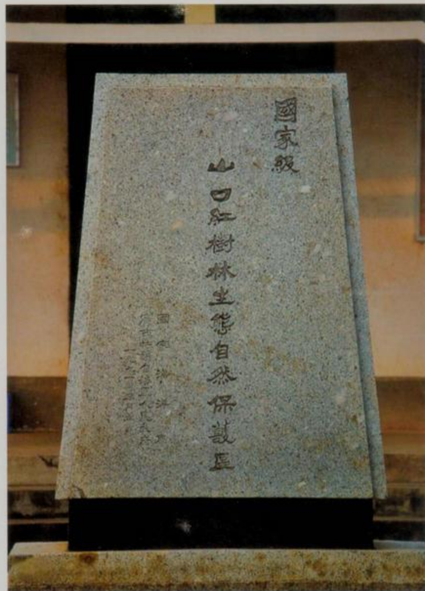
山口红树林生态自然保护区碑