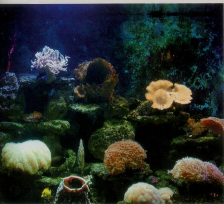
北海海洋之窗活体珊瑚展示缸

环型展缸长达28米，高3米，展示156个品种，2600多朵来自世界各地五彩斑斓的活体珊瑚。