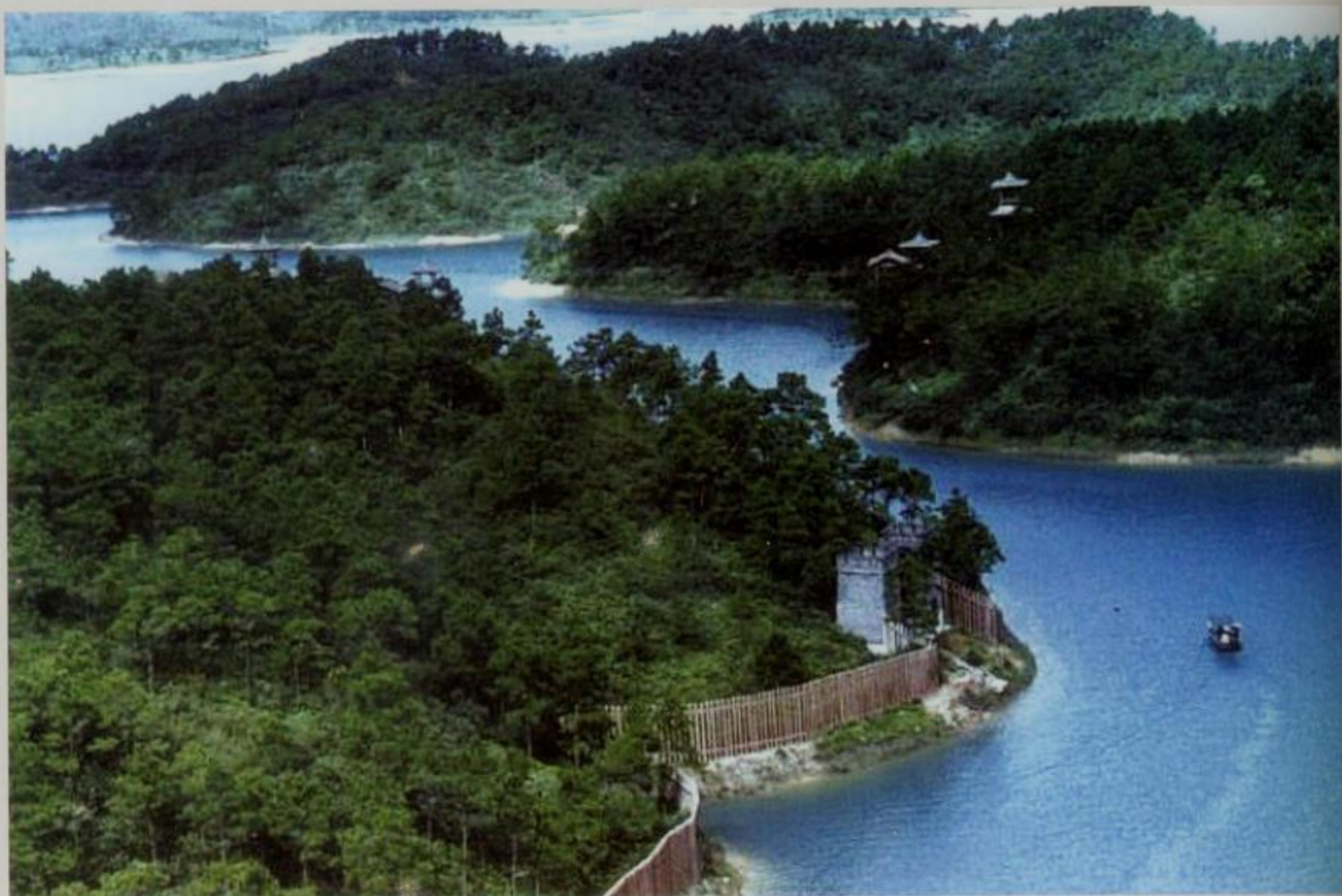
《水浒传》外景拍摄地