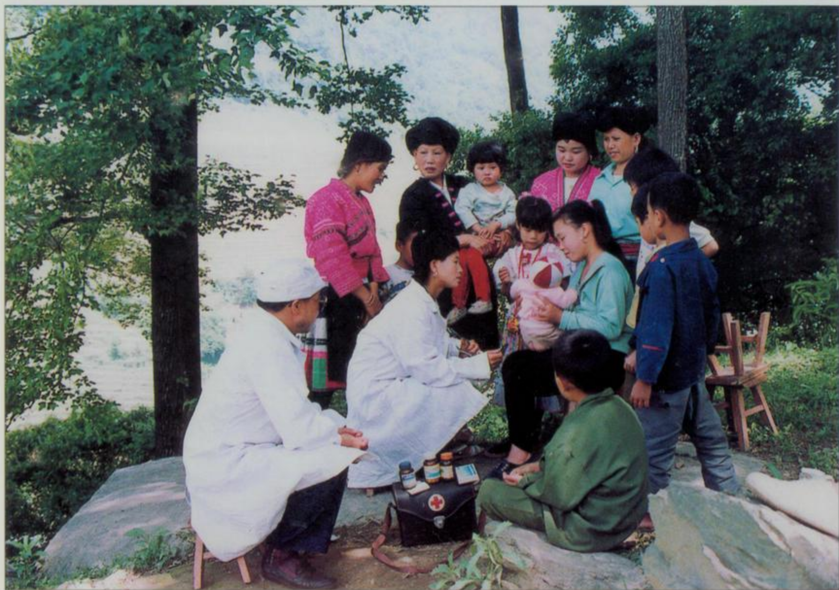
多年来，广西认真贯彻落实计划生育的基本国策，坚持“以宣传教育为主，经常工作为主，避孕节育为主”方针，全区少生人口800多万人，有效地控制人口过快增长，促进经济社会的协调发展。图1为壮族计生协会会员上门宣传服务。图2为基层计生服务站人员深入山村巡诊。