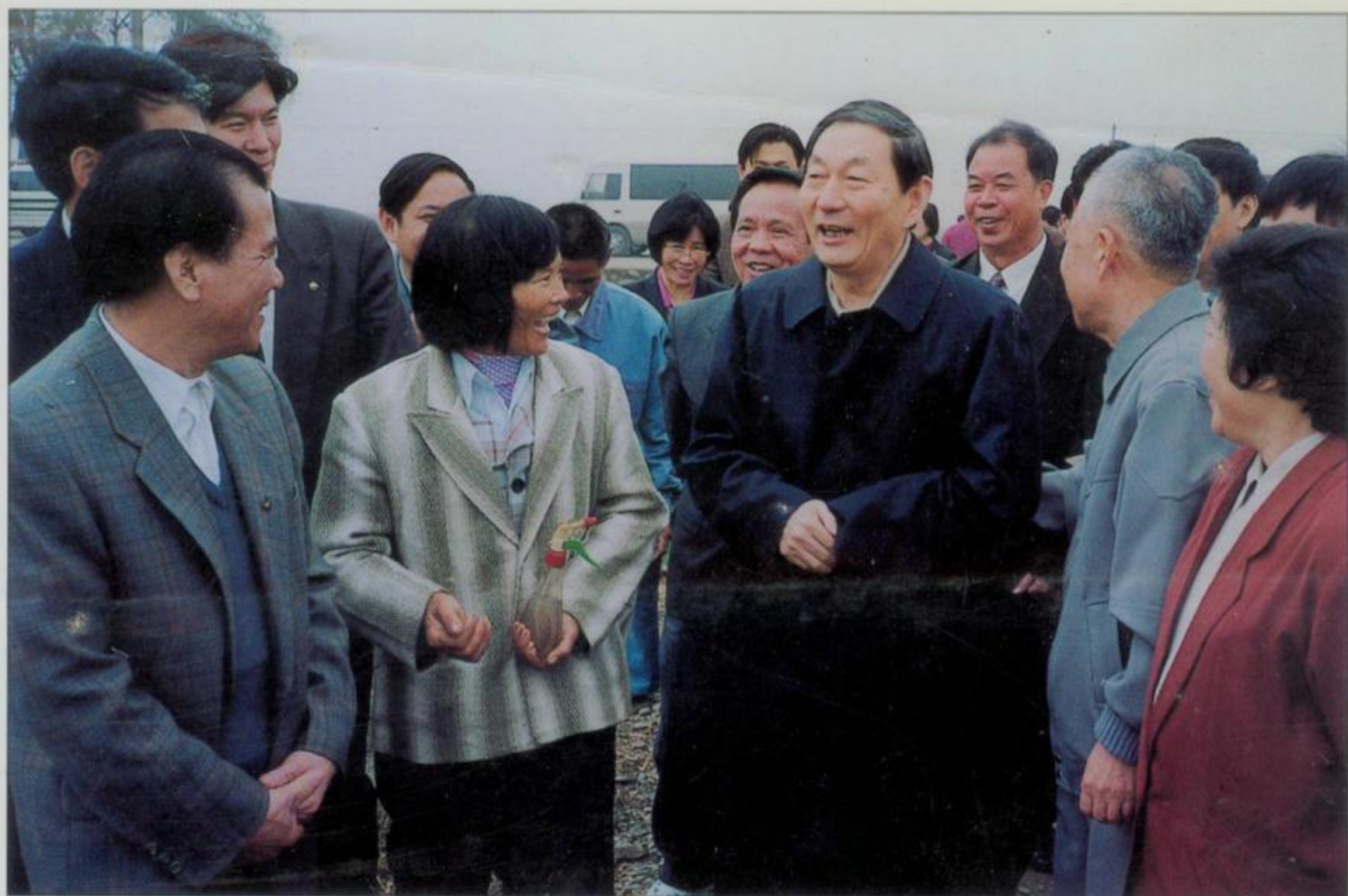
朱镕基总理在田阳县视察时，向菜农了解冬菜生产情况