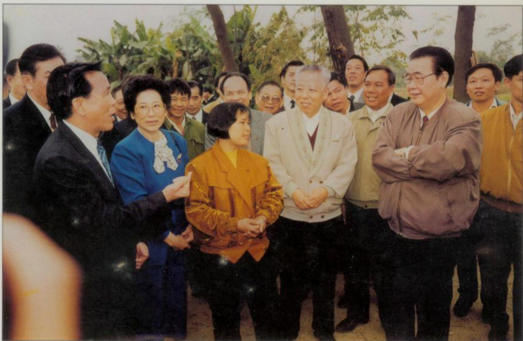
李鹏委员长十分关心广西的生产建设和群众生活。上图为他在南宁市郊区视察时，了解农村经济发展和农民生活情况。