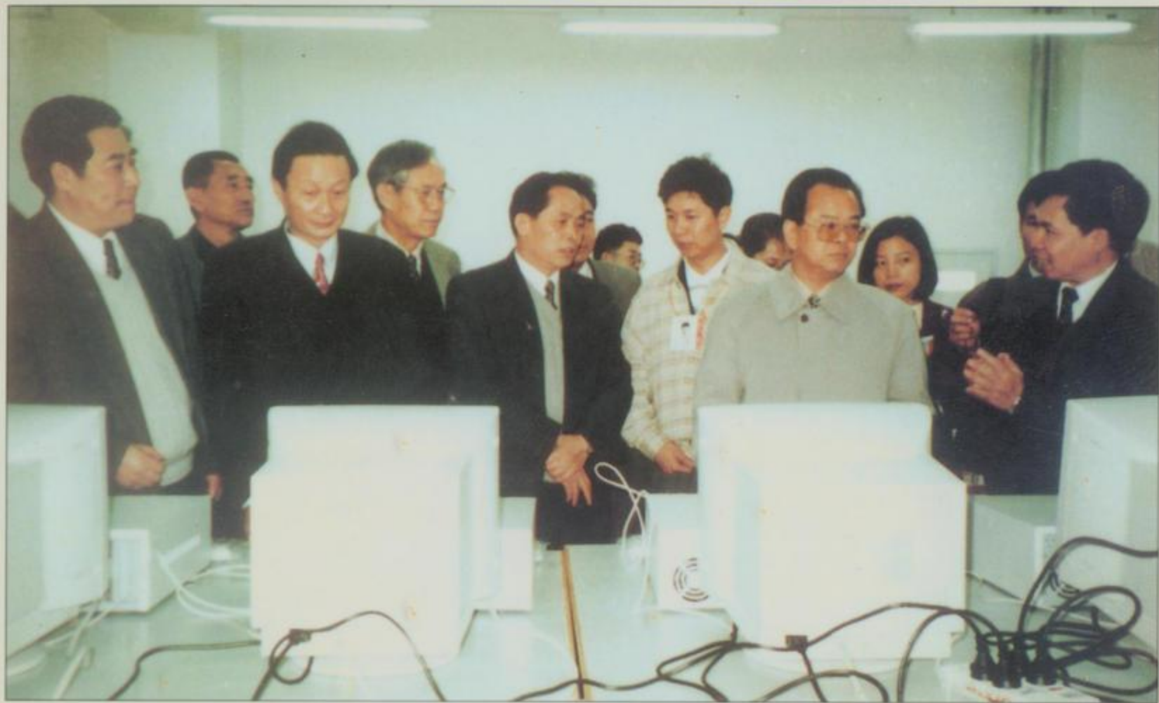
自治区党政领导，肩负时代重任，深入基层，深入实际，不失时机地带领广西各族人民开创新的业绩。图为自治区党委书记曹伯纯、自治区主席李兆焯、自治区党委副书记杨基常考察南宁高新技术开发区生产企业。