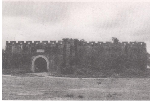
重建后的白龙珍珠城南城门

田汉于1962年春参观珍珠城遗址时写下的两首诗，于1988年建碑亭时，被刻嵌于亭正门的外墙，诗中的“方城有址堆残贝，古寺无踪剩断龟”，成为白龙珍珠城遗址的真实写照。