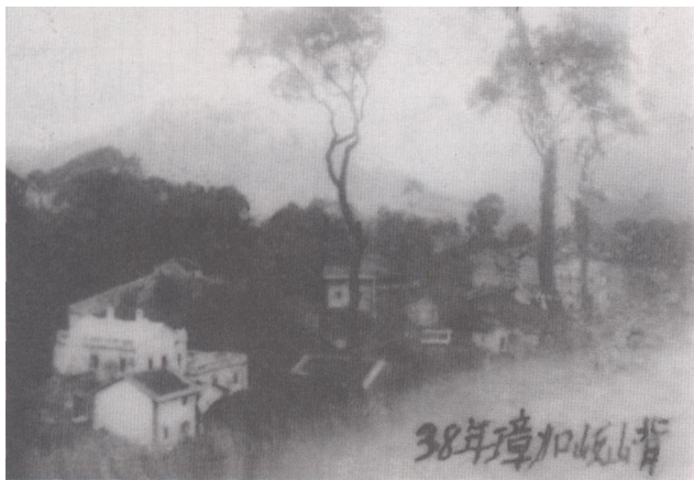
陈铭枢的出生地——合浦曲樟乡樟嘉村

由于北海中学的不断扩大和在校学生的日益增多，该馆的藏书和使用面积已不能适应形势发展的需要。该校于 1994 年新建了一座规模更大的图书馆。从此，这座原“合浦图书馆”完成了它所担负的大半个世纪的任务，但其历史和艺术价值早就受到市政府的重视，并于 1993 年被核准为市级文物保护单位。“合浦图书馆旧址”于 1996 年 10 月被辟为北中校史展览馆和陈铭枢纪念室，它与著名的民主革命家陈铭枢先生的名字永远联结在一起。