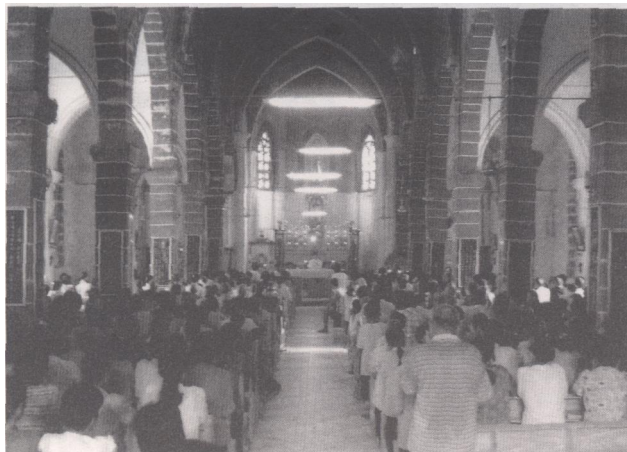
众信徒在涠洲天主堂做弥撒

由于涠洲天主堂具有重要的历史价值和艺术价值，它于1993年、1994年和2001年分别被核准为市级、自治区级和全国重点文物保护单位，成为反映近代天主教传入北海（涠洲）的历史见证。