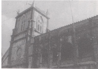
涸洲天主堂与神父楼（局部）